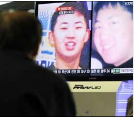
الابن الخليفة كيم جونج وون

سول/ متابعة: أعلن الزعيم الكوري الشمالي كيم جونج إيل يوم أمس الثلاثاء، ابنه الأصغر كيم جونج وون خليفة له في السلطة ليتواصل بذلك الحكم في عائلته للجيل الثالث لأول مرة في التاريخ المعاصر والحديث في العالم.