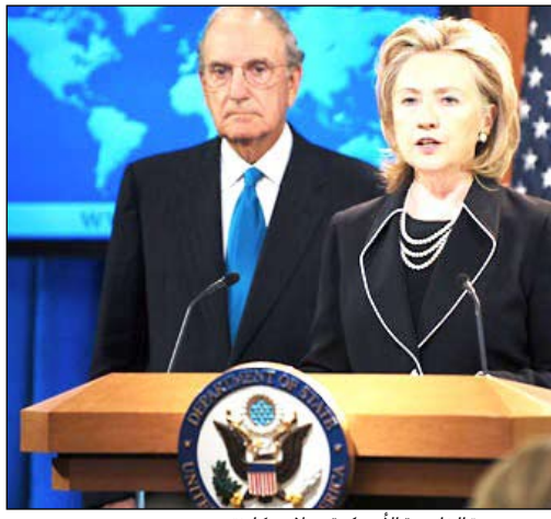
وزيرة الخارجية الأمريكية هيلاري كلينتون.

نيويورك/ متابعة: حذرت وزيرة الخارجية الأميركية هيلاري كلينتون سوريا من محاولة زعزعة استقرار جارتها لبنان والعراق، وذلك خلال لقائها في نيويورك أمس نظيرها السوري وليد المعلم، في حين أشار المتحدث باسم الخارجية الأميركية عقب اللقاء إلى أن المعلم أبدى اهتماماً باستئناف مسار السلام السوري الإسرائيلي. ويعد هذا اللقاء الذي عقد على هامش اجتماعات الجمعية العامة للأمم المتحدة في نيويورك، الثاني بين الوزيرين منذ مارس العام الماضي حين التقيا لفترة قصيرة على هامش مؤتمر المانحين لقطاع غزة في شرم الشيخ بمصر. وقال المتحدث فيليب كراولي إن كلينتون «كانت مباشرة للغاية وقالت بوضوح إن كان الأمر يتعلق بلبنان أو بالعراق، فإننا نسمع أي محاولة لتقويض استقرار هذين البلدين. وزعم العودة التدريجية للدفء في علاقات واشنطن ودمشق،