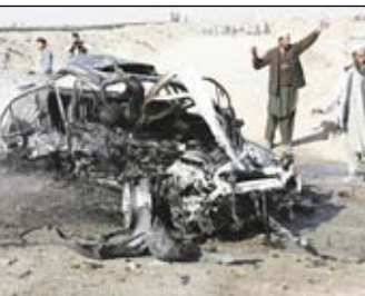
سيارة نائب حاكم بعد الهجوم.

غزنة (أفغانستان) 14 أكتوبر/ رويترز: قال قائد شرطة إقليمية في أفغانستان إن انتحاريًا كان يركب عربة ويكشو مزودة بمحرك قتل نائب حاكم إقليم غزنة وخمسة آخرين يوم أمس الثلاثاء. وشهد هذا العام سقوط أكبر عدد من القتلى في أفغانستان منذ الإطاحة بحركة طالبان من الحكم عام 2001 بعد أن بلغت أعداد القتلى من العسكريين والمدنيين مستويات قياسية. وخلال العام الحالي وحتى الآن تجاوز عدد القتلى من القوات الأجنبية العدد في عام 2009 كله. كما كثف المتشددون من الهجمات التي تستهدف مسؤولين. وقالت الأمم المتحدة في تقرير ربع سنوي عن البلاد هذا الشهر إن هناك أبناء عن أن 21 شخصاً في المتوسط يجري اغتيالهم كل أسبوع بعد أن كان العدد سبعة أسبوعياً في وقت سابق من العام الجاري.