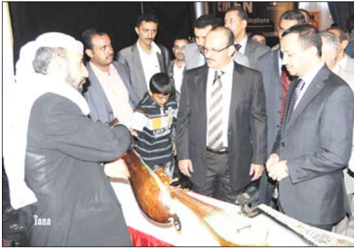
أثناء زيارة المعرض