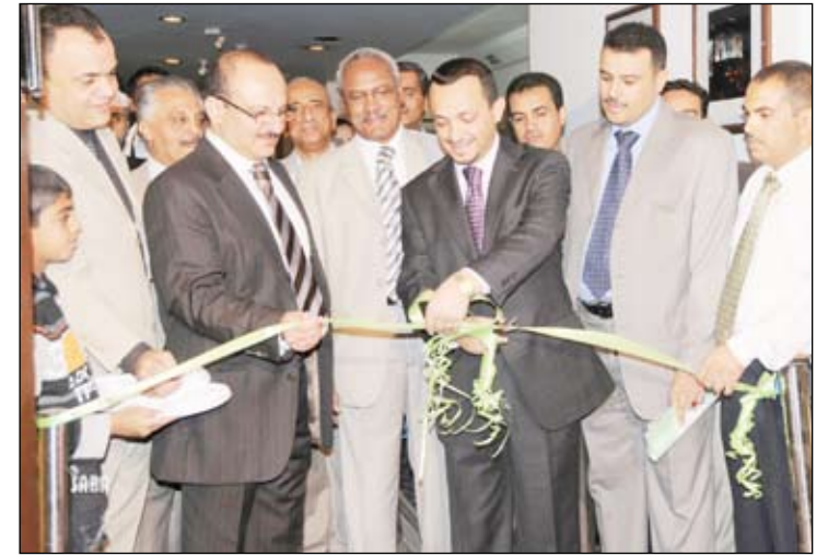
لدى افتتاح المعرض الخاص بالصورة