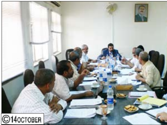
من الاجتماع الدوري لمجلس إدارة المؤسسة

إلى إقرار التقرير المالي لنشاط المؤسسة للفترة من يناير إلى يونيو 2010م وكذا تقرير السلامة والصحة المهنية بالمؤسسة. وفي الاجتماع تم المصادقة على التقرير الخاص بمستوى تنفيذ قرارات المجلس خلال دورته 2010م.