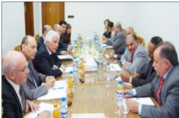
جلسة مباحثات يمنية سورية

وزير الإعلام السوري أكد من جانبه ضرورة توثيق التعاون الإعلامي بين جميع المؤسسات الإعلامية في البلدين و وضع برامج تنفيذية للارتقاء بعلاقات التعاون مستقبلاً، مشيراً إلى دور الإعلام وأهميته في تعميق أواصر الإخوة بين الشعبين الشقيقين. وكان وزير الإعلام السوري الدكتور محسن بلال ووزير الإعلام اليمني عبدالمجيد الوكيلين (سبا) وكذا إنتاج أعمال درامية تعكس واقع البلدين الاقتصادي والاجتماعي والثقافي وتفصيل الحياة اليومية للشعبين الشقيقين في البلدين لما للإعلام من دور وقوة تأثير في ودم الهوية وتقريب المسافات. وقد أكد الوزير اللوزي عمق ومتانة علاقات الإخوة التي تربط الشعبين اليمني والسوري، مشدداً على أهمية تطوير التعاون الإعلامي لسدوره في ترسيخ علاقات الشعبين الشقيقين في البلدين. وأشار بمواقف سورية الوطنية والقومية الثابتة و دفاعها عن الحقوق العربية ودعمها لوحدة اليمن واستقراره، ومنها بدور الإعلام السوري في الدفاع عن القضايا العربية المستندة إلى رؤية سورية ونهجها القومي.