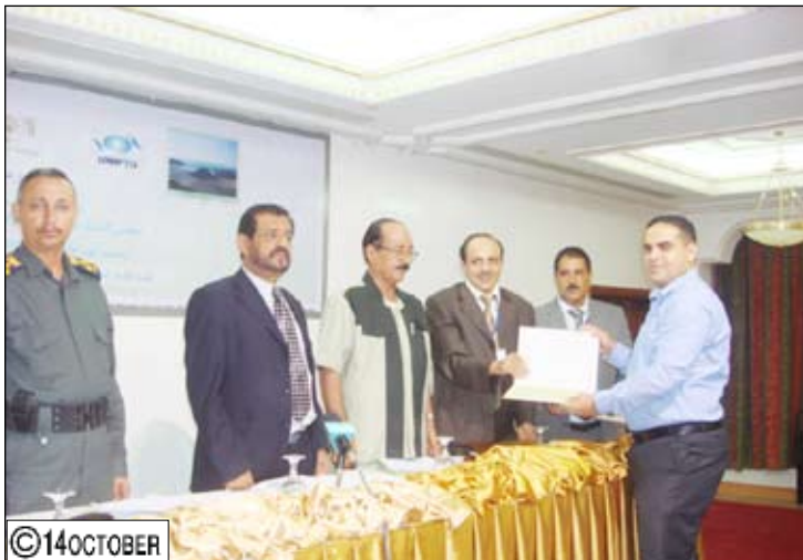
من فعاليات ورشة العمل في تعز