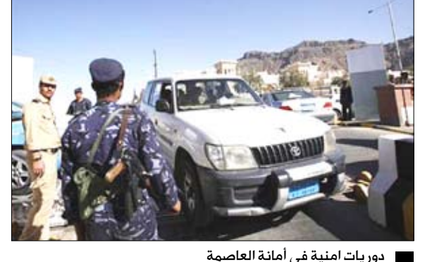
دوريات أمنية في أمانة العاصمة

أفرت تسعة عشرة سفينة ناقلة يمينية الجديدة والمخاض خلال الأيام التسعة الماضية 116 ألفاً و917 طناً من الحب والمشتات النفطية إضافة إلى الحياويات والمواشي والسيارات. وأوضح تقرير ملاحى صادر عن مؤسسة مولى البحر الأحمر اليمنية أن ثمانية سفن أفرغت في ميناء الجديدة 31 ألف طن من الذرة و 21 ألفاً و300 طن من