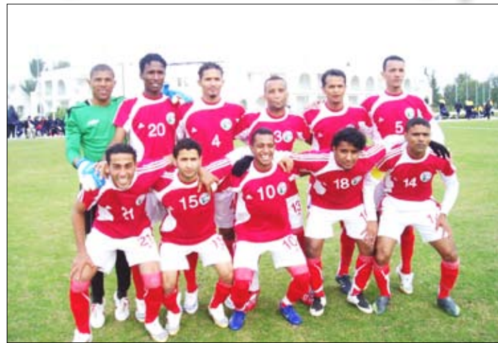
العماني ويغادر منتخب إيران.

الاحتمالات المتوقعة إيران × عمان - فوز إيران الأردن × الكويت - تكافؤ المنتخبين