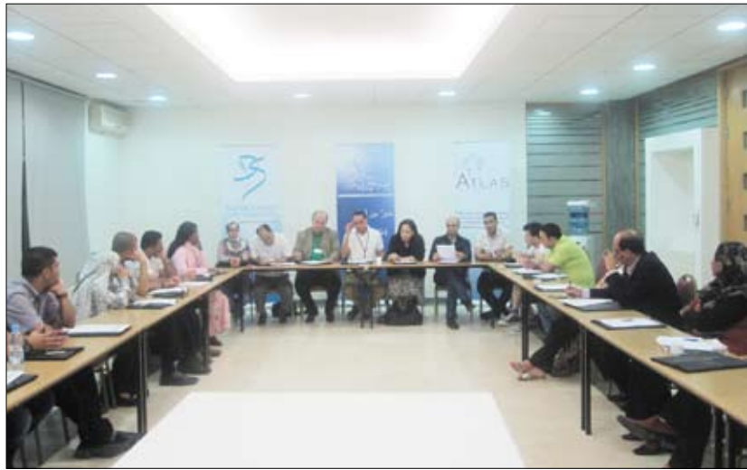
من الجلسة الافتتاحية للجامعة الصيفية

من القيادات السياسية والنخب ونظم التعليم الماضية. كما تطرق الخبير المصري في السياق نفسه إلى غياب قيم التقدم مثل التعددية والغربية ومالمة المعرفة الإنسانية وحقوق المرأة.