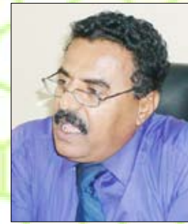
أبو بكر أحمد علي

الثورة.. وقد قام الإمام أحمد بإعدام معظم الأحرار (قادة ثورة 48م) ثم كانت المحاولة الثانية للانقلاب العسكري في عام (55م) بقيادة جميل جمال وقد فشل هذا الانقلاب أيضاً .. لكن ثورة 26 سبتمبر استفادت من هذه الثورات حيث تم التخطيط لها بشكل دقيق وتكلمت بالنجاح.