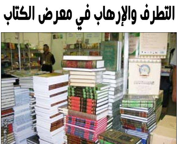
بعض الكتب في معرض الكتاب

المعرض عدد من دور النشر اليمنية.. ومنها دار عبادي بصنعاء. 2 - كثافة الكتب ذات التوجه التطرف والإرهاب. 3 - ركافة برنامج الأنشطة المصاحبة للمعرض. 4 - استمرار الهيئة العامة للكتاب في إقامة المعرض رغم ثبوت فشلها.. في مساحة لا تصلح لأن تكون مصححة للمعرض. 5 - عدم تسديد الالتزامات التي على رئيس الهيئة لبعض دور النشر من المعارض السابقة.. ومنها دار الحوار "سورية" التي تطالبه بأكثر من عشرة آلاف دولار قيمة كتب لدى رئيس الهيئة من المعرض السابق. 6 - عدم تسديد الالتزامات التي على رئيس الهيئة لبعض دور النشر من المعارض السابقة.. ومنها دار الحوار "سورية" التي تطالبه بأكثر من عشرة آلاف دولار قيمة كتب لدى رئيس الهيئة من المعرض السابق. 7 - عدم تسديد الالتزامات التي على رئيس الهيئة لبعض دور النشر من المعارض السابقة.. ومنها دار الحوار "سورية" التي تطالبه بأكثر من عشرة آلاف دولار قيمة كتب لدى رئيس الهيئة من المعرض السابق. 8 - عدم تسديد الالتزامات التي على رئيس الهيئة لبعض دور النشر من المعارض السابقة.. ومنها دار الحوار "سورية" التي تطالبه بأكثر من عشرة آلاف دولار قيمة كتب لدى رئيس الهيئة من المعرض السابق. 9 - عدم تسديد الالتزامات التي على رئيس الهيئة لبعض دور النشر من المعارض السابقة.. ومنها دار الحوار "سورية" التي تطالبه بأكثر من عشرة آلاف دولار قيمة كتب لدى رئيس الهيئة من المعرض السابق. 10 - عدم تسديد الالتزامات التي على رئيس الهيئة لبعض دور النشر من المعارض السابقة.. ومنها دار الحوار "سورية" التي تطالبه بأكثر من عشرة آلاف دولار قيمة كتب لدى رئيس الهيئة من المعرض السابق.