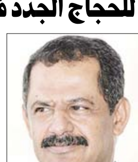
د. علي محمد مجور

■ صنعاء / سيا: أكد رئيس مجلس الوزراء الدكتور علي محمد مجور أهمية الإعداد والتنظيم الجيد لجميع الجوانب المتعلقة بأداء الحجاج اليمنيين لموسم الحج في موسم العام الحالي 1431 هـ وما يضمن أداءهم لهذه الشعيرة في أجواء إيجابية بعيداً عن أية إشكاليات أو منغصات. ووجه رئيس الوزراء باستيعاب جوانب عملية الحج في ما يخص النسبة المخصصة لليمن على الذين لم يسبق لهم الحج في العام الماضي 1430 هـ أو أداء العبرة في العام الحالي، ما من شأنه تأكيد مبدأ تكافؤ الفرص وعدالتها بإفساح المجال أمام أكبر قدر ممكن من الحجاج الجدد الراغبين في أداء فريضة الحج خلال الموسم الحالي. وشدد الدكتور مجور على وزارة الأوقاف والإرشاد ضرورة الالتزام الصارم بتنفيذ هذا الأمر وتحملها المسؤولية عن أي تعقيد أو مخالفة له.