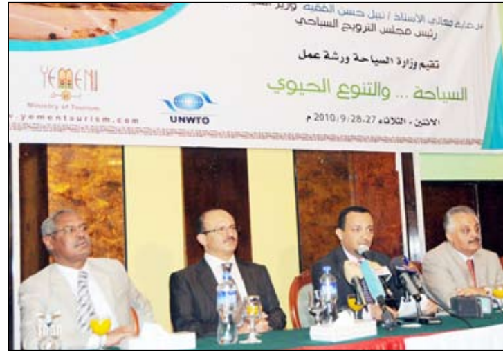
من ورشة العمل في اليوم العالمي للسياحة