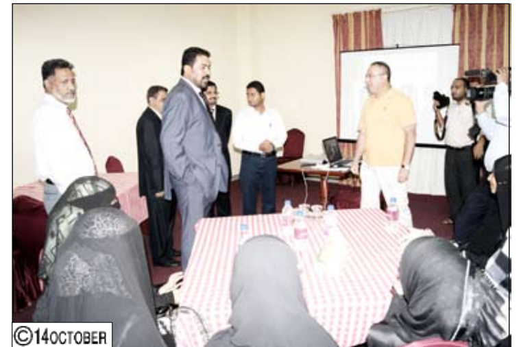
من فعاليات اليوم العالمي للسياحة في عدن

فهي زاخرة بالغطاء السياحي الذي يحتاج إلى استثمار وترويج إعلامي.. مؤكداً أن السياحة حظيت باهتمام القيادة السياسية وباتى نهضتها فخامة الرئيس علي عبدالله صالح رئيس الجمهورية وإعطائه مساحة من برنامجه للاهتمام بالسياحة.. مشدداً على تكاتف الجهود المجتمعية والإعلامية في نشر الوعي الثقافي السياحي والخوض في مضمار الاستثمار السياحي..