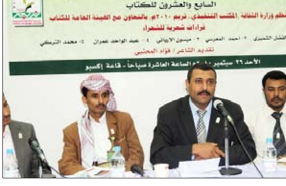
ضمن الأنشطة الثقافية المصاحبة لمعرض صنعاء الدولي للكتاب

ومن المقرر أن تقام اليوم ضمن فعاليات المعرض محاضرة للعلامة عبدالرحمن بن علي الأخطا الكريمة" يقدمها الدكتور عبد الواحد المشهور في حفيظ بعنوان "علماء وصلحاء تريم