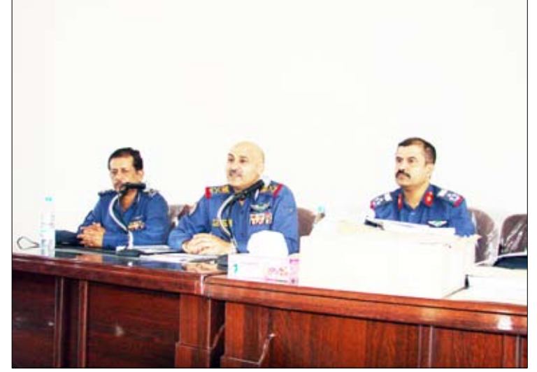
من حفل تدشين التمرين التعبوي للقوات الجوية والدفاع الجوي

والعمل الجاد وبروح معنوية عالية أثناء تنفيذ التمرين بما يحقق الأهداف المرجوة منه. إلى ذلك تفقد قائد القوات الجوية القاعات والصالات والوثائق المعدة لتنفيذ التمرين والتأكد من جاهزيتها ثم أعطى الإذن ببدء تنفيذ التمرين الذي يستمر لمدة يومين.