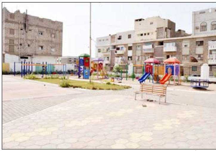
أحد أحياء مديرية المنصورة

شوارع وبيع حداد بكلفة حوالي (62) مليون ريال. وأوضح أن مشروع سفلة بلوك (12) بكلفة (250) مليون ريال بطول (4) كيلومترات و(800) متر تم الإعلان عن مناقصة له.