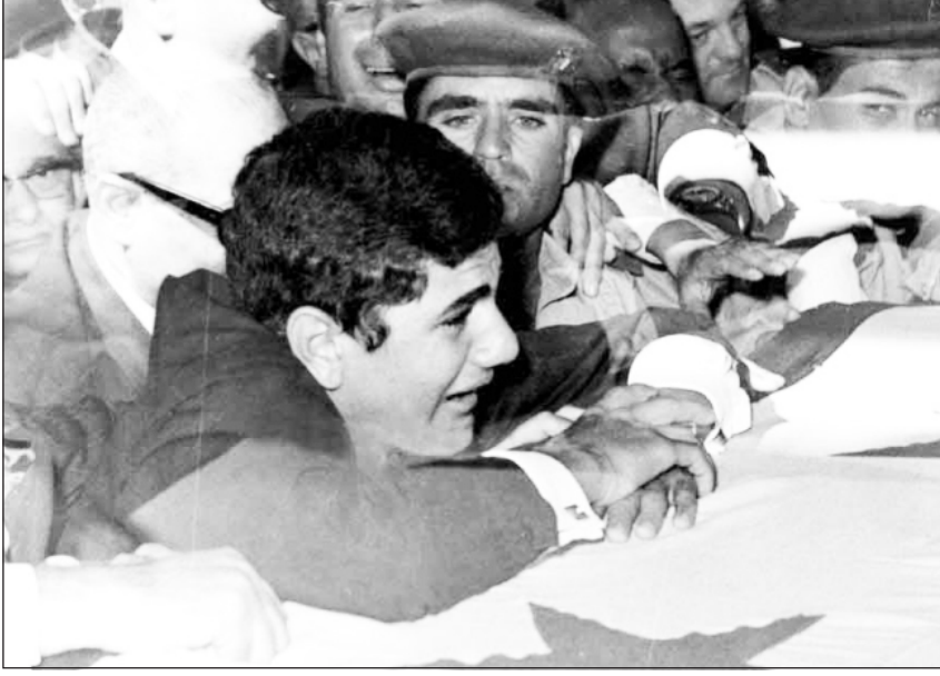
نجل الزعيم الراحل يبكي على نعش أبيه

وماهى التحركات التى رصدها الوزير سامى شرف ضد مصر ورفعها فى مذكرة للرئيس؟