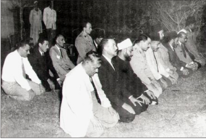
المرشد العام حسن الهضيبي يؤم صلاة الثورة والإخوان ويبدو جمال عبدالناصر في الصف الخلفي الأول من اليسار