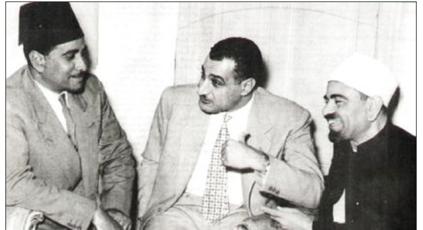
جمال عبدالناصر وحامد أبو النور والشيخ محمد علي أثناء اللقاء الذي عرض فيه الإخوان تصورهم لحجاب المرأة .

واللافت للنظر ان الاخوان المسلمين قبلوا على مضض - او تظاهروا بقبول - رفض جمال عبدالناصر لجميع المطالب التي عرضها عليه في اللقاءات السابقة، لكنهم أصروا على مطلب واحد يتعلق بضرورة الشروع باصدار مرسوم يقضي بفرض الحجاب على النساء، وقد حدث ذلك عندما اتصل به المرشد العام حسن الهضيبي واخبره بان مكتب الارشاد كلف كلا من