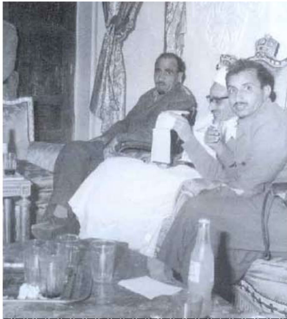
السلال ويجواره كل من القاضي الإيراني وجزيلان