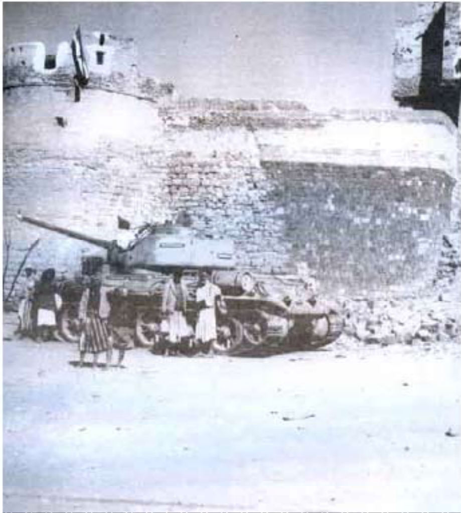
قصر السلاح يرفرف عليه علم الثورة بعد أن كان قبل ثلاثة أيام منها سجنًا للثوار