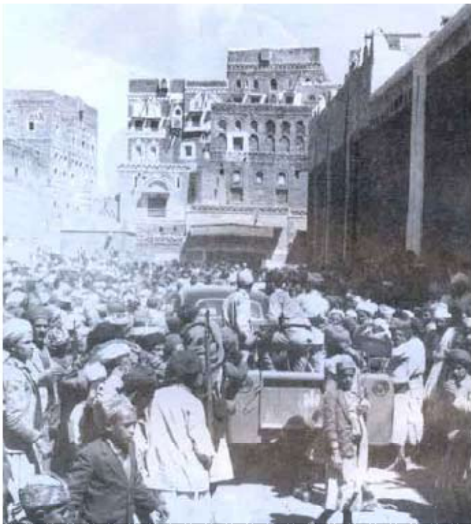
ساحة الجامع الكبير بصنعاء تشهد تجمعا للجماهير في يوم الجمعة تاسع أيام الثورة