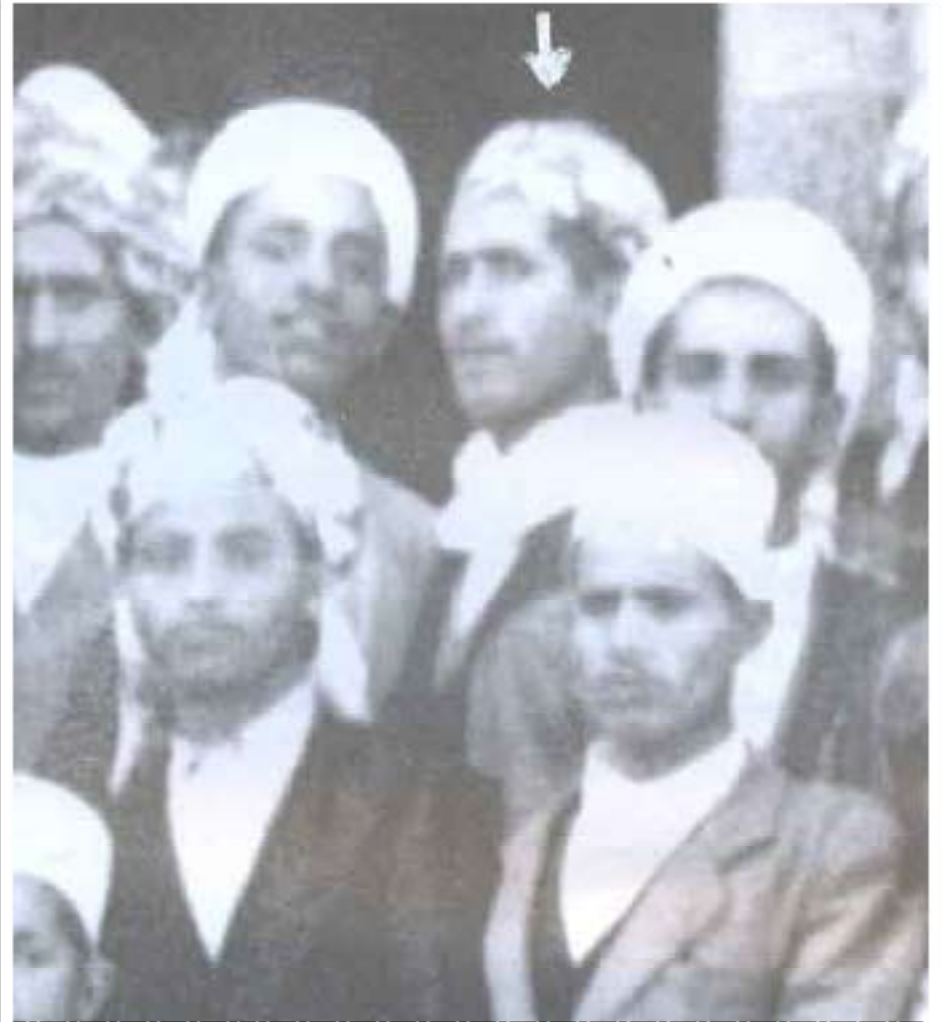
صورة نادرة للشهيد علي عبدالمقني .. مهندس الثورة وعتقها المدبر