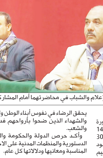
وزير الإعلام والشباب والرياضة

يقف الرضاء في نفوس أبناء الوطن والمناضلين والشهداء الذين ضحوا بأرواحهم فدوا للوطن والشعب. وأكد حرص الدولة والحكومة والمؤسسات الدستورية والمنظمات المدنية على الاحتفاء بهذه المناسبة ومعانيها ودلالاتها كل عام.