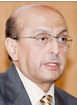
د. أبو بكر القربي

الديمومة والحيوية والنماء المستمر. وقال: "ومما لا شك فيه أن نموذجية العلاقات اليمنية السعودية وما تتميز به من طبيعة خاصة وعمق تاريخي وخصائص متفردة جعلت البلدين يحكم الجوار الجغرافي وأواصر القربى القائمة بين الشعبين، يمثلان تماسك الجسد الواحد ما يؤكد وحدة الهدف والمصير". وفي حين لفت وزير الخارجية إلى أن جوانب التعاون السياسي والاقتصادي والاستثماري تتصدر رصيد الإنجازات المتسارعة للعلاقات بين البلدين، أكد في الوقت ذاته أن خصوصية العلاقات اليمنية السعودية تتجسد في الدعم المتصور السخي الذي تقدمه المملكة لليمن، وفي الموقف السياسي المتمسك بالوحدة اليمنية والداعم لأمن واستقرار اليمن، فضلاً عن دعم خادم الحرمين الشريفين الملك عبد الله بن عبد العزيز لإعطاء الأولوية للعلامة اليمنية في أسواق العمل بدول الخليج العربية، وتأكيد استمرار أهمية التصاميم التي يمتدحها المجتمع الدولي، كما أعلن عن اعتزاز وتقدير كل أبناء الشعب اليمني، ممنًا تميئنا عالياً ذلك الدعم وتلك