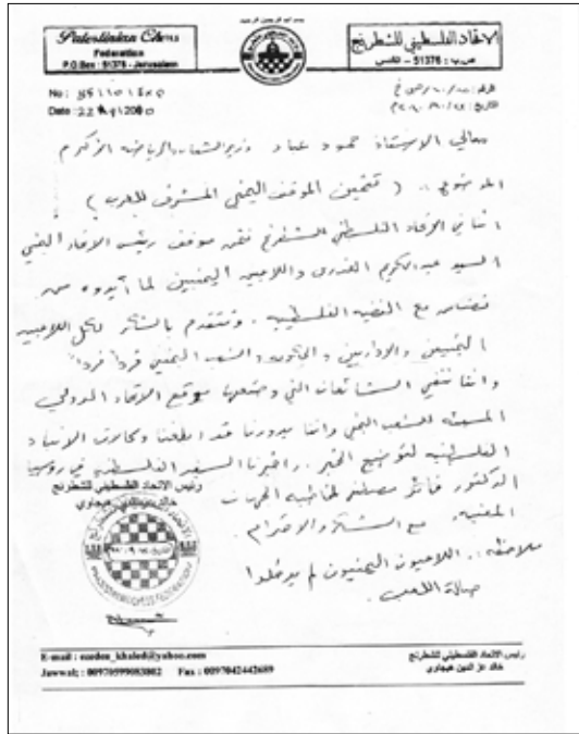
رسالة الاتحاد الفلسطيني للشطرنج