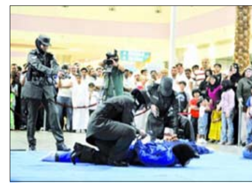
عرض عسكري للشرطة النسائية في أبوظبي