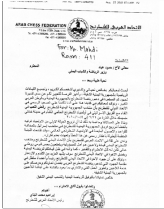
رسالة الاتحاد العربي للشطرنج