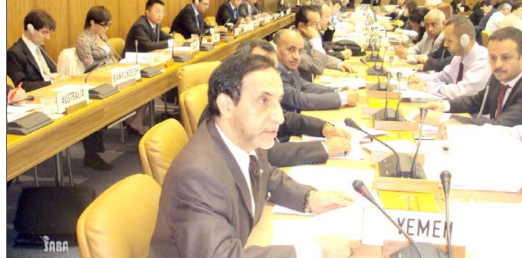
د. المتوكل أثناء الاجتماع بمنظمة التجارة العالمية