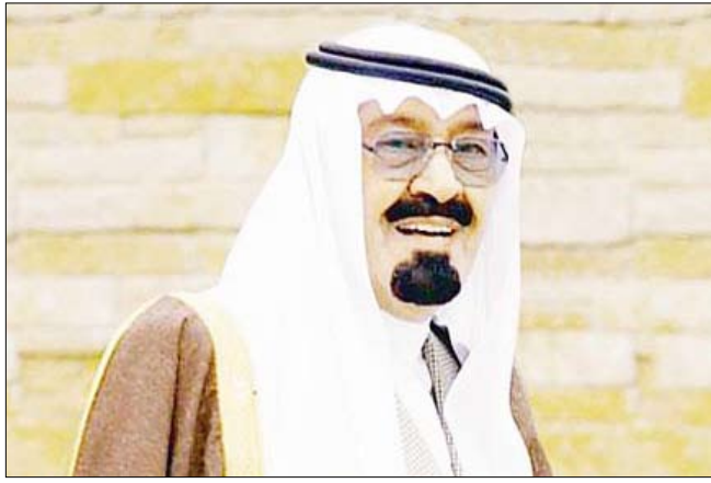
الملك عبدالله بن عبد العزيز