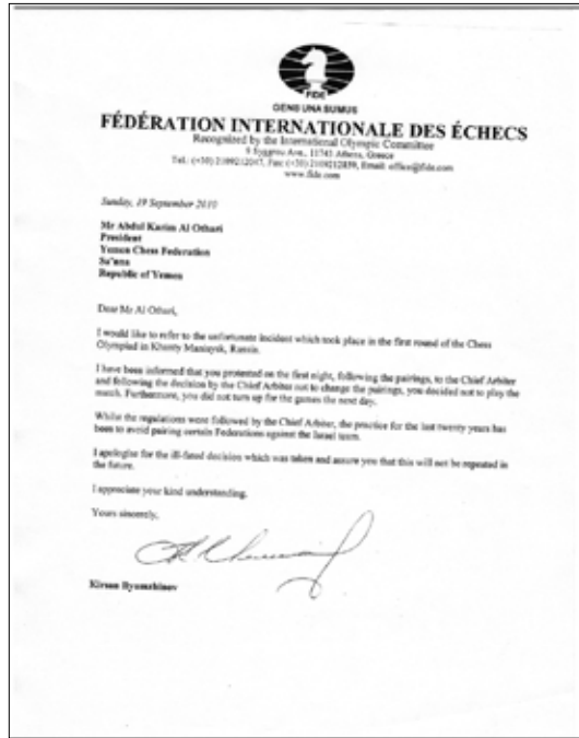
رسالة الاتحاد الدولي للشطرنج