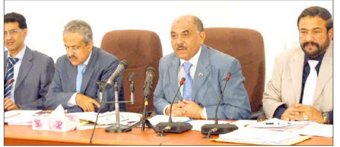
اللوزي خلال افتتاح اجتماع اللجنة العليا للتخطيط البرامجي