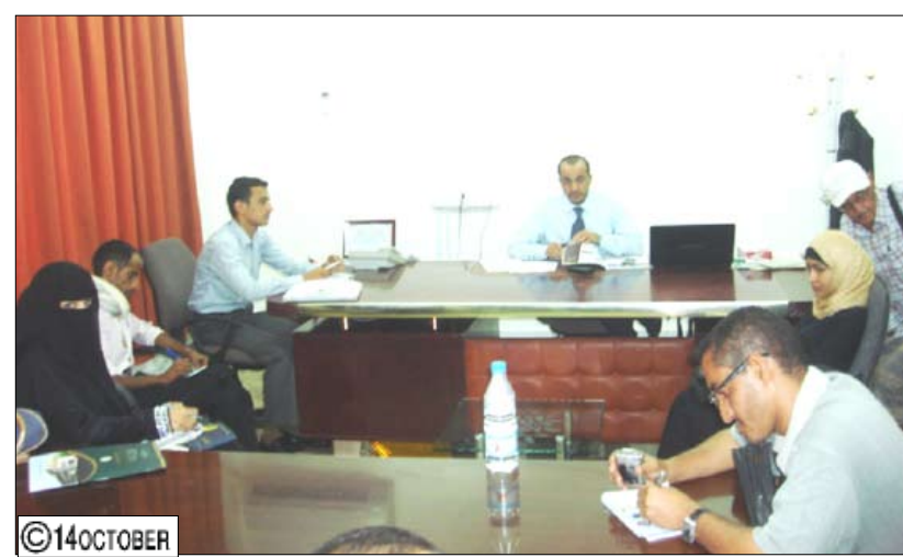
من اللقاء الصحافي بمركز الأمل في تعز

المركز يركز على البحث العلمي في طرق الوقاية من المرض وتلقيحها مع العلاج الإشعاعي للمريض . وقال: إن القيادة السياسية بقيادة المحافظة ومجموعة هائل أولت اهتماماً كبيراً لمحافظة تعز وللمركز لأنه يخدم شريحة كبيرة من محافظات تعز وإب والحديدة ويقدم خدمات نوعية ووقائية وعلاجية.