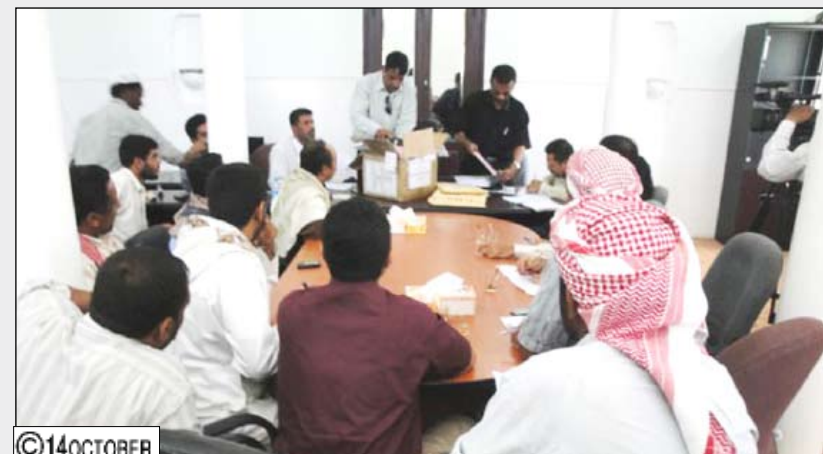
خلال فتح مظاريف المشاريع لتضري السيول