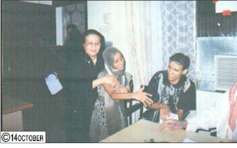
من نشاطات جمعية الفجر الجديد