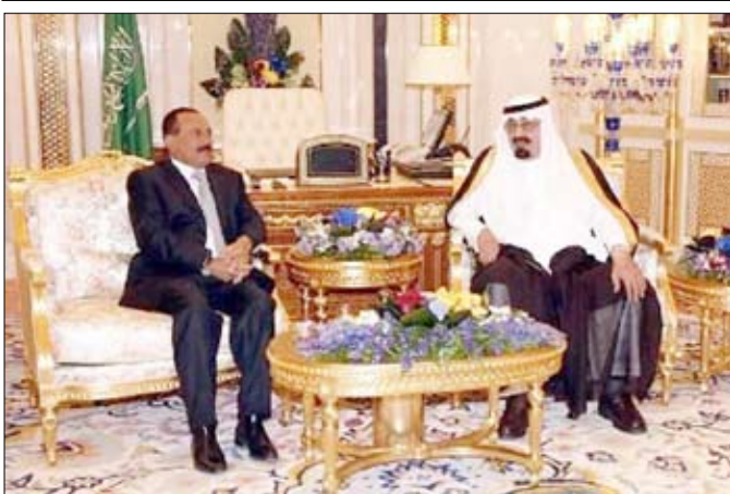
الملك عبدالله مع الرئيس علي عبدالله صالح

الجزيرة العربية والخليج. ولقد أكد الملك فهد بن عبدالعزيز رحمه الله حينها على ضرورة تأهيل اليمن للانضمام إلى دول الخليج وتوجيه الصناديق الخليجية لدعم برامج التنمية في اليمن وتأهيل الاقتصاد اليمني للانضمام في اقتصاديات دول الخليج مما يعني أن تخلي اليمن للمشاكل الاقتصادية التي تعاني منها سوف يجعل من اليمن عضواً فاعلاً في المنظومة الخليجية، ويسهم بشكل إيجابي على المستوى الأممي والسياسي والاقتصادي فيها. وقد جسدت المملكة العربية السعودية تلك الخطوة من خلال تفعيل