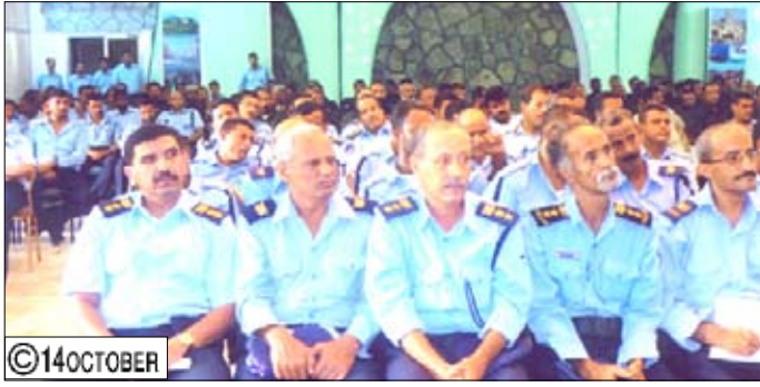
قيران يلقى محاضرة عن دور الحركة الوطنية