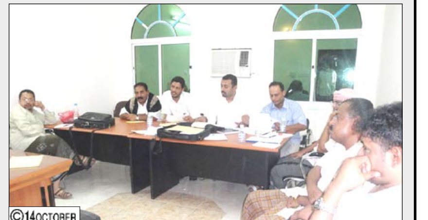
خلال فتح مظاريف المشاريع لتضري السيول

المناطق المتضررة من كارثة السيول والأمطار في محافظتي حضرموت والمهرة مساء يوم أمس الأول بمدينة سيئون الاجتماع الدوري للإدارة التنفيذية للصندوق وذلك بحضور الإخوة مدراء فروع الصندوق في كل من سيئون والمكلا بحضرموت والغيظة بمحافظة المهرة حيث تم في الاجتماع مناقشة تقارير الإنجاز المنفذة خلال الشهر المنصرم ومراجعة أداء تلك الفروع من خلال وضع النقاط على الحروف لتحسين مستوى الأداء .