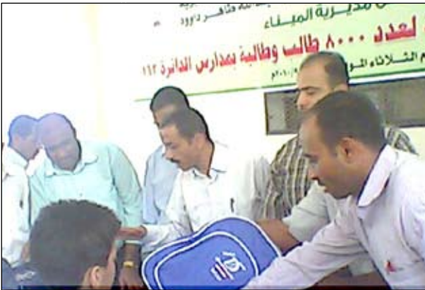
خلال تدشين توزيع الحقيبة المدرسية في مديرية الميناء بالحديدة