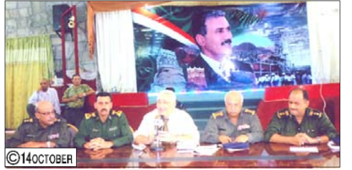
قيران يلقى محاضرة عن دور الحركة الوطنية

قيام الوحدة اليمنية وكان الفكر اليمني كله سلاحاً في معركة الثورة والوحدة، مشيراً إلى أن عدن كانت رائدة في عدة اتجاهات داخل الحركة الوطنية وداخل الفكر الوطني المعاصر إذ كان لمدينة عدن السبق في صنع الأحداث الوطنية على الساحة اليمنية باعتبارها جزءاً لا يتجزأ من اليمن ولا يمكن أن نجد نفسها خارج اليمن. وأوضح المهدي أن الاحتفالات بأعياد الثورة اليمنية الهجبة والمهيبه سبتمبر / أكتوبر / نوفمبر وما تحمله من معان عميقة ودلالات ترتبط بتلك التحولات والإنجازات الشامخة التي تحققت للوطن في ظل راية ثورته ووحدته بزعامه فخامة الرئيس علي عبدالله صالح قائد مسيرة الوحدة وباني نهضة الدولة اليمنية الحديثة، وتضمن أن يعيد الله علينا هذه المناسبة وقد تحقق لشعبنا المزيد من المنجزات الوطنية والتنموية ودوام الاستقرار والتقدم والرخاء.