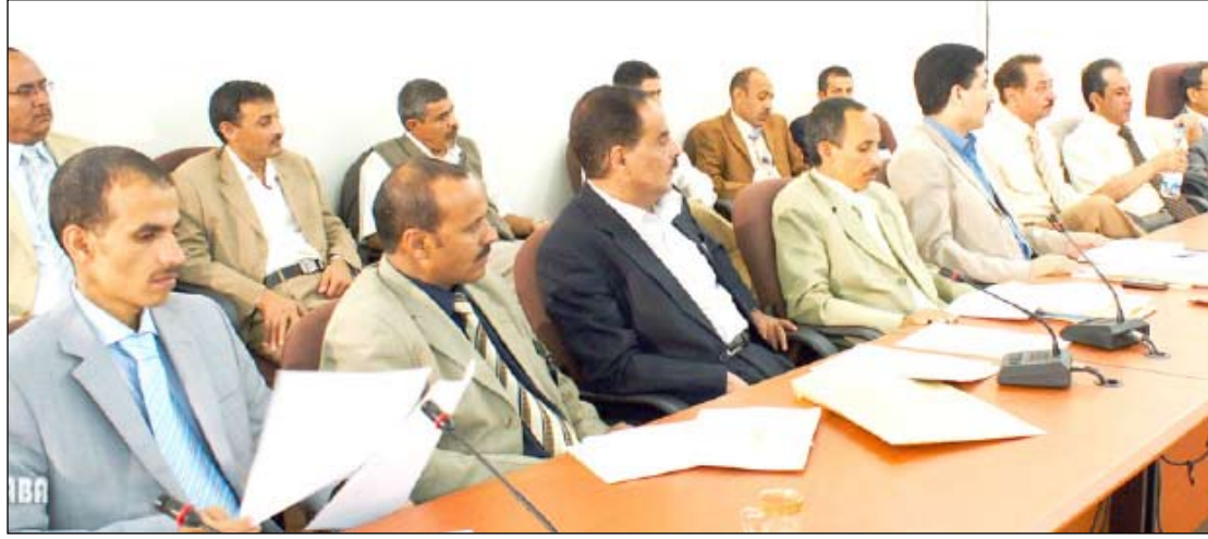
جانب من الحضور في الاجتماع