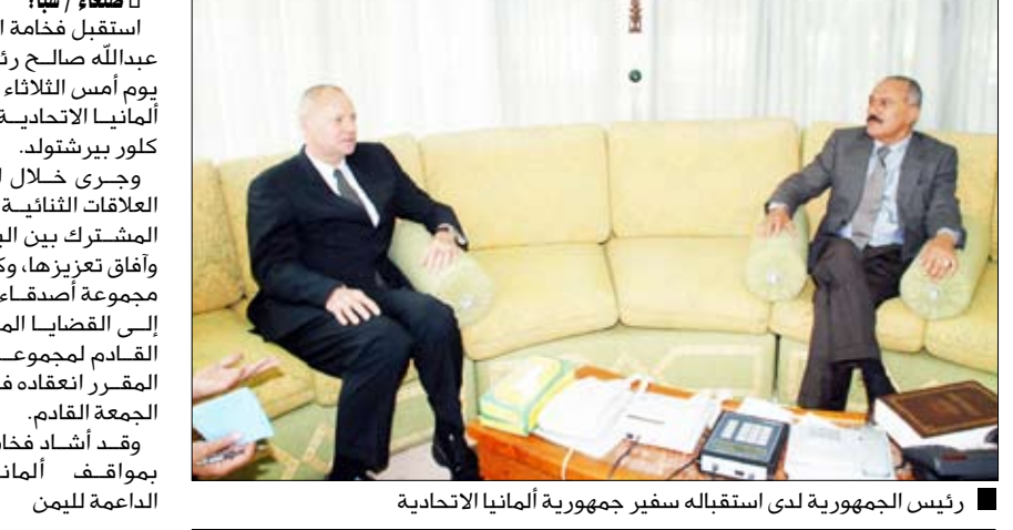
رئيس الجمهورية لدى استقباله سفير جمهورية ألمانيا الاتحادية

استقبل فضامة الأخ الرئيس علي عبدالله صالح رئيس الجمهورية يوم أمس الثلاثاء سفير جمهورية ألمانيا الاتحادية بصنعاء مايكل كلور بير شتولد. وجرى خلال اللقاء مناقشة العلاقات الثنائية ومجالات التعاون المشترك بين البلدين الصديقين وأفاق تعزيزها، وكذا دور ألمانيا في مجموعة أصقاء اليمن، بالإضافة إلى القضايا المتصلة بالاجتماع القادم لمجموعة أصقاء اليمن المقرر انعقاده في نيويورك يوم الجمعة القادم. وقد أشاد فضامة الأخ الرئيس بمواقف ألمانيا الداعمة لليمن