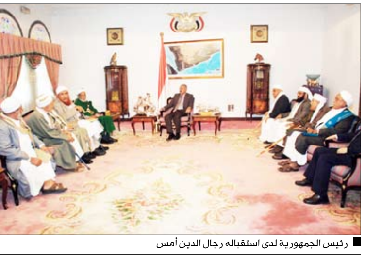
رئيس الجمهورية لدى استقباله رجال الدين أمس

أكد فضامة الأخ الرئيس علي عبدالله صالح رئيس الجمهورية أهمية الاحتكام إلى شرع الله في معالجة القضايا وأن رجال الدين هم المرجعية التي يتم الاحتكام إليها عند الاختلاف والتنازع بين القوى السياسية في ما فيه الصالح العام.. مشيراً إلى الجهود التي تبذل من أجل تحقيق الوفاق والاتفاق بين الجميع ومعالجة القضايا بالحوار والتفاهم وبما يخدم مصلحة الوطن.. مشيراً إلى ما تعانيه بلادنا من أولئك المتطرفين في تنظيم القاعدة وما يقومون به من أعمال إجرامية في حق الوطن، ومنها قتل النفس الحرة.. مشيراً إلى أن هذه العناصر الضالة تجعل حقائق الدين الحنيف وتخالل في كل ما تقوم به الشريعة الإسلامية السمحاء وتشوه صورة الإسلام والمسلمين. جاء ذلك خلال استقبال فضامة أمس الثلاثاء لجنة رجال الدين التي تم تشكيلها أواخر شهر رمضان المبارك كمرجعية للقضايا الوطنية ومنها الحوار، حيث لفت فضامة إلى أهمية الدور المناط باللجنة في مواجهة مثل هذه الأفكار المتطرفة والمشوشة، وقول كلمة الحق وأن يكونوا مع كل ما فيه خير وصالح للحاكم والمحكوم. وفي اللقاء اطلعت اللجنة فضامة الأخ الرئيس على خطة عملها المستقبلية ومنها التواصل مع الأطراف المعنية والاستعانة بدعوى الاختصاص، بما يحقق الأهداف المرجوة من إنشاء اللجنة.