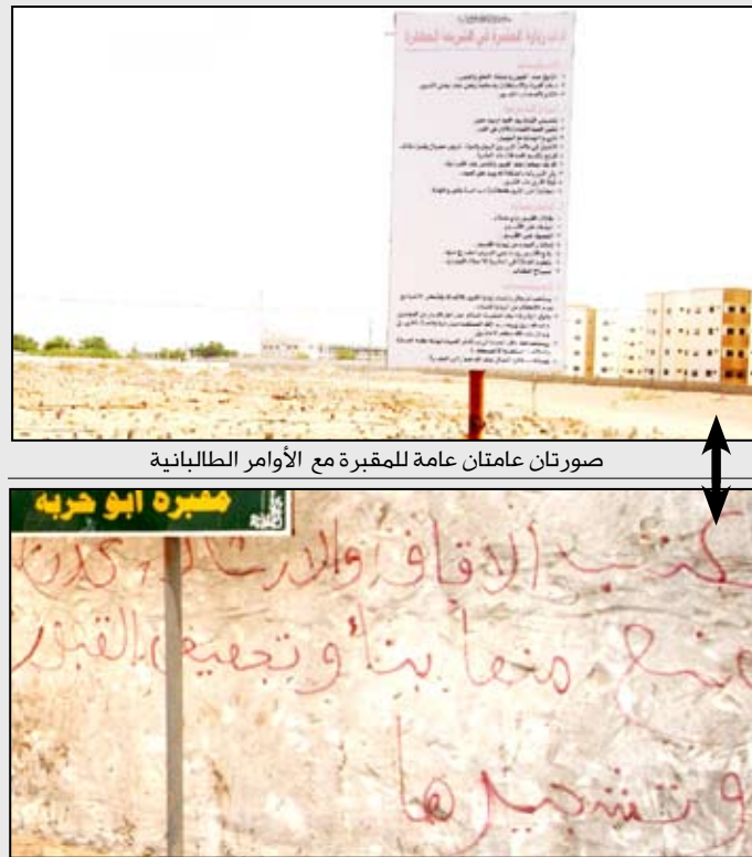
صورتان عامتان للمقبرة مع الأوامر الطالبانية

متسع فيها لاستقبال الموتى، يدفع المواطنين للتوجه إلى مقبرة (أبو حربة) وهي مقبرة كبيرة لكن إدارة مكتب الأوقاف وضعت لوحة كبيرة على بوابة المقبرة تمنع بموجها بناء القبور أو تخصيصها أو كتابة اسم الميت وتاريخ وفاته على قبره. كما تمنع إدارة المقبرة الأهالي من زيارة قبور الموتى بالتنسيق مع الجماعة الطالبانية التي تشرف عمليا على المقبرة وتفرض عليها مذهبها الذي لا يؤمن به أهالي مدينة عدن بل وكل المدن اليمنية. وأوضح المواطنون أن الطقوس الطالبانية الغربية التي يتم فرضها بالقوة على مقبرة (أبو حربة) لا توجد في مقابر العاصمة صنعاء وكافة المدن اليمنية شمالا وجنوبا وشرقا وغربا باستثناء محافظة عدن، وهو ما يشكل عدوانا على حريات المواطنين وتقليديهم التي توارثوها عن آبائهم وأجدادهم، حيث لم تعرف مدينة عدن هذه الطقوس التي يتم فرضها بهدف طلبة المجتمع إلا خلال السنوات الأربع الأخيرة. كما شرح المواطنون وقائع مأساوية لعدد كبير من العائلات التي رفضت إمارة مقبرة (أبو حربة) دفن موتاهم فيها إلا إذا حصلوا على موافقة من أمير إحدى الجماعات الطالبانية التي يتعامل معها