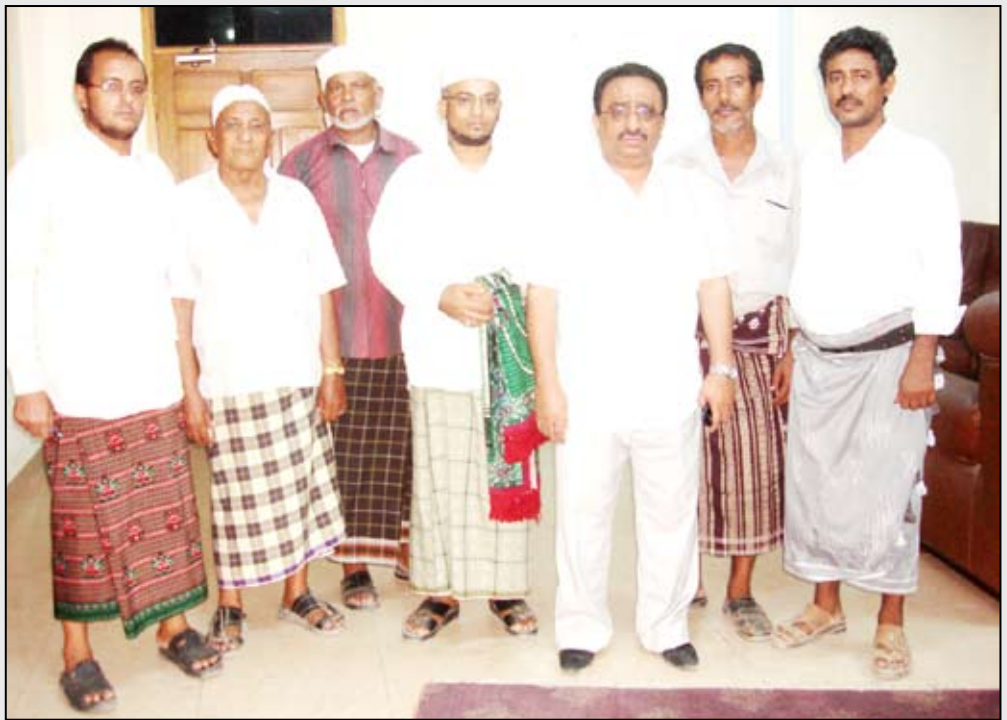
رئيس التحرير مع وفد أعيان المنصورة والقاهرة

متسع فيها لاستقبال الموتى، يدفع المواطنين للتوجه إلى مقبرة (أبو حربة) وهي مقبرة كبيرة لكن إدارة مكتب الأوقاف وضعت لوحة كبيرة على بوابة المقبرة تمنع بموجها بناء القبور أو تخصيصها أو كتابة اسم الميت وتاريخ وفاته على قبره. كما تمنع إدارة المقبرة الأهالي من زيارة قبور الموتى بالتنسيق مع الجماعة الطالبانية التي تشرف عمليا على المقبرة وتفرض عليها مذهبها الذي لا يؤمن به أهالي مدينة عدن بل وكل المدن اليمنية. وأوضح المواطنون أن الطقوس الطالبانية الغربية التي يتم فرضها بالقوة على مقبرة (أبو حربة) لا توجد في مقابر العاصمة صنعاء وكافة المدن اليمنية شمالا وجنوبا وشرقا وغربا باستثناء محافظة عدن، وهو ما يشكل عدوانا على حريات المواطنين وتقليديهم التي توارثوها عن آبائهم وأجدادهم، حيث لم تعرف مدينة عدن هذه الطقوس التي يتم فرضها بهدف طلبة المجتمع إلا خلال السنوات الأربع الأخيرة. كما شرح المواطنون وقائع مأساوية لعدد كبير من العائلات التي رفضت إمارة مقبرة (أبو حربة) دفن موتاهم فيها إلا إذا حصلوا على موافقة من أمير إحدى الجماعات الطالبانية التي يتعامل معها