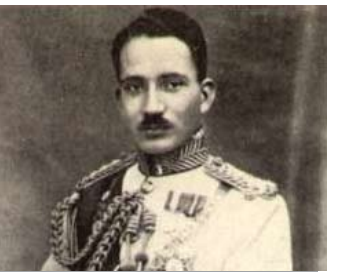
تنويع غازي الاول ملكا على العراق.