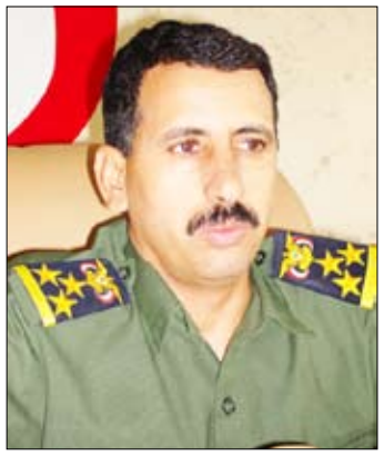
عبدالله عبده قيران

إحسان / عبادوس نورجي: أكد العميد ركن عبدالله عبده قيران مدير أمن محافظة عدن أن رجال الأمن تمكنوا خلال عطلة عيد الفطر المبارك من توفير الخدمات الأمنية وعلى مدار الساعة - لزائري محافظة عدن والذين قدموا إليها براً وجواً وبحراً لزيارة أهاليهم وأصدقائهم والاستمتاع بجمال الشواطئ والمعالم الحضارية والجالية في المحافظة. وأشار في تصريح لـ (14 أكتوبر) إلى أن زائري المحافظة خلال أيام العطلة "السنة" قد عايشوا أجواءً أمنية، مستقرة، وأن الأجهزة الأمنية تستجيب لسوي مطالب بعض الحوادث المؤسفة لهواة السياحة ممن لم يدعوا للإرشادات الأمنية المكثفة في السواحل وفي الصحف وغيرها من وسائل الإعلام، التي تحذر من المخاطر الموسمية للبحر خلال الأشهر (يونيو - سبتمبر)، حيث سجلت الأجهزة