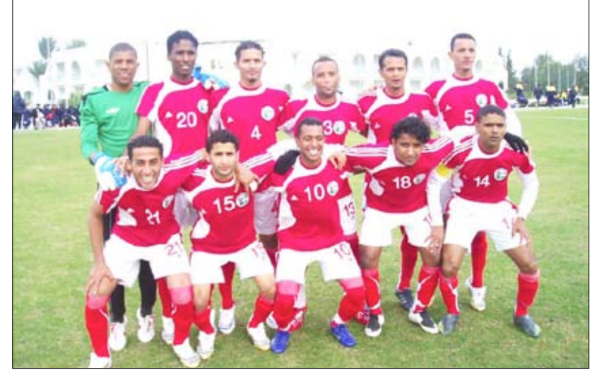
المنتخب الوطني الاول