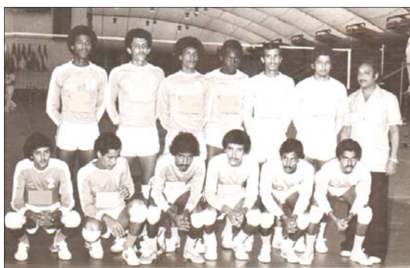
المنتخب الوطني لكرة الطائرة في الزمن الجميل للعبة