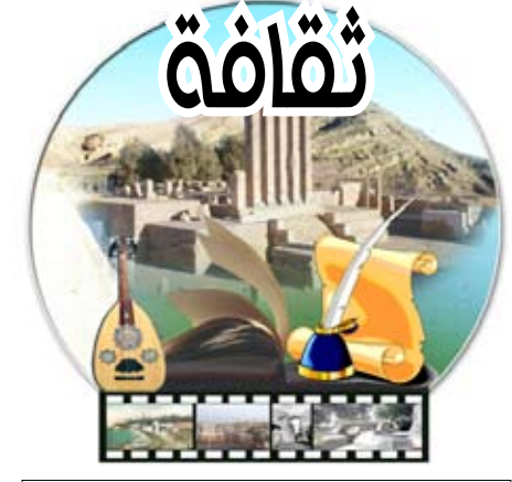
إشراف / فاطمة رشاد