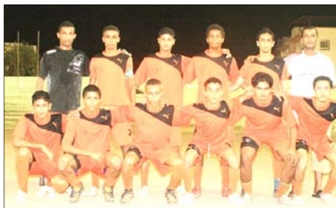
شمسان بطل دوري عباس غلام