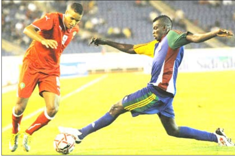
من التصفيات الإفريقية

من منافسات المجموعة الثانية، وسجل أوبافيمي مارتنز (20) ومايكل اينيرامو (1+45) هدفي نيجيريا التي يشرف عليها حاليا سامسون سياسيا بدلا من السويدي لارس لاغرياك الذي رفض مواصلة مشواره بعد مونديال جنوب أفريقيا 2010. وفي المجموعة ذاتها حققت غينيا فوزا كبيرا على مضيفتها إثيوبيا 4-1، فتصدرت بفارق الأهداف عن نيجيريا.