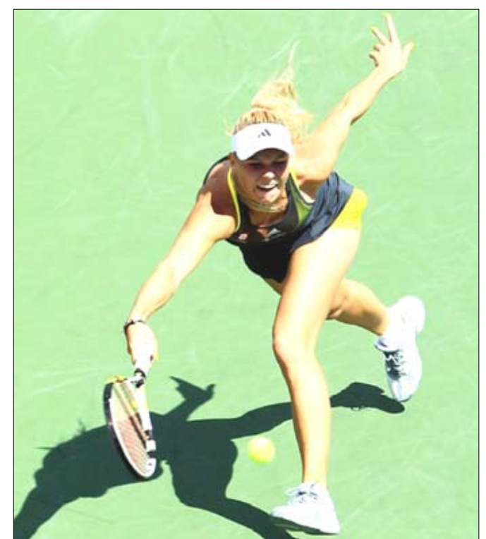
الدنماركية كارولين فوزنياكي

يانكوفيتش تودع من الدور الثالث وودعت الصربية يلينا يانكوفيتش المصنفة رابعة البطولة إثر خسارتها أمام الإستونية كايا كاتيبى الحادية والثلاثين 2 - 6 و 6 - 7