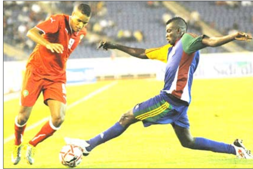
من التصفيات الإفريقية

من منافسات المجموعة الثانية. وسجل أوبافيمي مارتنز (20) ومايكل اينبرامو (1+45) هدفي نيجيريا التي يشرف عليها حاليا سامسون سياسيا بدلا من السويدي لارس لاغريك الذي رفض مواصلة مشواره بعد مونديال جنوب أفريقيا 2010. وفي المجموعة ذاتها حققت غينيا فوزا كبيرا على مضيفتها إثيوبيا 1-4، فتصدرت بفارق الأهداف عن نيجيريا.