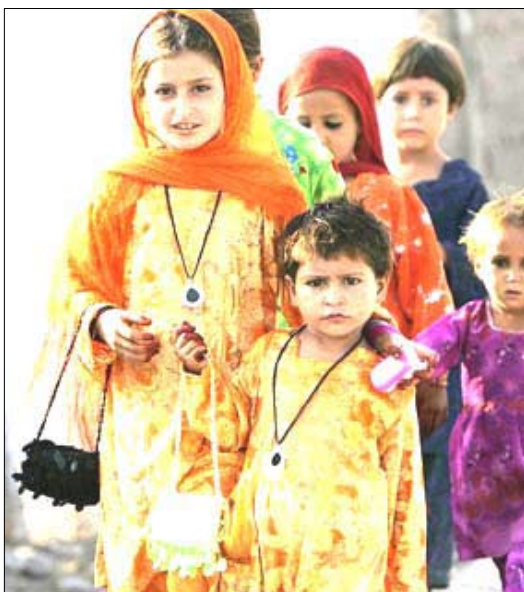
الأطفال تزيينهم الإبتسامة والملابس الجديدة

الشاغل للأبناء الصغار ولأولياء الأمور من خلال النزول إلى محلات الملابس المترامية الأطراف ليشتروا ما يناسبهم وأطفالهم من ملابس وأشياء أخرى لاستقبال هذه المناسبة السعيدة. وفي موضوعنا هذا خصنا في تجارب الأسر وأطفالهم لاستقبال هذه المناسبة .