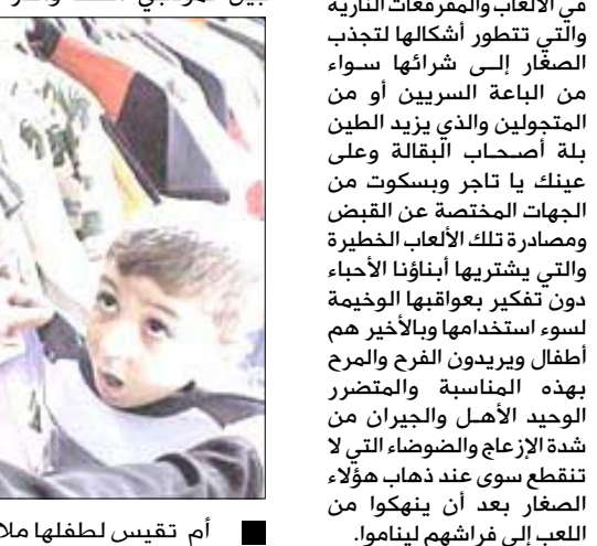
أم تقيس لطفها ملابس العيد

الرعاية والإرشاد الأسري: عزائي أولياء الأمور ولكن في الكرم أن مكوث أبنائكم الصغار في الشارع حتى أنصاف الليالي أمر خطير يجب فيه استخدام الشدة والحزم فأوقات الفطر تختلف عن الخروج وساعات اللعب أثناء شهر رمضان . حاولوا أن تنظموهم جدولاً للمذاكرة واللعب والنوم والجمع يعلم أن المدارس تشترط على فتح أبوابها لأبنائنا الطلاب ومعا يدا بيد نستعد لاستقبال عام جديد مليء بكل ما هو مهم وجديد ومقدماً عيد سعيد وكل عام وجميع أصدقائنا الأطفال بألف صحة وعافية.