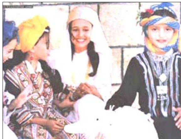
الفرحة في عيون الأطفال