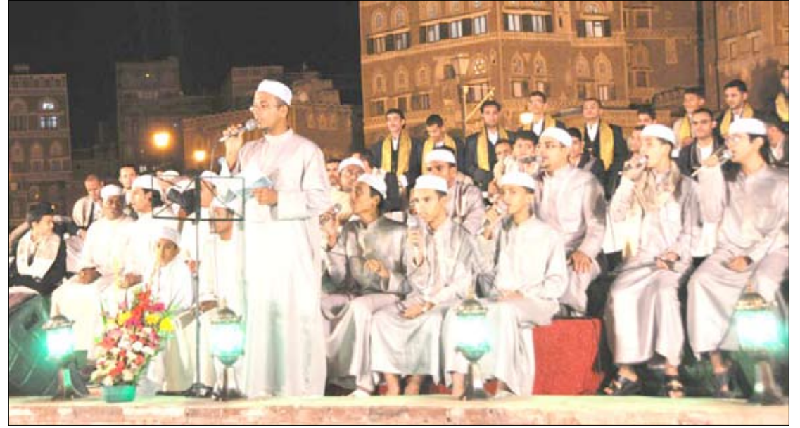
فرقة إنشادية (أرشيف)

من مصر وسوريا والسعودية، ويقدمون ما يزيد على 80 عملاً إنشادياً إبداعياً جديداً من الوان التراث الإنشادي الأصيل. ونوه بما حققه المهرجان على مدى دوراته السابقة، في توثيق التراث الإنشادي والموشح اليمني، وحفظ وتقديم التراث من الأعمال الإنشادية، والإبداعية بمختلف الألوان والمشارب الإنشادية من مختلف المناطق اليمنية، من موشحات دينية ومدائح نبوية، وتسابيح وتهليل، وتعظيم لله عزوجل، علاوة على دور الجمعية ومن خلال وزارة الثقافة في إبراز النشيد اليمني والتعريف به على مستوى العالم، من خلال المشاركات الإنشادية والإبداعية المحلية والخارجية. بعد ذلك استهلكت أولى الأمسيات الإنشادية ضمن برنامج المهرجان، والذي حضره عدد من المسؤولين والسفراء وأعضاء السلك الدبلوماسي بصنعا، بتقديم باقات متنوعة من التراث الإنشادي شارك فيها كل من المنشد السعودي حسن الحامد، والمنشد المصري أحمد أبو شهاب، وفرقة الإتحاد العربي للثقافة والإبداع السوري، بالإضافة إلى فرقة "حبيب الله" اليمنية، وفرقة المسرة بترميم، وفرقة النخبة الإنشادية وفرقة نسائم طيبة وفرقة محافظة حجة.