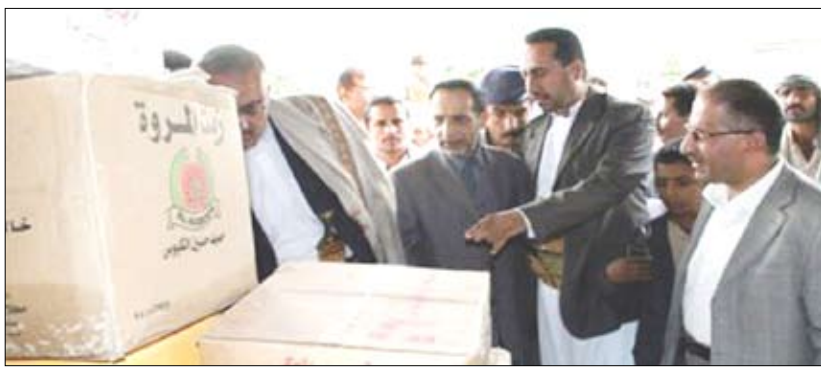
وزير الصناعة خلال زيارته الميدانية إلى سوق العاصمة

أمام العملات الأجنبية الأخرى. وأكد وزير الصناعة والتجارة أن الوزارة لن تتوانى في حالة عدم الاستجابة عن اتخاذ الإجراءات القانونية الصارمة وفقاً للتشريعات والقوانين الناظمة. وطلب المستهلكين بمساندة جهود الوزارة في الرقابة على الأسواق من خلال اضطلاعهم بدورهم في الإبلاغ عن أية مخالفات تموينية أو سعيرية بالاتصال على الرقم المجاني 174 غرفة العمليات المركزية بالوزارة. وخلال الزيارة الميدانية لمحللات بيع المواد الغذائية أكد عدد من تجار الجملة والتجزئة المواد الغذائية والتمور لوزير الصناعة والتجارة أن الأسعار شهدت تراجعاً ملحوظاً في عدد من السلع بعد استقرار أسعار الصرف وتحسن سعر الريال أمام الدولار والعملات الأجنبية الأخرى... لافتين إلى التزامهم بإشهار الأسعار والتعليقات الصادرة عن الوزارة والسلطة المحلية.