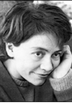
الأرجنتينية الكسندرا بيزارنيك