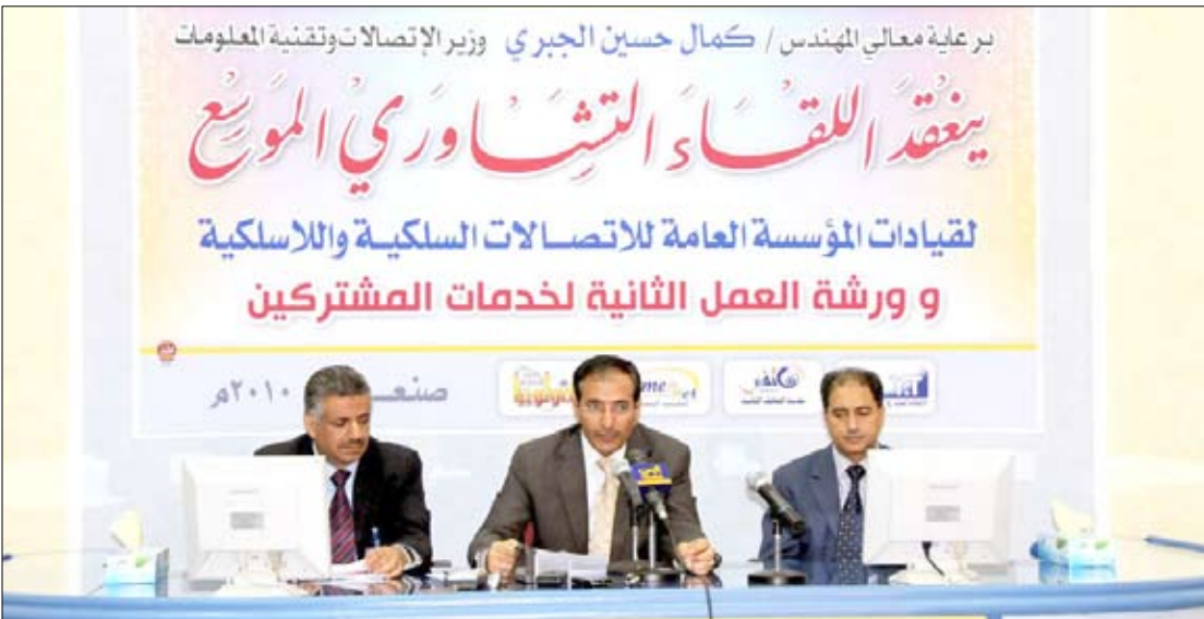
خلال اللقاء التشاوري الموسم لقيادات المؤسسة العامة للاتصالات