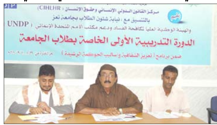
من أعمال الدورة

وكرامة الإنسانية، مشيراً إلى أن برنامج فخامة الأخ الرئيس علي عبدالله صالح رئيس الجمهورية وبرنامج الحكومة يعطيان مساحة كبيرة لمنظمات المجتمع المدني للمشاركة الجادة في التنمية الشاملة وعلى أسس حقيقية.