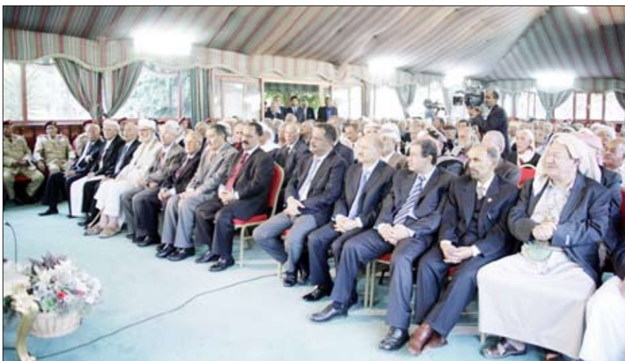
رئيس الجمهورية يلقي كلمته لدى استقباله رموز مناضلي الثورة اليمنية سبتمبر وأكتوبر وأبطال ملحمة السبعين يوماً أمس

أكد فخامة الرئيس عبد الله صالح رئيس الجمهورية أن " كل ما تحقق تنموياً واجتماعياً وثقافياً وديمقراطياً هو بفضل الدماء الزكية والغالية التي قدمها شعبنا اليمني العظيم، ومهما جاءت أحداث وتطورات وحيدت مؤامرات من أعداء الوطن بقصد إزكاء الصراعات فلا خوف على منجزات ومكاسب ثورة سبتمبر وأكتوبر على الإطلاق ولا خوف على وحدة اليمن ". وقال فخامته لدى استقباله أمس بدار الرئاسة رموزاً من مناضلي الثورة اليمنية سبتمبر وأكتوبر وأبطال ملحمة السبعين يوماً : " ما يشهده الوطن من تطورات كبيرة على مختلف الأصعدة تنموياً وثقافياً وسياسياً واجتماعياً وديمقراطياً هو بفضل تلك التضحيات الغالية التي قدمت من أجل انتصار الثورة . وتابع قائلاً " الحق في الحكم هو بيد الشعب وعبر صندوق الاقتراع ومن أراد أن يصل إلى كرسي الحكم أو السلطة فعليه أن يتجه - دون إحداث أزمات أو صراعات- نحو صندوق الاقتراع في إطار العمل المؤسسي، فمؤسسات الدولة قائمة علينا ان نحترم المؤسسات ابتداء من الدستور ونهاية بكل الأنظمة والقوانين السارية، والتعصب العشائري والقبلي لا يمكن أن يكون فوق الدستور ". وقال " إن أي خروج أو تلاعب ما هو إلا خداع للنفس، وستظل المؤسسات مرجعيتنا .. لا وثيقة عهد واتفاق ولا اتفاقيات خارج المؤسسات الدستورية، فأى اتفاق خارج المؤسسات الدستورية أو يحدث تصدعا في المؤسسات الدستورية مرفوض جملة وتفصيلاً".