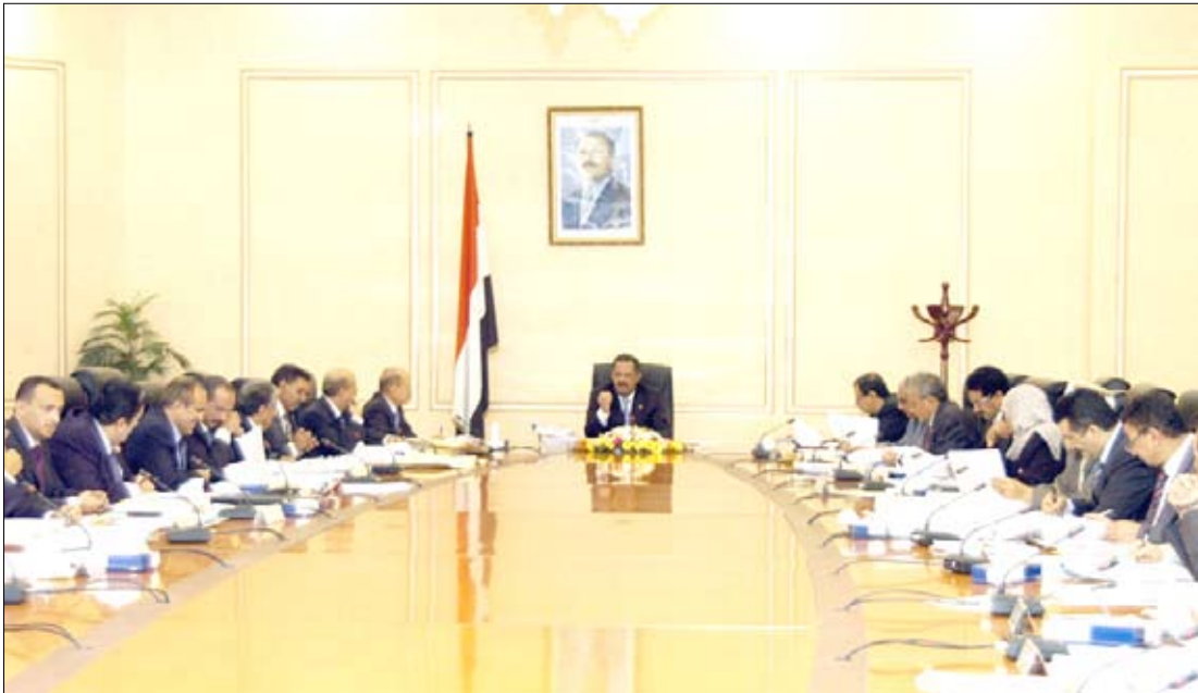
د. مجور يترأس اجتماع مجلس الوزراء أمس