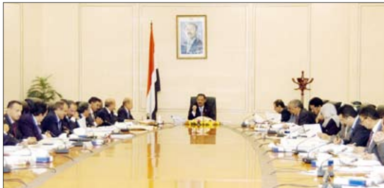
د. مجور يترأس اجتماع مجلس الوزراء أمس

المحلية البالغ 23 مليارات و363 مليوناً و985 ألف ريال . واطلع المجلس على التقرير الأسبوعي لوزارة الخدمة المدنية والتأمينات عن نتائج التفقيش ومؤشرات الرقابة على حالة الانضباط الوظيفي خلال الفترة من 14 - 20 رمضان الحالي الموافق 24 - 30 أغسطس 2010م.