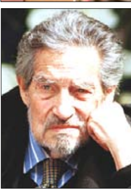
أوكتا فيو باث