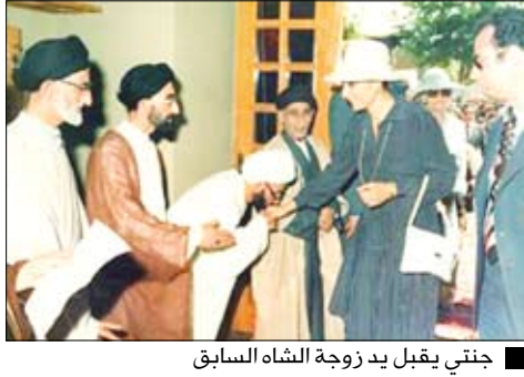
جنتي يقبل يد زوجة الشاه السابق

■ منعاه / متابعة: سخر مصدر مسؤول من الأنباء التي تحدثت عن قواعد عسكرية في الأراضي اليمنية وانتقال قوات أمريكية من العراق إلى اليمن . وقال المصدر إننا نستغرب نشر