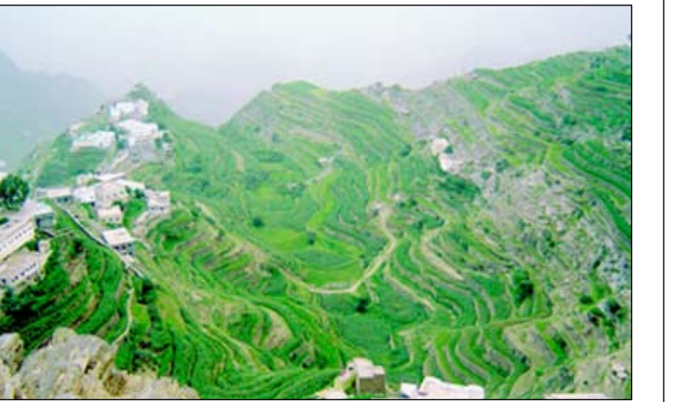
□ برامج إرشادية لتحسين الزراعة والانتاج