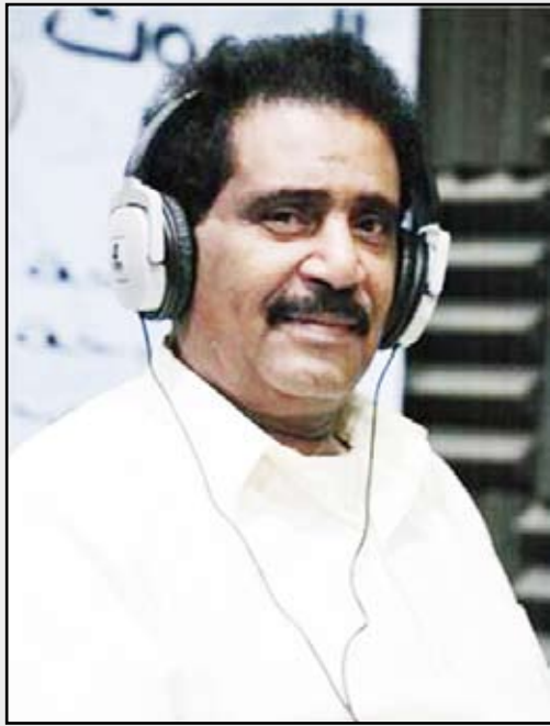
الفنان الراحل فيصل علوي

وبيين (حمدون) في قصائده خلاصة لوعته وحرمانه وعشقه السامي ومعاناته الدائمة ولم يهنا بلدة اللقاء ولم يطعم لذة الوصال وهو ليس نهما على (اللذة) بل عفيف ويكفيه من محبوبته أن تشاطره عواطفه الجياشة وأحاسيسه الرقيقة ويكفيه أيضاً أن تجلس قبائله ليرى ما أبدع الله من خلق وحياها إياها.