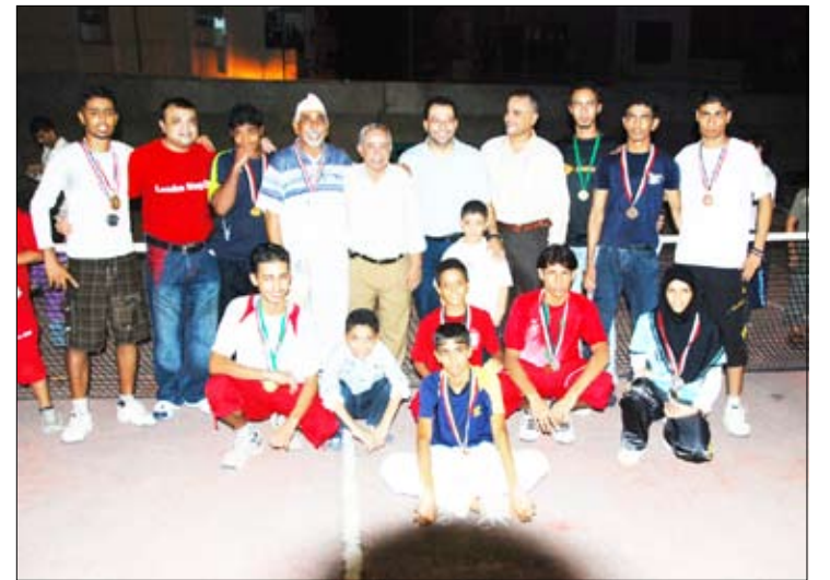
من فعاليات تكريم الأبطال