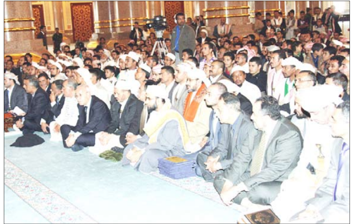
جانب من المشاركين في الحفل

الحفاظ على أمن الوطن مسؤولية تقع على عاتق أبناء الوطن وليس الأجهزة الأمنية فحسب