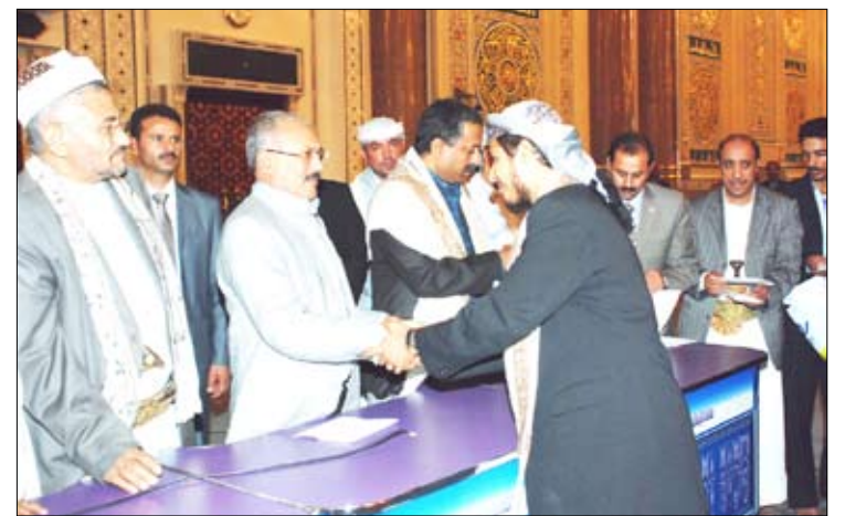
خلال توزيع الشهادات التقديرية للخطباء المشاركين في الدورة