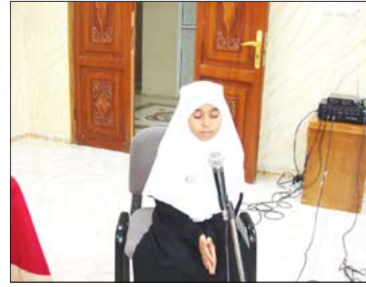
□ من فعاليات مسابقة القرآن الكريم

كما أشارت إلى أن لجنة التحكيم مكونة من معلمتين إحداهما من الدار والأخرى من المركز، أما الجوائز