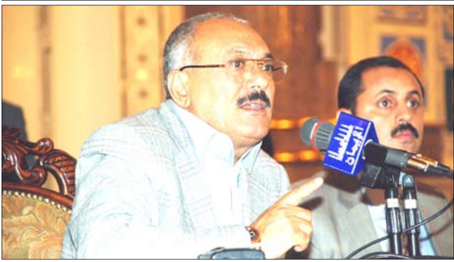
رئيس الجمهورية يلقي كلمته في حفل تكريم الفائزين بمسابقة القرآن الكريم