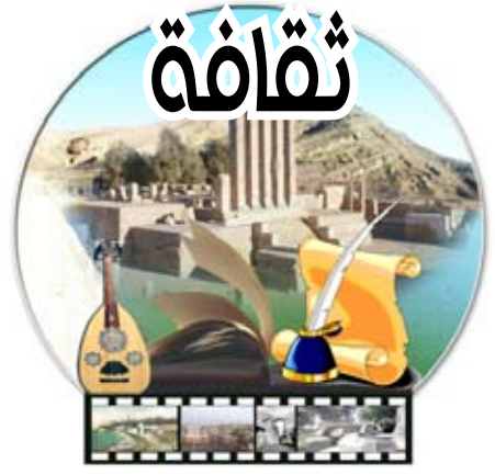
إشراف / فاطمة رشاد