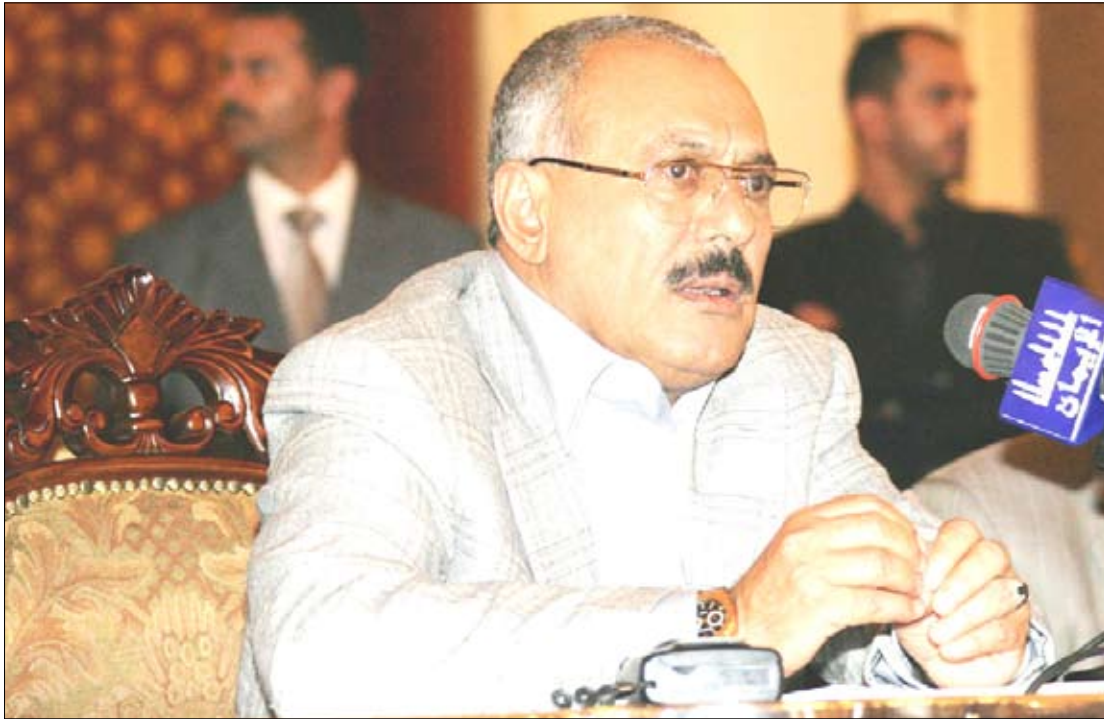
رئيس الجمهورية يلقي كلمة في الحفل