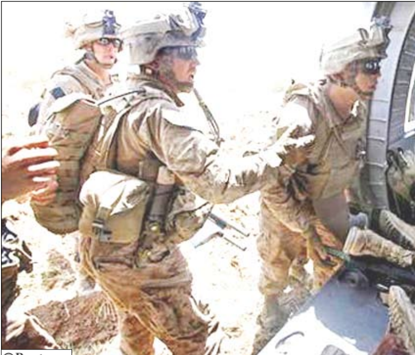
جنود أمريكيون يضعون زميلين لهم في طائرة هليكوبتر طبية بعد إصابتها في انفجار قرب بلدة مرجة بالقرب من جنوب أفغانستان

ووقعت هجمات عديدة مماثلة على قواعد عسكرية اجنبية وعلى مبان للقوات الحكومية في الشرق العام الماضي. وذكرت قوة المعاونة الامنية في بيان في وقت لاحق أمس السبت ان نحو 15 متمردا قتلوا في سالبرنو كما قتل ستة في تشابامان. وقتل في متمردين تمكنا من اختراق محيط قاعدة سالبرنو لكنها قتل على الفور.