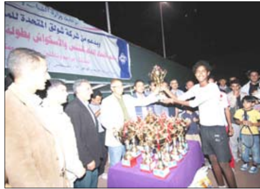
خلال تسليم الكؤوس للفائزين