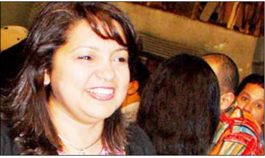
المخرجة المصرية شيرين عادل

وأضافت: غير أن المتابعين تفاجؤوا بوجود قصة مختلفة، ونحن من الحلقة التاسعة دخلنا في أحداث جديدة بعيدة عن مجرى الفيلم، وأنا أرفض أن أقوم بإعادة تصوير أي عمل سينمائي تلفزيوني لأنني عندما لن أقدم جديداً.