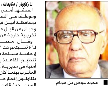
محمد عوض بن همام

■ منعاه / سيا: ناقش محافظ البنك المركزي اليمني محمد عوض بن همام أمس مع مدراء عموم البنوك التجارية التطورات في القطاع المصرفي اليمني. وفي اللقاء دعا بن همام البنوك إلى تحسين أوضاعها وزيادة رؤوس أموالها من خلال عمليات الاندماج أو توسيع قاعدة المشاركة خاصة المشاركات الخارجية في رأس المال بما يسمح للبنوك برعاية مشاريع استثمارية كبيرة تعمل على حفز النمو الاقتصادي. وطرق إلى الإجراءات الأخيرة التي اتخذها البنك والتي قادت إلى استقرار سوق الصرف الأجنبي.. منوها بالدور المهم الذي لعبته البنوك في هذا الجانب. وأكد أن البنك لن يسمح لأي شخص أو مؤسسة بالقيام بعمليات المضاربة في سوق الصرف.. لافتاً إلى أن البنك المركزي قام باتخاذ إجراءات عقابية بحق عدد من الصرافيين الذين يقدمون على عمليات المضاربة أو يشجعونها.