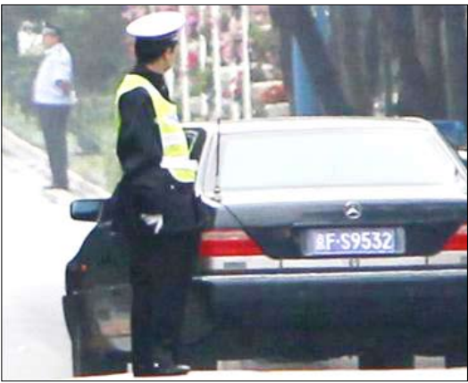
سيارة مصفحة يتوقع أنها تقل الزعيم الكوري الشمالي كيم جونج ايل وابنه تغادر فندقا في الصين أمس السبت.

حكومتنا ستتنازل من اجل نزع السلاح النووي في شبه الجزيرة واقامة سلام دائم كبادرة عملية توحيد الكوريتين. وقالت واشنطن وسول ان على بيونجيانج ان تتخلى عن تطويرها لاسلحة نووية ولكنهما لم تهددا بمهاجمة كوريا الشمالية الفقيرة والمعزولة. وذكرت وكالة الانباء الكورية الشمالية الرسمية أن كيم يونج نام الرجل الثاني في القيادة الكورية الشمالية قال للرئيس الأمريكي السابق الزائر جيمي كارتر ان بلاده تريد استئناف محادثات نزع السلاح النووي السادسة. ويبدو ان الزعيم الكوري الشمالي كيم جونج ايل يزور الصين في رحلة تكتفها السرية يقول محللون انها تهدف على ما يبدو الى الحصول على دعم الصين لخطته لتوريث الحكم لابنه.