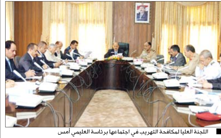
اللجنة العليا لمكافحة التهريب في اجتماعها برئاسة العلمي أمس

■ منعاه / سيا: أقرت اللجنة العليا لمكافحة التهريب تقرير اللجنة الفنية المكلفة بدراسة خطة العمل المقدمة من مصلحة الجمارك، وكذا ورقة العمل المقدمة من مصلحة خفر السواحل ومقترحات الجهات الممثلة في اللجنة الفنية، كإطار عام لتكوين إستراتيجية لمكافحة التهريب. جاء ذلك بعد استعراض ومناقشة اللجنة في اجتماعها أمس برئاسة نائب رئيس الوزراء لشؤون الدفاع والأمن وزير الإدارة المحلية رئيس اللجنة الدكتور رشاد العلمي للتقرير المقدم من رئيس اللجنة الفنية رئيس مصلحة الجمارك