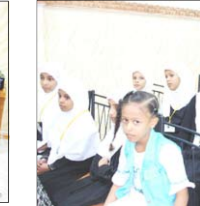
□ من فعاليات مسابقة القرآن الكريم

الجدير بالإشارة أن دار قطر للأيتام تقوم على دعم من محسنيين ومحسنات من دولة قطر الشقيقة ولا تحظى بأي دعم أو رعاية من فاعلي خيريين.