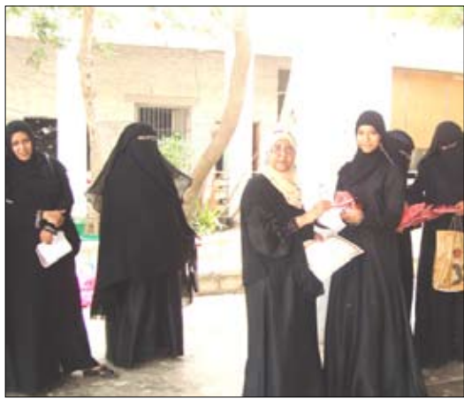
إدارة المخيم الصيفي

كان أفضل شيء حصلت عليه حتى الآن في حياتي، كنت أتمنى أن تكون الفترة أطول. فقد التحقت بدورة الكوافة وتعلمت منها الكثير وهذه أول مرة أشارك في المخيم الصيفي لهذا العام واستعدت كثيرا وتعرفت على صديقات جدد من خلال هذا المخيم وفي رحلتنا الاستطلاعية والترفيهية. أما من حيث المواد فكانت متوفرة مثل المكياج «الاستشوار» وغيرها من مواد التجميل ولا ننسى دور المدرسة التي عملت على تدريبنا أشياء لم نكن نعلمها ولكن بفضلها وبفضل الأستاذة القديرة رئيسة المخيم التي دعمتها ودعمتنا جميعا تعلمنا الكثير.