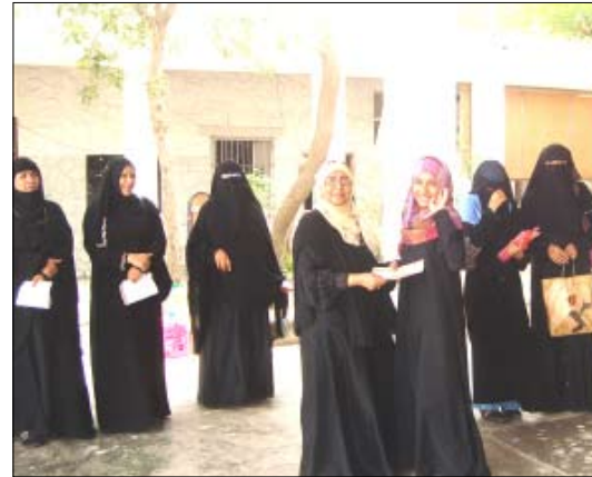
إدارة المخيم الصيفي