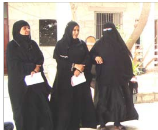
إدارة المخيم الصيفي