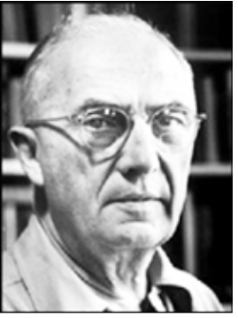
وليام كارلوس ويليامز

آه.. أيتها التفاحة الهائلة جميلة عندما تصبحين تماماً فاسدة، ويصبح بالكاد يملك هيكل مشوه. ربما ابتداءً ذلك بغصن ذوي من أعلاك؛ لكن هذا بالتجديد الجانب الآخر للكمال في كل تفاصيله ممتع.