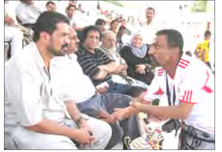
الجفري يؤكد تكريم شمسان والتلال

دعوة رجال الاعمال للمساهمة في تكريم الأبطال المتوقع ان يتم قريباً. وقال محافظ محافظة عدن ان ملحقه ابطال التلال وشمسان في عمان وسوريا هو فخر لابناء محافظة عدن واليمن كلها. "وكم هو عظيم ان نرى علم اليمن يرفرف عاليا في سماء عمان وسوريا بفضل ما قدمه الإبطال هناك وذلك من الطبيعي بل من الواجب علينا ان نقوم بتكريم بعثتي شمسان والتلال في الايام القليلة القادمة و " نجدها فرصة