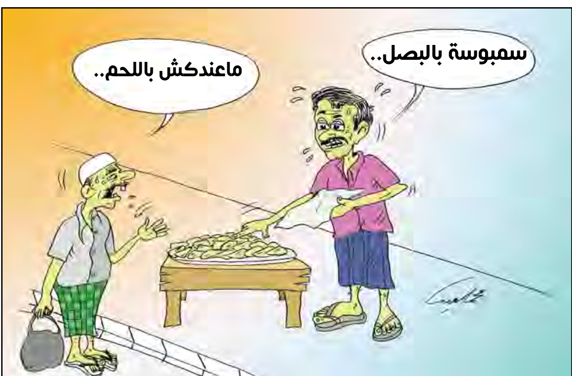
سمبوسة بالبصل... ما عندكش باللحم...