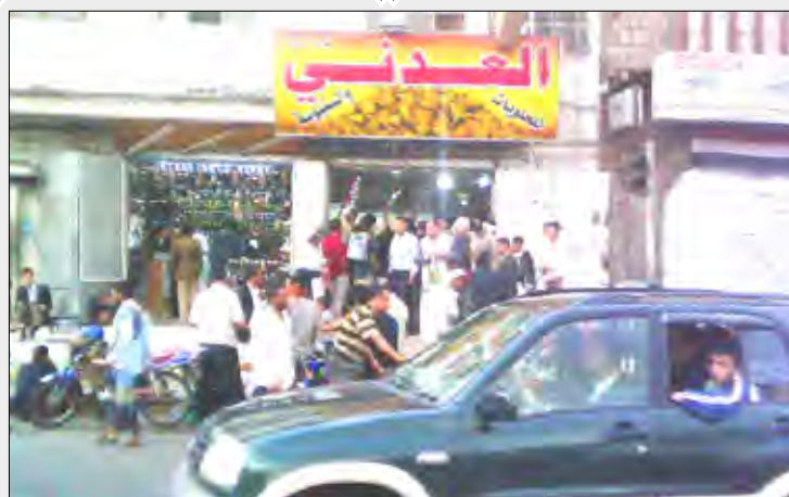
محل سنبوسة العدني في صنعاء

ما أن يفرغ الصائمون من أداء صلاة العصر في كل يوم رمضاني حتى يبدأ الإقبال على قطع السنبوسة ليصل إلى أوجه مع حلول وقت الإفطار.. في العاصمة اليمنية صنعاء تشاهد زحاما كبيرا على محل «عدني» في حي التحرير من قبل الشباب وكبار السن على حد سواء، كل منهم يريد أن يظفر بطلبه من سنبوسة العدني.. في هذا المحل للسنبوسة صورة مغايرة للمحلات الأخرى .. صورة تتسيد فيها الرغبة للحصول على هذه الوجبة الخفيفة.. المشهد نفسه لم يتغير منذ عقود، فالجميع يتدافعون على هذا المحل للحصول على سيدة المائدة الرمضانية ولو كلّفهم الأمر عناء الازدحام وأقنطهم العراك والصراخ ما أبقى عليه نهار طويل من الجوع والعطش، المهم لديهم الفوز بجبات السنبوسة .. مشهد الازدحام على السنبوسة طوال أيام شهر رمضان يؤكد أن تلك الوجبة الخفيفة واللذيذة تحتل مكانها في بيت الأسرة اليمنية مانحة الصائم شعوراً استثنائياً في الشهر الكريم.