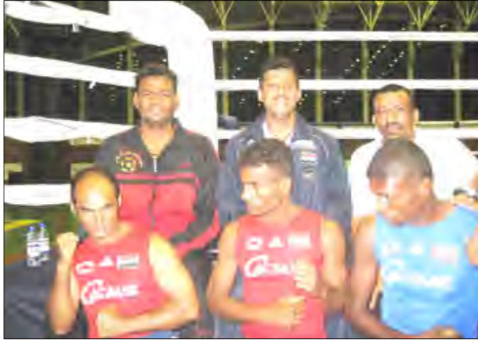
فريق شمسان للملاكمة