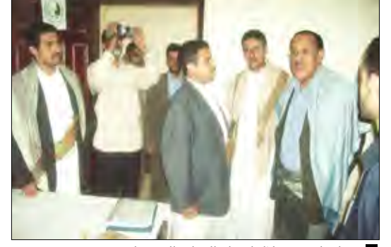
محافظ حجة خلال افتتاح العيادة الرمضانية