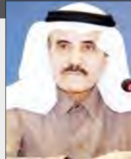
تركي عبدالله السديري

بالشواهد الواضحة قولاً وفعلاً، علينا أن نحمد الله في هذا الشهر الكريم أن شؤوننا ومشروعات مستقبلنا وسيجات حماية وحدتنا ترعاها دولة قوية.. يقودها رجل نادر في تاريخ العرب الحديث..