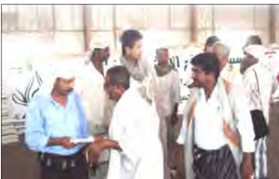
خلال تدشين توزيع المساعدات

أن عملية التوزيع ستتم وفق البرنامج المعد والنظام المبع لدى المؤسسة بتعاون السلطة المحلية بمحافظة والمديرية والجهات المختصة الأخرى.