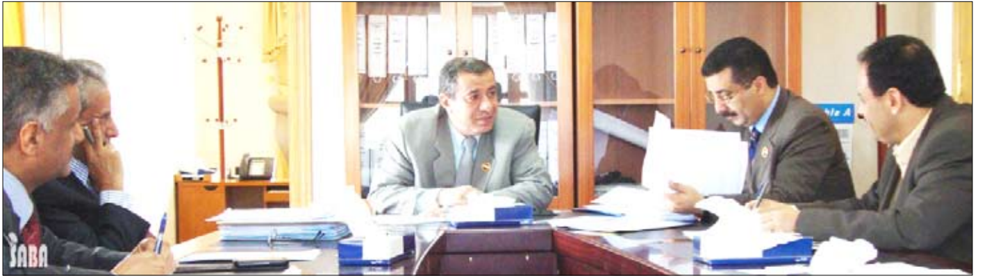
اجتماع اللجنة الوزارية المكلفة بتوزيع معونة القمح الاماراتية