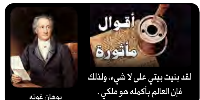
لقد بنيت بيتي على لا شيء، ولذلك فإن العالم بأكمله هو ملكي. يوهان غوته

غسل الأواني قالت فتاة لصديقتها كيف تساعدني أختك في غسل الأواني؟ قالت: أختي تغسلها وأنا أتركها تنشف.