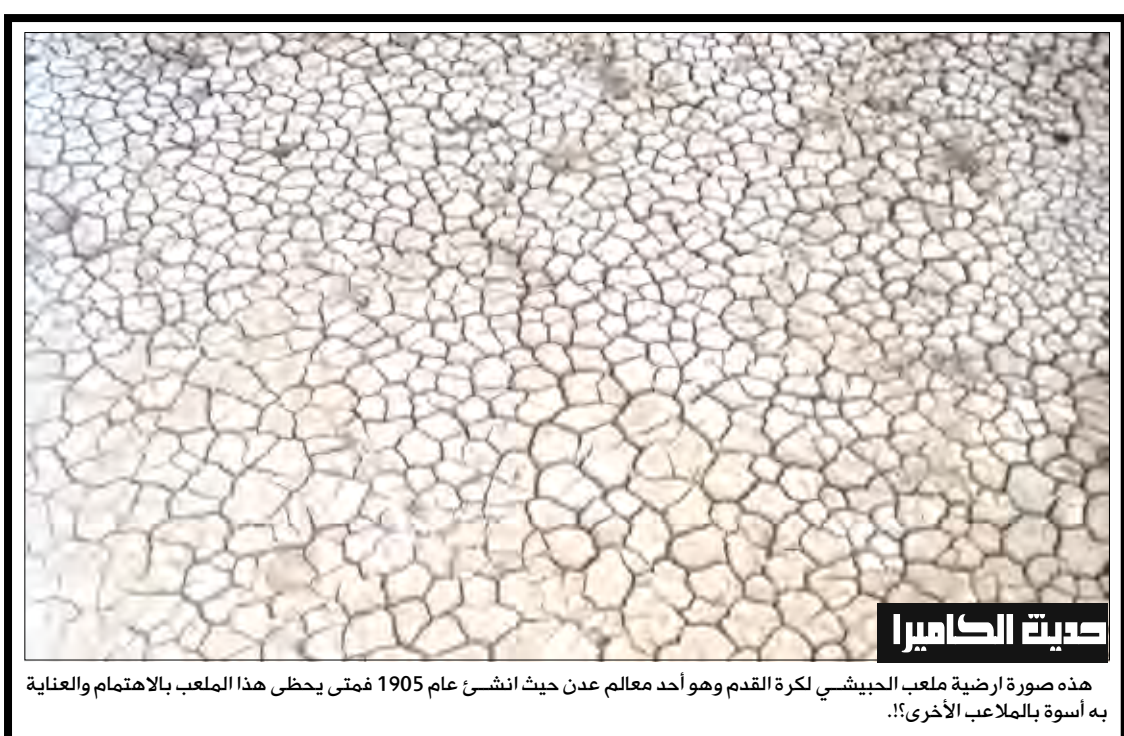
هذه صورة أرضية ملعب الجبشي لكرة القدم وهو أحد معالم عدن حيث انشئ عام 1905 فمتى يحظى هذا الملعب بالاهتمام والعناية به أسوة بالملاعب الأخرى؟

مضيف جوي يقفز من الطائرة بعد مشاجرة مع راكب تشافر مضيف جوي مع أحد الركاب، فما كان منه إلا أن أخذ زجاجة كحول وفتح باب الطائرة وقفز من الطائرة بعد توقف سلايتز لتناول زجاجة جعة توقفها في مطار "جون كينيدي" في نيويورك. وذكرت صحيفة "نيويورك تايمز" أن الشرطة تمكن من القبض على المضيف الجوي ستيفن سلايتز (38 عاماً) بعد أن غادر المطار وتوجه إلى منزله، وقال مصدر في الشرطة إن الحادث وقع حين وقف أحد الركاب لأخذ حقائبه قبل الوقت المحدد، ثم توجه بالسباب لسلايتز الذي رد عليه بالسباب أيضاً عبر جهاز التواصل الداخلي في الطائرة. ثم توقف سلايتز لتناول زجاجة جعة وفتح باب الطائرة وانزلق منه باتجاه مرآب السيارات وقاد سيارته إلى منزله، ووجهت الشرطة للمضيف تهم التعريض للخطر والأذى الجرمي. وقال مصدر في الشرطة إن سلايتز فتح باب الطائرة بسرعة ومن دون تحذير وكان يمكن أن يقتل أي شخص صوف وجوده على الأرض، وقال أشخاص مقربون من سلايتز إنه فقد والده والدة مؤخراً بعدما كان يتعني بهما خلال مرضهما.