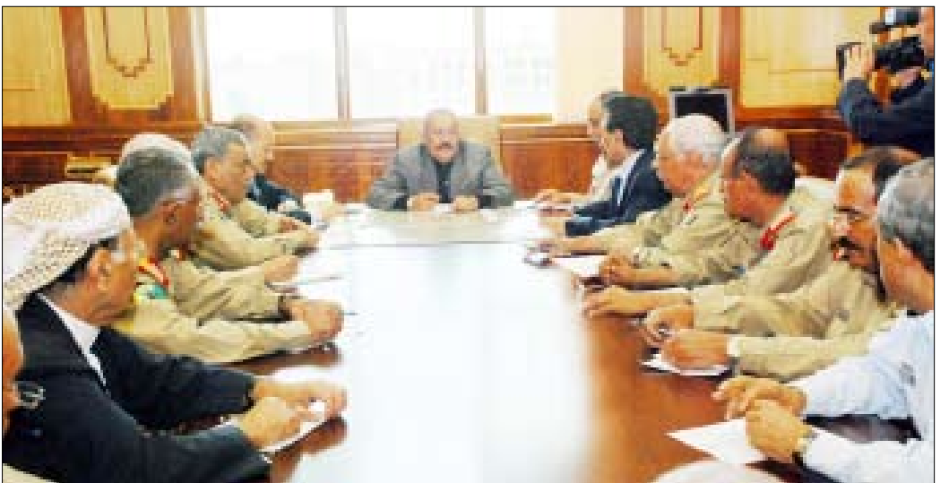
رئيس الجمهورية يترأس اجتماع قيادتي وزارتي الدفاع والداخلية أمس