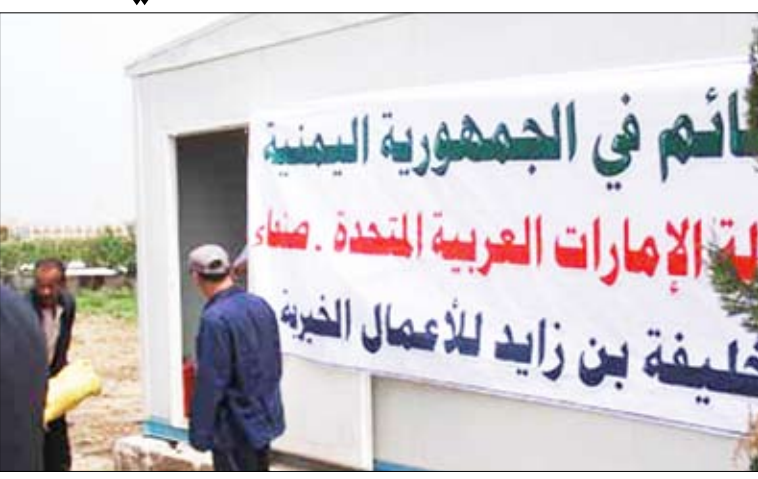
مشروع إفطار الصائم في اليمن

□ صنعاء / متابعات: بدأت مؤسسة الشيخ خليفة بن زايد للأعمال الإنسانية تنفيذ مشروع إفطار الصائم في اليمن بمساعدة وإشراف من قبل سفارة دولة الإمارات العربية المتحدة في صنعاء. ويأتي هذا المشروع الخيري تحقيقاً لرسالة مؤسسة خليفة بن زايد آل نهيان للأعمال الإنسانية في تقديم العون والمساعدة للفئات التي تعاني وطأة الظروف وتوفير بعض احتياجاتها خلال شهر رمضان الكريم. ويتضمن المشروع خمسة أصناف من المواد الغذائية المتنوعة، حيث تم توزيع بعضها مباشرة إلى الأسر المحتاجة والبعض الآخر تم بالتنسيق مع عدد من الجمعيات الخيرية اليمنية لتوزيعها على الأسر الفقيرة والمحتاجة وإيصالها إلى منازلهم في أقاصي محافظات الجمهورية اليمنية.