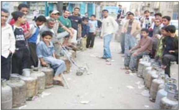
طوابير أمام محلات أسطوانات الغاز