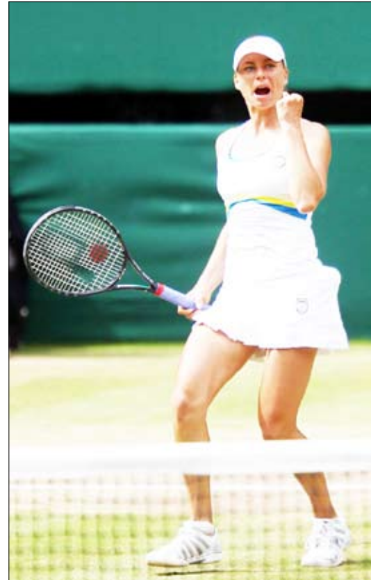
الروسية فيرا زفوناريفا