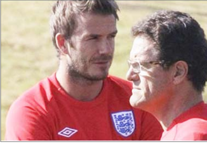
كابيلو و بيكهام