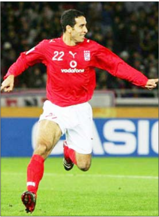
محمد أبو تريكة