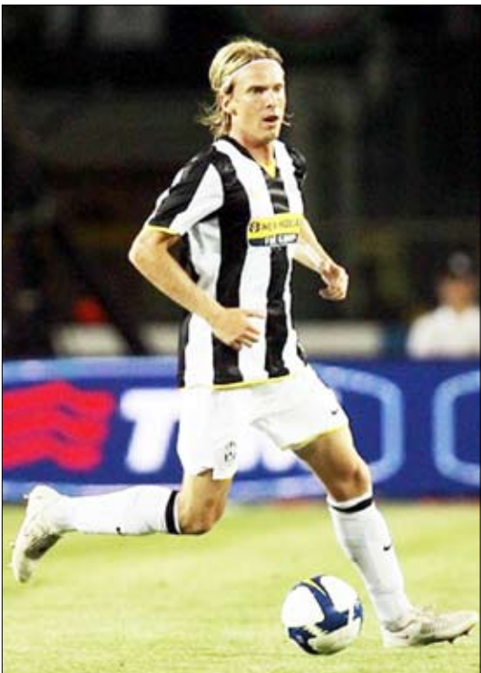
الدنماركي الدولي كريستيان بولسن