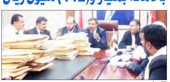
أثناء فتح مظاريف المشاريع التربوية

سبأ / سبأ: جرى أمس بأمانة العاصمة فتح مظاريف ستة مشاريع تربية بكلفة مليار و422 مليون و882 ألف ريال بحضور وزير الدولة أمين العاصمة عبدالرحمن الأكوع، وتضمنت المشاريع التي تم فتح مظاريفها، بناء مجمعين تربيويين بحي شميلة وحي الأصححي بمديرية معين بكلفة 243 مليوناً و920 ألف ريال ومشروع مخزن للكتاب المدرسي بالأمانة