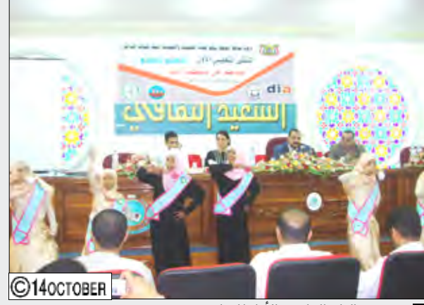
من فعاليات الملتقى الأول للتعليم

تعز / نغانم خالد : عقد أمس في محافظة تعز الملتقى الأول للتعليم للجميع الذي تنظمه اللجنة التعليمية والجمعيات الممثلة للفئات الأشد فقراً بدعم من منظمة ديا الفرنسية الممولة من المفوضية الأوروبية ويهدف الملتقى إلى تنفيذ البنية التحتية مع الإسهامات المختلفة من قبل الشركاء من أجل إلحاق أطفال الأسر الأشد فقراً بالتعليم.