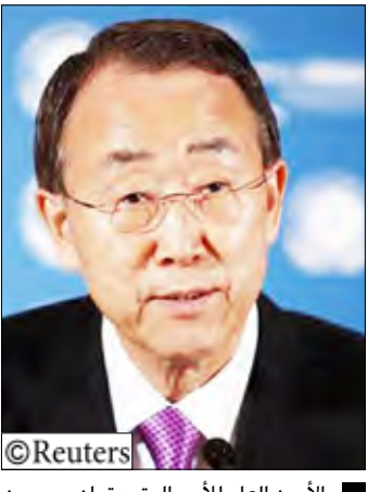
الأمين العام للأمم المتحدة بان جي مون في نيويورك

وسئل بان في مؤتمر صحافي شهري هل وافقت الأمم المتحدة على عدم إجراء اللجنة -التي يرأسها رئيس وزراء نيوزيلندا السابق جيفري بالمر وتضم دبلوماسيين مفضلين من تركيا وإسرائيل- مقابلات مع قادة عسكريين إسرائيليين. وقال بان "لا وجود لمثل هذا الاتفاق في الكواليس". وأضاف الأمين العام للأمم المتحدة "عملهم الرئيسي (أعضاء اللجنة) سيكون مراجعة وفحص تقارير التحقيقات الوطنية (التركية والإسرائيلية) والاتصال مع السلطات المحلية... المطالب بعد ذلك. سيتعين عليهم أن يناقشوا في ما بينهم ويتنسيق قريباً مع سلطات الحكومة الوطنية".