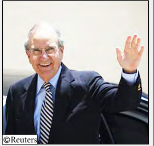
المبعوث الأمريكي جورج ميتشل