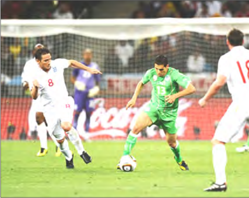
زاموش (مولودية الجزائري).