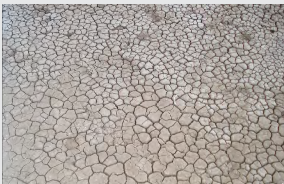
أرضية ملعب الحيشي اليوم

هناك مصادر كانت قد صرحت أن ملعب الحيشي سيدخل في مرحلة التأهيل، وانتظرتنا شهرا بعد آخر ، لتنعقد هذه التصريحات إلى غيرها وانتهت إلى لاشيء وليبقى كل شيء على حاله ويبقى الملعب يعاني. إن (الحيشي) ليس مجرد ملعب لكرة القدم إنه جزء مهم من تاريخ الرياضة اليمنية العريقة .. فلا تهملوه فهو يعني لنا الكثير .. ولن نرضى بغيره بدلا . استيقظوا من نومكم العييق.. أنجدوه فإنه يصرخ ويستغيث.. طالبا إعادة التأهيل .. وهذا ليس عليه بكثير . لقد شهد هذا الملعب مآثر مهمة حيث لعب على أرضيته نجوم المنتخب العراقي ، وغيرهم من النجوم العرب وغير العرب ، كما شهد الملعب تألق نجوم اليمن أمام الفرق الزائرة من الاتحاد السوفيتي السابق ، ومن بلدان افريقية وآسيوية كثيرة. كما كان شاهدا على زيارات تاريخية للراحل فهد الأحمد ورئيس الفيفا السابق جو هافيلانج وآخرين. فهل من المنطق أن يمحي كل ذلك ب (محاة) الإهمال؟ سؤال كبير يحمل همه من عرفوا (الحيشي) وأدركوا قيمته بالنسبة لكرة اليمنية عامة وكرة عدن على وجه الخصوص. وهو.. أي السؤال.. موضوع الآن على طاولة القيادة الرياضية في اليمن التي يبدها إخراج الملعب من معاناته أو تركه ليُعرف النهاية التي لاتليق بالبروح العملاقة أمثاله.