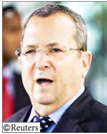
وزير الدفاع الإسرائيلي إيهود باراك

وقال وزير الدفاع الإسرائيلي الذي أدلى بشهادته أمام اللجنة بعد يوم من مؤثر رئيس الوزراء الإسرائيلي بنيامين نتنياهو امامها أن قرار التصدي للقافلة المكونة من ست سفن اتخذ حين "لم تأت الجهود الدبلوماسية بثمارها" وبعد "دراسة كل الاحتمالات ووضع المخاطر المختلفة في الاعتبار". وأضاف باراك الذي كان عضواً في قوات الكوماندوس وقائداً سابقاً ان المخابرات العسكرية حذرت من احتمال "صدام واحتكاك" خلال الغارة لكن ليس على المستوى الذي واجهته قوات الكوماندوس. واستمر باراك "لا توجد قط مخابرات كاملة قبل المهمة".