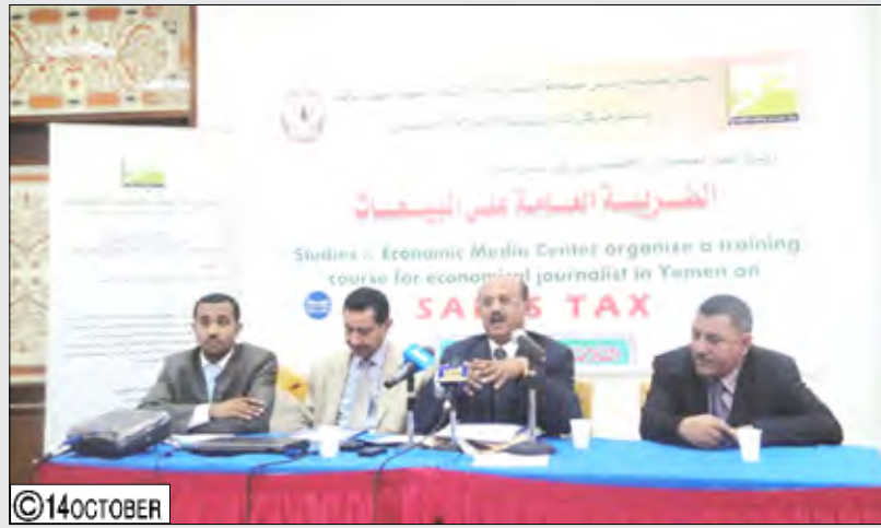
خلال افتتاح ورشة العمل