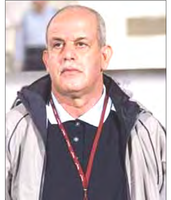
دي / متابعات:

وأضاف "سنحاول تسخير هذه الفترة بأفضل طريقة ممكنة، لتحقيق نتائج جيدة"، كما قال، مبديا في نفس الوقت اعترافه