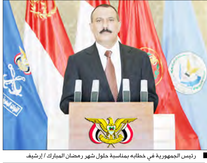
رئيس الجمهورية في خطابه بمناسبة حلول شهر رمضان المبارك

دار الإفتاء : اليوم أول أيام رمضان المبارك سبأ / سبأ: أعلنت دار الإفتاء الشرعية أن اليوم الأربعاء هو أول أيام شهر رمضان المبارك، وذلك بعد ثبوت رؤية هلال شهر رمضان من قبل لجنة مراقبة الأهلة بمحافظة الحديدة بعد غروب شمس أسس الثلاثاء 29 شعبان 1431 هـ. جاء ذلك في بيان أصدرته دار الإفتاء الشرعية في ما يلي نصه: بسم الله الرحمن الرحيم وان الحمد لله رب العالمين.. أما بعد.. امتثالاً لقول الله تعالى في كتابه الكريم: (شَهْرُ رَمَضَانَ الَّذِي أُنزِلَ فِيهِ الْقُرْآنُ هُدًى لِّلنَّاسِ وَبَيِّنَاتٍ مِّنَ الْهُدَى وَالْفُرْقَانِ فَمَنْ شَهِدَ مِنْكُمُ الشَّهْرَ فَلْيَصُمْهُ) صدق الله العظيم .. وعملًا بقول رسول الله صلى الله عليه وسلم "صوموا لرؤيته وانظروا لرؤيته، فإن غم عليكم فاكلوا عدة شعبان ثلاثين يوماً". تعلن دار الإفتاء الشرعية أنه ثبت رؤية هلال شهر رمضان مساء أمس الثلاثاء 29 من شهر شعبان، وثبتت رؤيته من قبل لجنة مراقبة الأهلة في محافظة الحديدة، حيث قامت اللجنة وبعض المشايخ والعلماء بالمراقبة والتحري وشهد كل من الشيخ