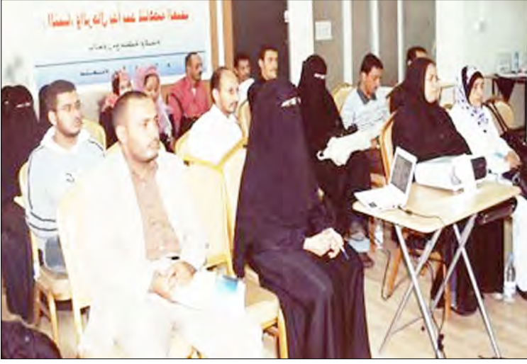
من فعاليات الدليل التدريبي لمناهضة العنف ضد المرأة