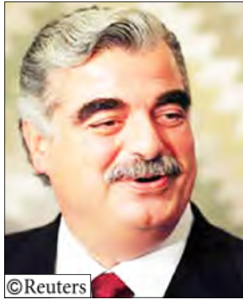
رئيس وزراء لبنان الأسبق رفيق الحريري

بتجسسهم لصالح إسرائيل من بينهم مسؤولون بارزون في قطاع الاتصالات. وحكم على لبنانيين آخرين بالاعدام لتجسسهم لصالح إسرائيل. ودعا الرئيس ميشال سليمان إلى انزال عقوبة قاسية بالجواسيس وقال انه سيقوع أي حكم اعدام يصل إليه. وقال نصر الله "في ضوء اعتقال عملاء مهمين يتأكد بشكل كامل أن للعدو الإسرائيلي سيطرة فنية كبيرة جداً على قطاع الاتصالات... النتيجة القمطعية أن الإسرائيليون لديهم سيطرة فنية في الساحة اللبنانية خصوصاً من خلال قطاع الاتصالات ومن خلال الخوفا يستطيعون التنصت على أي شخص على محيطه ويستطيعون أن يحددوا مكانه بشكل دقيق وأن يحددوا مكانه بشكل دقيق إذا أرادوا استهدافه في عملية اغتيال".