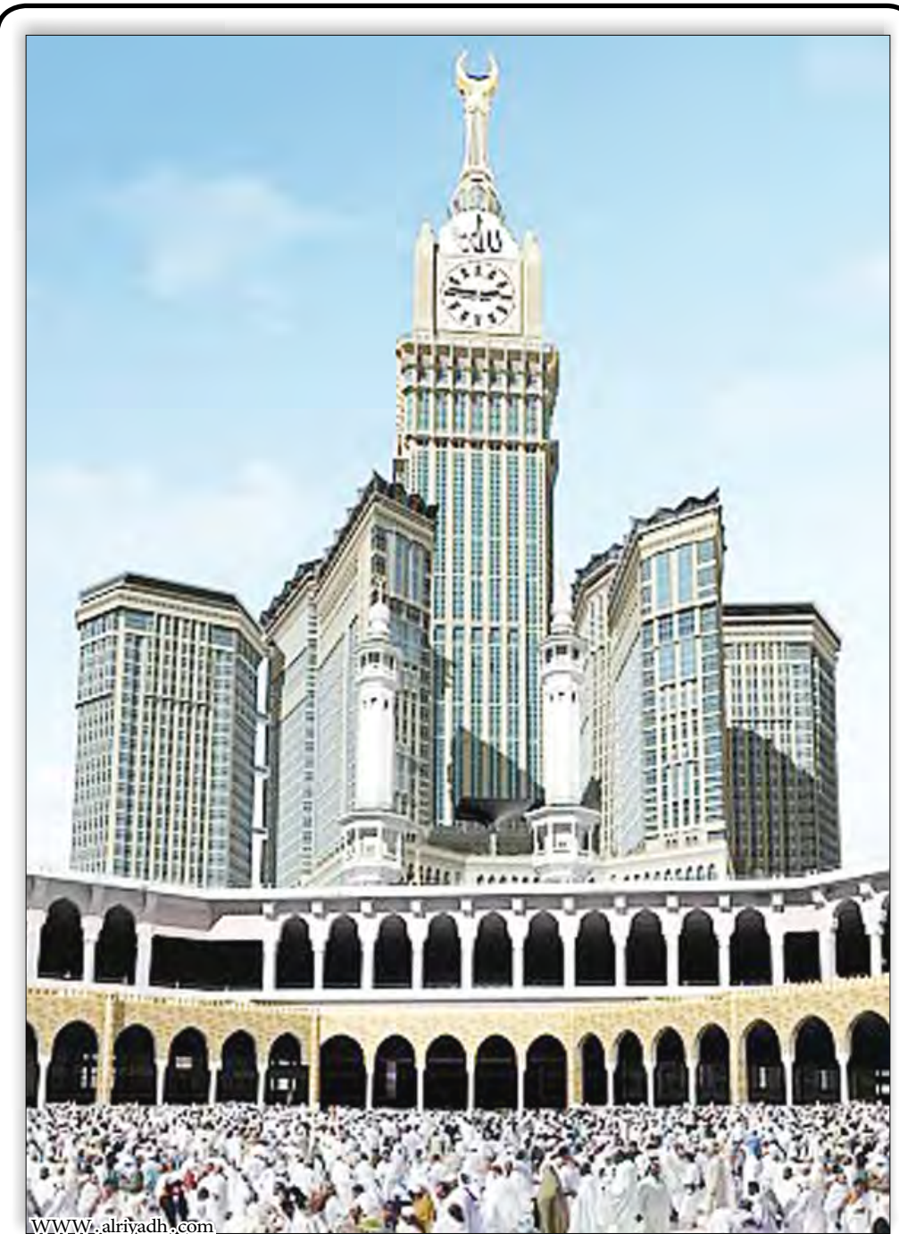
ساعة مكة يبلغ طول الساعة 45 متراً وعرضها 43 متراً، وهي بحسب الاركوبي الأكبر في العالم إذ إنها أكبر بستة أضعاف من ساعة بيغ بين في لندن. وسيتم ربط ساعة مكة بأكبر مراكز التوقيت في العالم بما في ذلك لندن وباريس ونيويورك وطوكيو