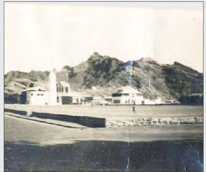
ملعب الحيشي بالأمس