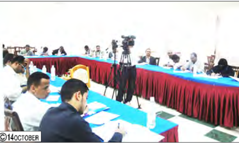
جانب من المشاركين في الورشة