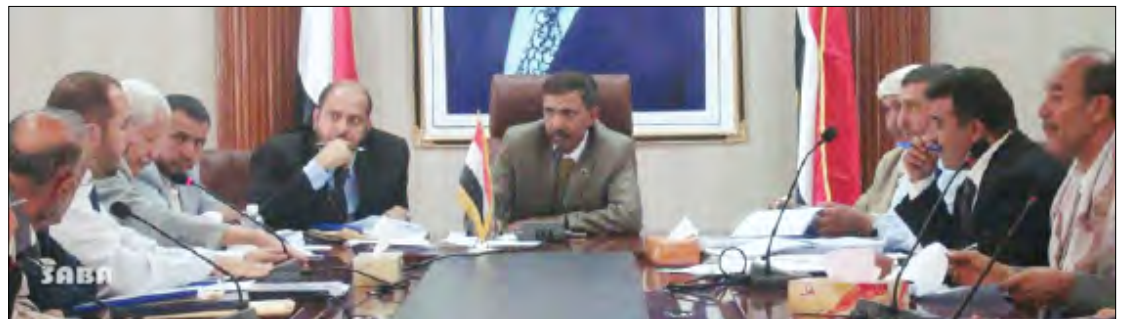
■ من اجتماع المجلس المحلي لأمانة العاصمة