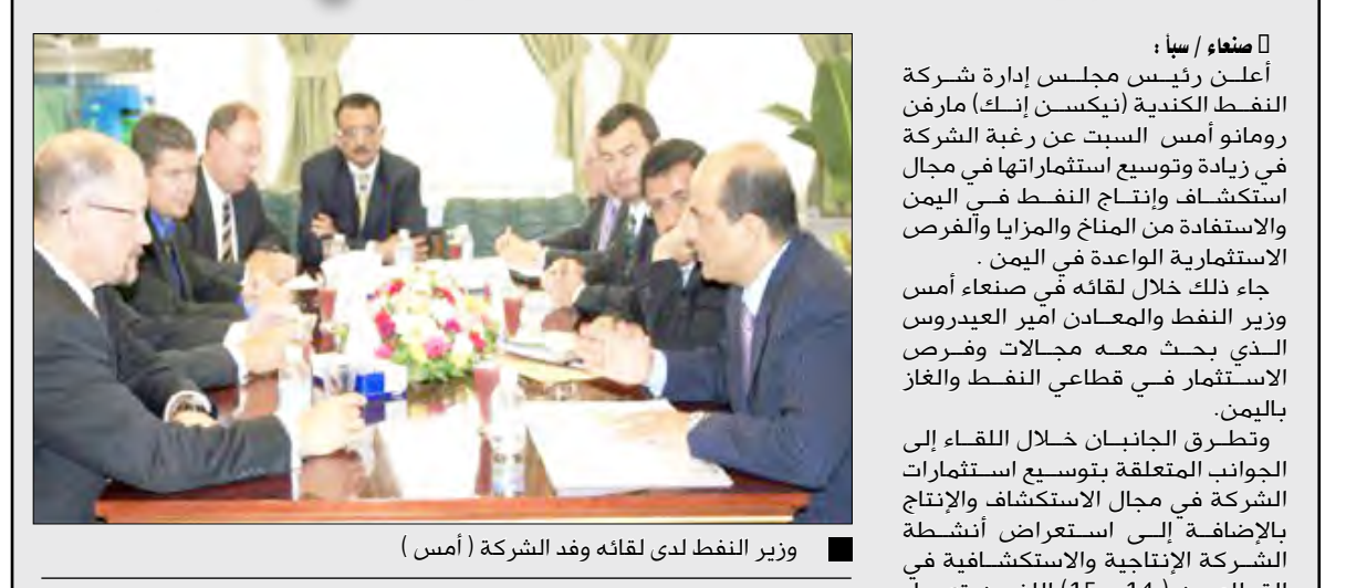
وزير النفط لدى لقائه وفد الشركة (أمس) التي حظيت بها الشركة من قبل الجهات المعنية خلال فترة عملها في اليمن، والأمير العيدروس الذي بحث معه مجالات وفرص الاستثمار في قطاعي النفط والغاز باليمن.