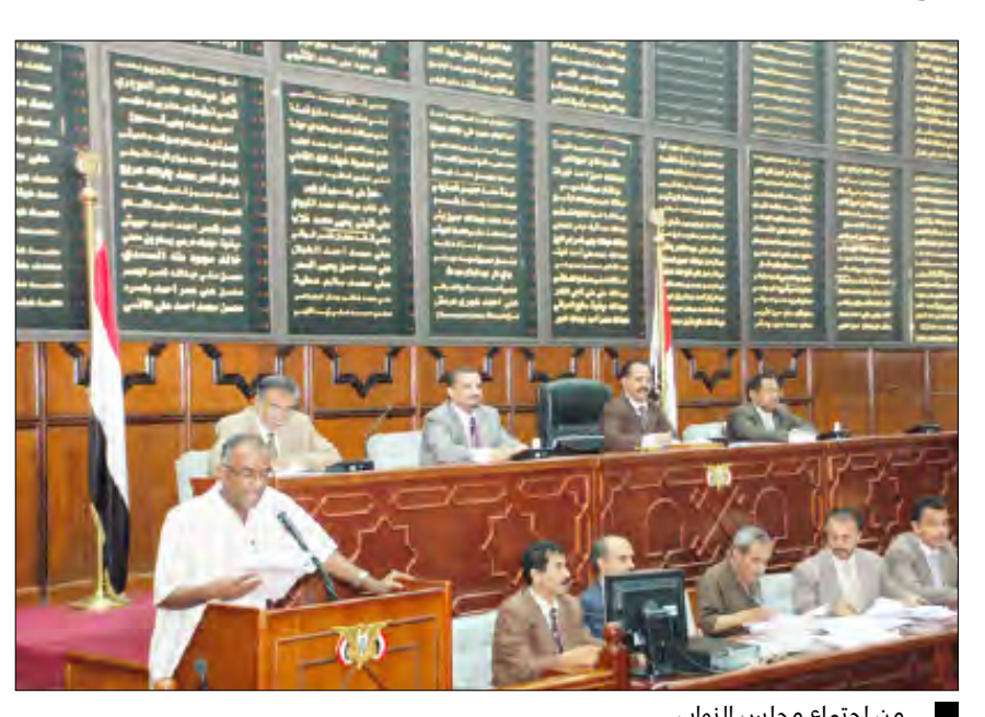
من اجتماع مجلس النواب