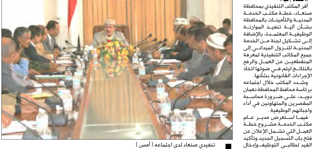
تنفيذي صنعاء لدى اجتماعه (أمس)

صنعا / سبأ : أقر المكتب التنفيذي بمحافظة صنعاء، خطة مكتب الخدمة المدنية والتأمينات بالمحافظة بشأن آلية تنفيذ الموازنة الوظيفية المعتمدة، بالإضافة إلى تشكيل لجنة من الخدمة المدنية للنزول الميداني إلى جميع المكاتب التنفيذية لمعرفة المنقطعين عن العمل والرفع بالنتائج ليتم في ضوءها اتخاذ الإجراءات القانونية بشأنها. وشدد المكتب خلال اجتماعه برئاسة محافظ المحافظة نعمان المقصرين والمتهاونين في أداء واجباتهم الوظيفية. فيما استعرض مدير عام مكتب الخدمة مشروع خطة العمل التي تشمل الإعلان عن فتح باب التسجيل الجديد وتأكيد القيد لطالبي التوظيف، وإدخال البيانات للحاسب الآلي والمراجعة والتصويب، وكذا منح شهادات القيد عبر شبكة الانترنت واستقبال حالات التعديل في البيانات المدونة في شهادات القيد وإبلاغ الوحدات