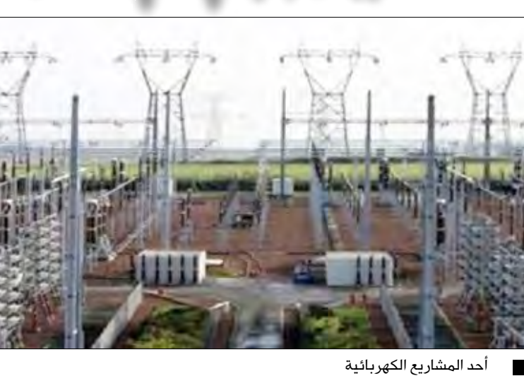
أحد المشاريع الكهربائية

صنعا / سبأ : افتتح وزير الكهرباء والطاقة المهندس عوض سعد السقطري ومحافظ حضرموت سالم أحمد الخبشي أمس السبت مشروع تقوية الكهرباء لمناطق مديرية عمد بحضرموت والمتضمن إنشاء خط 33 كيلوفولت بطول 41 كيلومتر مع محطة تحويلية للكهرباء بكلفة بلغت 400 مليون ريال تمويل حكومي. وسيسهم المشروع في تحسين خدمات الكهرباء وإيصالها إلى 60 قرية من قرى وادي عمد. وأوضح وزير الكهرباء والطاقة خلال الافتتاح أن المشروع يأتي ترجمة للبرنامج الانتخابي فخامة الرئيس علي عبدالله صالح رئيس الجمهورية الذي أكد ضرورة إيصال الكهرباء إلى المناطق والقرى الريفية والاهتمام بتحسين خدمات الكهرباء. ونوه الوزير السقطري بالجهود المبذولة من قبل الفنيين والمهندسين في فرع المؤسسة العامة للكهرباء بالوادي والصحراء وتعاون المواطنين في المنطقة والذي مكن من إنجاز هذا المشروع الحيوي في موعده المحدد. مؤكداً اهتمام الوزارة والمؤسسة العامة للكهرباء بتحسين خدمات الكهرباء وتوسيع شبكة المستفيدين منها بما في ذلك إيصال إمدادات الكهرباء إلى المناطق والقرى الريفية وإيلاء المزيد من الاهتمام بأعمال الصيانة وتحسين الجهد والتقليل من الفاقد. إلى ذلك افتتح وزير الكهرباء ومحافظ حضرموت محطتين تحويليتين للكهرباء في منطقتي وادي بن علي بمديرية شبام ونهيمه بوادي سر بمديرية القطن البالغ كليتهما الإجمالية 416 مليوناً و 405 آلاف ريال بتمويل حكومي. وتتضمن كل محطة منها تركيب محول