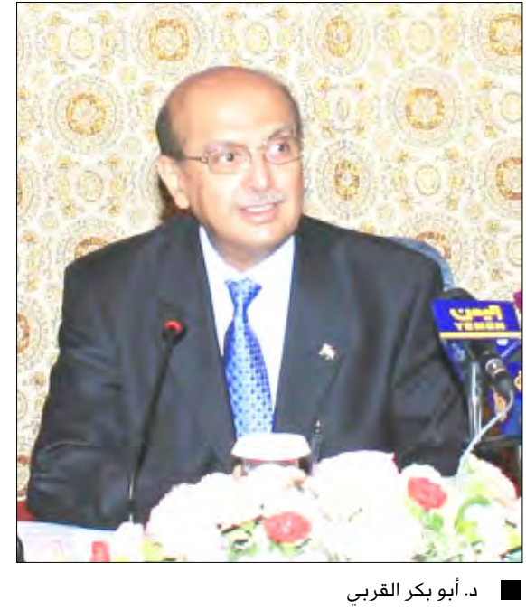
د. أبو بكر القربي

صنعا / سيا: أكد الدكتور أبو بكر القربي وزير الخارجية «أن اليمن يعلق أهمية كبيرة على مبدأ تحرير التجارة بما يتواءم مع تحقيق مشاركة عادلة ومتوازنة في الاقتصاد العالمي». مشيراً إلى أن اليمن اتخذ خطوات عملية لإعادة تشكيل الاقتصاد وإصلاح السياسات التجارية عن طريق تحريرها وإزالة عوائق انسياب التجارة والاستثمار ورؤوس الأموال والتحويلات. جاء ذلك في كلمة ألقاها خلال ترؤسه جلسة المؤتمر الوزاري العاشر لرابطة الدول المطلة على المحيط الهندي أسس الأول حيث أوضح أن الحكومة اليمنية نفذت خططا للإصلاح الاقتصادي تهدف إلى زيادة تنوع الصادرات غير النفطية والتي تجد لها فرصاً واعدة في المجال الزراعي والصناعي لما تتمتع به اليمن من تنوع جغرافي ومناخي وتوفر للموارد البشرية والطبيعية مشيراً إلى أنها تعول على الاستثمار كأحد الركائز الأساسية لتحقيق التنمية المستدامة. ولفت الوزير القربي إلى أن فرص الاستثمار في اليمن في المجالات السياحية والثروة السمكية ومجالات أخرى عديدة تعد فرصاً واعدة خاصة أن القوانين التي سنتها الحكومة توفر الجو الملائم للاستثمار وتحقيق الضمانات اللازمة. وأشار إلى أن هذا الاجتماع يأتي في وقت تحتاج فيه الدول الأعضاء لاتخاذ قرارات مهمة لحماية مصالحها في المنطقة خاصة أن الفرص المتاحة لتعزيز التجارة والعلاقات الاقتصادية تعتبر واعدة لتحقيق الفائدة المرجوة.