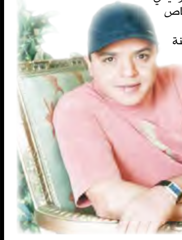
المنطقة الحرة في عدن

سنين / سها: وصل إلى مدينة تريم بمحافظة حضرموت الفنان المصري الكوميدى محمد هندي في زيارة للمحافظة حضر خلالها الحفل الختامي الخاص