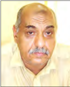
الشيخ الدكتور /