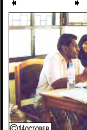
خلال الاجتماع التأسيسي للجمعية النسوية