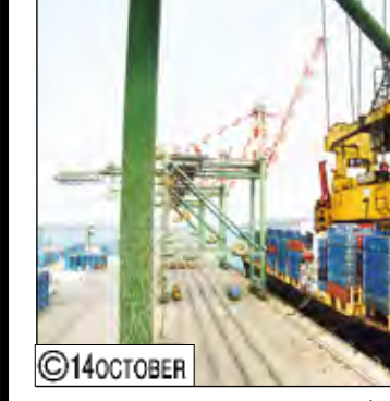
المنطقة الحرة في عدن

بلغت قيمة صادرات اليمن عبر ميناء عدن والحواليات ومطار عدن الدولي، ثلاثة مليارات و 975 مليوناً و 752 ألف ريال خلال يوليو الماضي.