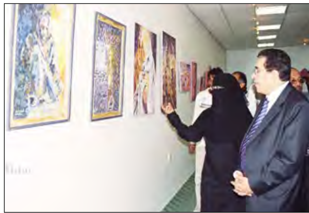
وزير الثقافة خلال افتتاح معرض التشكيلية