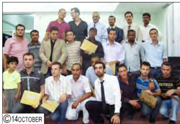
من الطلاب و الطالبات المشاركين في البرنامج التدريبي