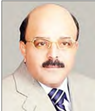
علي حسن الشاطر

الأهداف والتطلعات السياسية المرحلة المجمع عليها من كل القوى الوطنية باختلاف ألوان طيفها السياسي والاجتماعي.. ومن هذا المنظور الوطني يمكن القول إن هذا الاتفاق يمثل انجازا تاريخيا للقيادة اليمنية بالنظر إلى الواقع الوطني المتردي، ويبدئ لبداية مرحلة سياسية جديدة في مسار العملية الديمقراطية والتنمية الوطنية، أعلن عنها فخامة الأخ الرئيس في كلمته التي أعقبت التوقيع على المحضر، وباقتضاب شديد حدد عناوينها الرئيسة ومهامها الآتية والمنظورة.. مرحلة يكون عنوانها وهدفها الرئيس، وإطارها المكاني والزمني، وسفينة إبحارها التي تربط بها مصير الجميع دون استثناء حين قال: نحن في سفينة واحدة ويجب أن نبحر بها سويا وأن تكون هناك قيادة لهذه السفينة من كل القوى السياسية، وتمثل قواها الاجتماعية من كل أبناء الوطن اليمني في الداخل والخارج المنضوي نشاطهم وسلوكهم