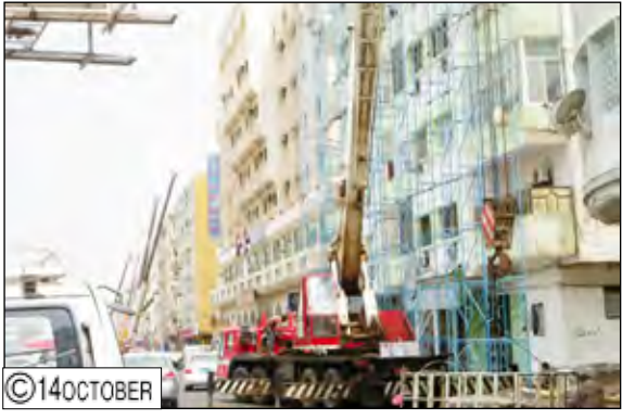
تلاء واجهات مباني الشارع الرئيسي بالمعلا

عن / أثمار الوالي، تتواصل في محافظة عدن تلاء الواجهات الامامية لمباني الشارع الرئيسي ( شارع مدرم ) بمديرية المعلا التي تنفذها قيادة المحافظة في إطار خليجي 20. وذكر الدكتور محمد حسن عبد شيخ مدير عام مديرية المعلا ل ( 14 أكتوبر ) أن الكلفة الإجمالية للمشروع بلغت 187 مليون ريال شملت التلاء والتليس، مشيراً إلى أن حصة مديرية المعلا تبلغ 60 ألف متر مربع. وأشار مدير المديرية إلى أن هذا المشروع سيظهر الشارع الرئيس بالمظهر اللائق لاستقبال زوار فعاليات خليجي عشرين.