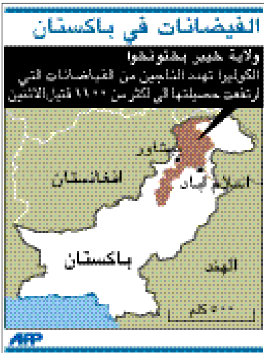
الفيضانات في باكستان

الولاية خيبر پختونخوا الكوليرا تهدد الملايين من الفيضانات التي ارتفعت حصيلتها في أكثر من 40 قتل الاثنين