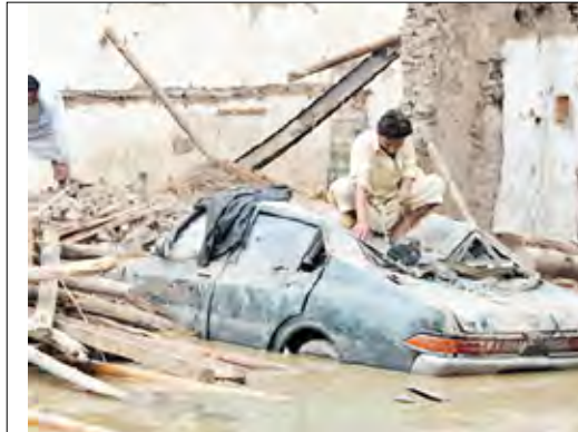
اضرار السيول في باكستان

وفي الصين قالت وكالة شينخوا الصينية للأنباء إن