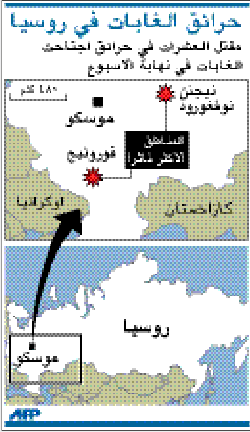
حرائق الغابات في روسيا

مقتل العشرات في حرائق اجتاحت الغابات في نهاية الأسبوع