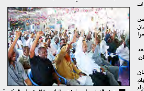
بعض النواب مارسوا ضغوطا شديدة لاستجواب الحكومة

من جهة أخرى دعت جماعة أهل السنة والجماعة الموالية للحكومة إلى تعديل تفويض قوات حفظ السلام الأفريقية العاملة في مقديشو، بما يخلوها مهاجمة