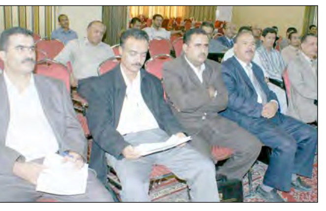
من فعاليات الورشة