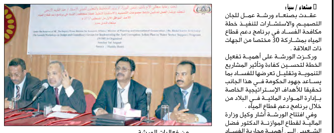
من فعاليات الورشة

صنعاء / سبأ: عقدت بصنعاء ورشة عمل للجان التصويم والاستشارات لتنفيذ خطة مكافحة الفساد في برنامج دعم قطاع المياه بمشاركة 30 مختصاً من الجهات ذات العلاقة. صنعاء / سبأ: عقدت بصنعاء ورشة عمل للجان التصويم والاستشارات لتنفيذ خطة مكافحة الفساد في برنامج دعم قطاع المياه بمشاركة 30 مختصاً من الجهات ذات العلاقة.