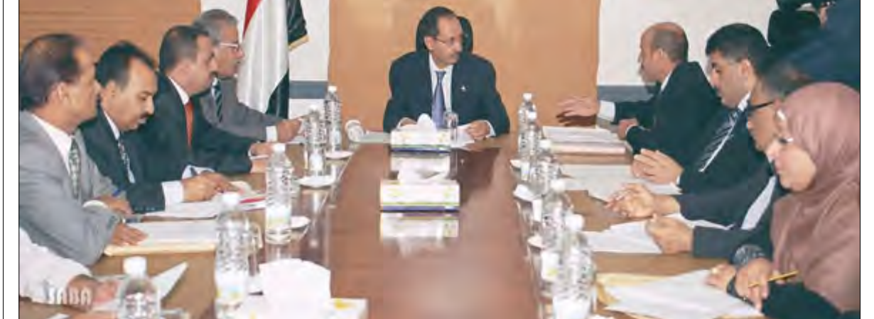
الأرجبي ترؤسه اللجنة الوزارية العليا لتسيير مشروع الرئيس الصالح السكني والزراعي

صنعاء / سبأ: ووزير السياحة نبيل الفقيه لمناقشة الشروط والمعايير الخاصة بالمستفيدين من المشروع والتفاصيل المتعلقة بكيفية استرداد كلفة إنشاء المشروع وفق نظام التقسيط المريح. واستعرض الاجتماع المسودة الأولية للشروط المرجعية الخاصة بالإستراتيجية الوطنية للإسكان والتي من المقرر إجرائها إلى مجلس الوزراء لإقرارها بصيغتها النهائية. صنعاء / سبأ: مشروع الرئيس الصالح السكني والزراعي لذوي الدخل المحدود والشباب أمس اجتماعاً لها برئاسة نائب رئيس الوزراء للشؤون الاقتصادية وزير التخطيط والتعاون الدولي رئيس اللجنة عبد الكريم إسماعيل الأرجبي وكرس الاجتماع الذي حضره وزير الأشغال العامة والطرق المهندس عمر الكرشمي