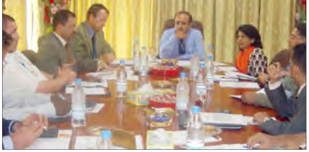
الكحلاني لدى لقائه ممثلي المنظمات الدولية والإنسانية العامة بصعدة

صنعاء / سبأ: بحث وزير شؤون مجلسي النواب والشورى رئيس الوحدة التنفيذية لإدارة مخيمات النازحين محمد أحمد الكحلاني أمس مع ممثلي المنظمات الدولية والإنسانية العاملة بصنعاء إجراءات تطبيق آلية تنظيم تنقلات العاملين في إطار تلك المنظمات لتقديم الدعم والمساعدات الغذائية والاحتياجات الإنسانية للنازحين والمتضررين من الحرب الأخيرة بمحافظة صعدة وعمران. صنعاء / سبأ: بحث وزير شؤون مجلسي النواب والشورى رئيس الوحدة التنفيذية لإدارة مخيمات النازحين محمد أحمد الكحلاني أمس مع ممثلي المنظمات الدولية والإنسانية العاملة بصنعاء إجراءات تطبيق آلية تنظيم تنقلات العاملين في إطار تلك المنظمات لتقديم الدعم والمساعدات الغذائية والاحتياجات الإنسانية للنازحين والمتضررين من الحرب الأخيرة بمحافظة صعدة وعمران.