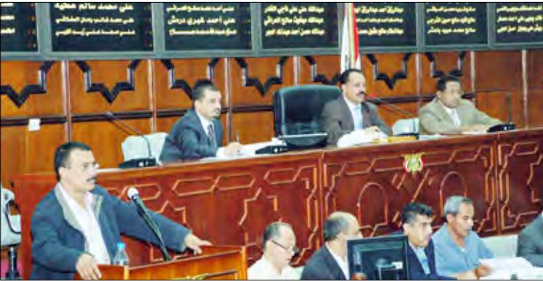
من جلسات مجلس النواب

خبرة في العمل الأكاديمي والإداري في جامعة معتمدة بعد الدكتوراه. يشترط في رئيس الجامعة الحكومية أن يكون حاصلًا على درجة الدكتوراه ومرتبًا الأستاذية مع عشر سنوات رئيس مجلس الوزراء وعرض الوزير، ويختار من بين ثلاثة أعضاء من هيئة التدريس يرشحهم مجلس الأمناء.