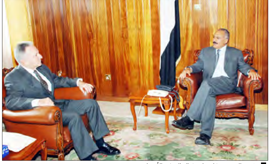
رئيس الجمهورية لدى استقباله السفير الأمريكي

سناء / سبأ: استقبل فخامة الأخ الرئيس علي عبدالله صالح رئيس الجمهورية أمس سفير الولايات المتحدة الأمريكية لدى اليمن ستيفن سينتش، للتوديع بمناسبة انتهاء فترة عمله. وسلم السفير الأمريكي لفخامة الأخ الرئيس خلال المقابلة رسالة خطية من الإدارة الأمريكية تتعلق بعلاقات التعاون الثنائي بين البلدين الصديقين والسبل الكفيلة بتعزيزها وتطويرها في المجالات كافة وعلى وجه الخصوص التعاون في المجال التنموي ومكافحة الإرهاب. وأعلنت الإدارة الأمريكية في الرسالة قرار الولايات المتحدة الأمريكية رفع المساعدات السنوية المقدمة لمسيرة التنمية والديمقراطية والتنمية الاقتصادية في اليمن إلى ثلاثمائة مليون دولار .. مجددة التزام الولايات المتحدة بالوقوف إلى جانب اليمن وأمنه واستقراره ووحدته. وأكدت الرسالة التزام الإدارة الأمريكية بالعمل مع شركاء التنمية الدوليين من أجل حشد الدعم لليمن لتعزيز قدراته في مواجهة التحديات الاقتصادية والتنموية والأمنية. وقد أثنى فخامة الأخ الرئيس