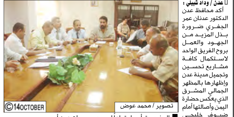
الجفري يترأس اجتماعا لمديري مديريات عدن أمس

عنان / واد شيلي: أكد محافظ عدن الدكتور عدنان عمر الجفري ضرورة بذل المزيد من الجهود والعمل بروح الفريق الواحد لاستكمال كافة مشاريع تحسين وتجميل مدينة عدن وإظهارها بالمظهر الجمالي المشرق الذي يعكس حضارة اليمن وأصالتها أمام ضيوف خليجي (20) وكذا الترويج للمواقع السياحية والاستثمارية في المحافظة. جاء ذلك خلال ترؤس الأخ المحافظ أمس اجتماعاً ضم مديري عموم المديريات والجهات ذات العلاقة والهيئة الإدارية للمجلس المحلي في محافظة عدن. واستعرض الاجتماع جملة من المشاريع