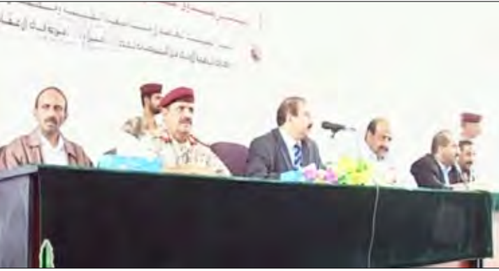
هاجر في حفل تشييد إعادة إعمار صعدة القديمة

سناء / سبأ: دشنت صندوق إعمار صعدة أمس بدء إعادة الإعمار بمدينة صعدة القديمة ومنطقة ال عقاب وصرف الدفعة الأولى من التعويضات للمتضررين. وأشار المحافظ هاجر إلى أن القيادة وفي حفل التشييد نقل محافظ صعدة طه عبد الله هاجر، تحيات فخامة رئيس الجمهورية لإبناء المحافظة .. مؤكدا حرص فخامته واهتمامه ومتابعته المستمرة لعملية إعادة الإعمار وتنمية المحافظة وترسيخ عقاب وصرف الدفعة الأولى من التعويضات للمتضررين. وأشار المحافظ هاجر إلى أن القيادة السياسية اعتمدت (20) مليار ريال كمرحلة أولى لإعادة