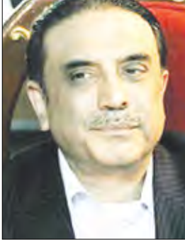
أصف علي زرداری

سناء / سبأ: بعث فخامة الأخ الرئيس علي عبدالله صالح رئيس الجمهورية برفقة عزاء ومواساة لفخامة الرئيس أصف علي زرداری رئيس جمهورية باكستان الإسلامية الشقيقة في ضحايا كارثة السيول والفيضانات التي تعرضت لها عدد من المناطق في بلدكم، وما خلفته من وفيات وإصابات ومفقودين من أبناء الشعب الباكستاني الشقيق. إننا في الجمهورية اليمنية قيادة وحكومة وشعباً، إذ نشاطركم والشعب الباكستاني الشقيق أحزانه بهذا المصاب الأليم، لهذا المصاب مواساتنا لأسر الضحايا والشعب الباكستاني عن أحر تعازينا وصادق مواساتنا القلبية. سائلين المولى عز وجل أن يتعمد الشهداء بوسع رحمته ورضوانه، وأن يسكنهم فسيح جناته، وأن يمن على الصابين بالشفاء العاجل، وأن يجنب باكستان وسائر بلاد المسلمين شر الكوارث والأمن إنه سميع مجيب.