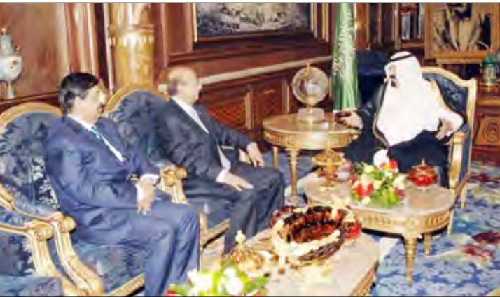
خادم الحرمين الشريفين يستقبل وزير الخارجية

سناء / سبأ: تسلم خادم الحرمين الشريفين الملك / عبدالله بن عبدالعزيز ملك المملكة العربية السعودية رسالة خطية من فخامة الأخ الرئيس / علي عبدالله صالح رئيس الجمهورية، تتناول العلاقات الأخوية الحميمة ومجالات التعاون المشترك بين البلدين الشقيقين وسبل تعزيزها وتطويرها بالإضافة إلى التطورات على الساحتين الإقليمية والدولية ذات الاهتمام المشترك. قام بتسليم الرسالة وزير الخارجية الدكتور / أبو بكر القربي خلال استقبال خادم الحرمين الشريفين له يوم أمس الاثنين في قصره بجدة.