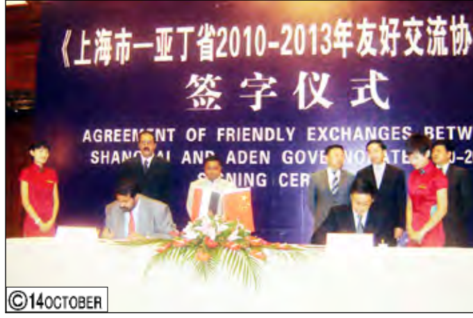
المحافظ أثناء التوقيع على اتفاقية التوأمة بين مدينتي عدن وشنغهاي

على عدد من المجالات والقطاعات منها كيفية فتح خط مباشر يربط مدينة عدن بشنغهاي جواً وبحراً كنقطة تجمع لتغطية سوق عدن الاستهلاكية من جانب وإقليم الشرق الأوسط وشمال أفريقيا من جانب آخر إضافة إلى سبل تعزيز التعاون والعلاقات الاقتصادية والتجارية بين مدينة عدن وشنغهاي وخصوصاً أن محافظة عدن تسعى إلى تهئية المناخ الاستثماري فيها وتعزيز البنية التحتية. وتأتي زيارة وفد محافظة عدن إلى مدينة شنغهاي، تنفيذاً لتوجهات الأخ الرئيس /علي عبد الله صالح رئيس الجمهورية كأحدى مخرجات البرنامج الانتخابي في مجال تعزيز العلاقات الإقليمية والدولية على مستوى المحافظات إضافة إلى تنفيذ إحدى مخرجات استراتيجية التنمية الاقتصادية المحلية