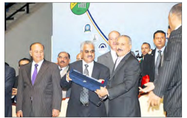
رئيس الجمهورية خلال تسلمه دروعاً من وزير التعليم العالي ورئيس جامعة صنعاء وشباب المخيمات والمراكز الصيفية