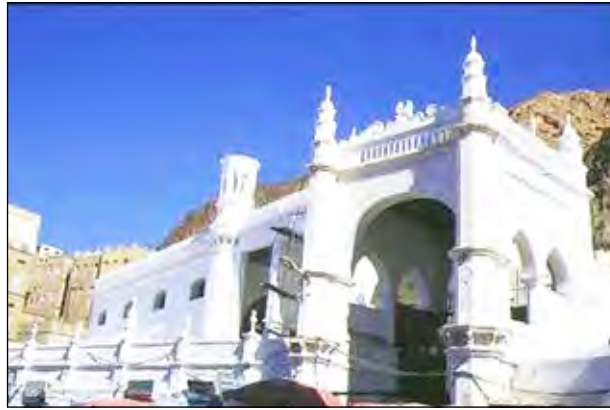
قصر الرناد بتريم