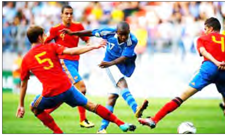
لقطة من المباراة النهائية