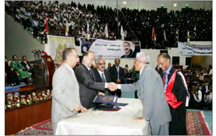
نائب رئيس الجمهورية خلال تكريم الفائزين بجائزة رئيس الجمهورية للبحث العلمي