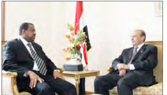
وزير الخارجية خلال استقباله نظيره السوداني