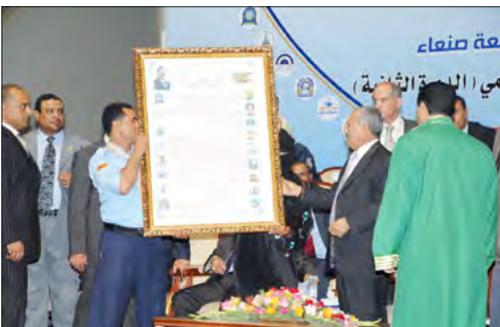
ويتسلم وثيقة عهد مقدمة من جولة جامعة صنعاء

وأكد أن اليمن تربطه علاقات أخوية متميزة ومتميزة مع دول الجوار، معبرا عن تطلعه إلى أن تكون تلك الدول سوقاً مفتوحة للعمالة اليمنية. وتابع قائلا : " نأمل من أشقائنا في دول الجوار أن يفتحوا المجال لاستقطاب العمالة اليمنية فقد أصبح لدينا الآن عمالة ماهرة، بعد أن خصصنا وزارة للتعليم المهني والفني وتوسعت في إنشاء المعاهد وابتدت بتخرج آلاف الطلاب سنويا من المعاهد