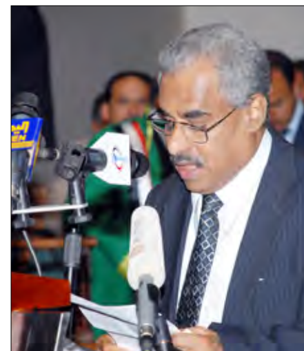
وزير التعليم العالي يلقي كلمة في الحفل