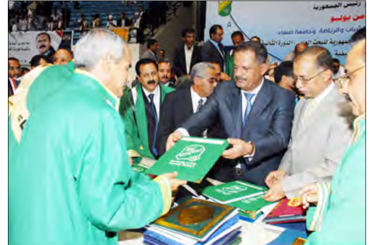
رئيس الوزراء يسلم الفائزين بالشهادات التقديرية