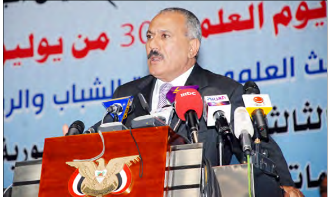
رئيس الجمهورية يلقي كلمة في الاحتفال