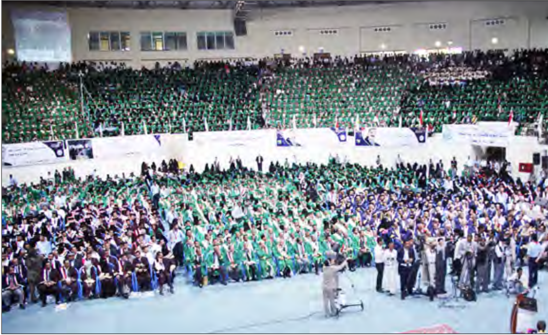
جانب من المشاركين في الاحتفال