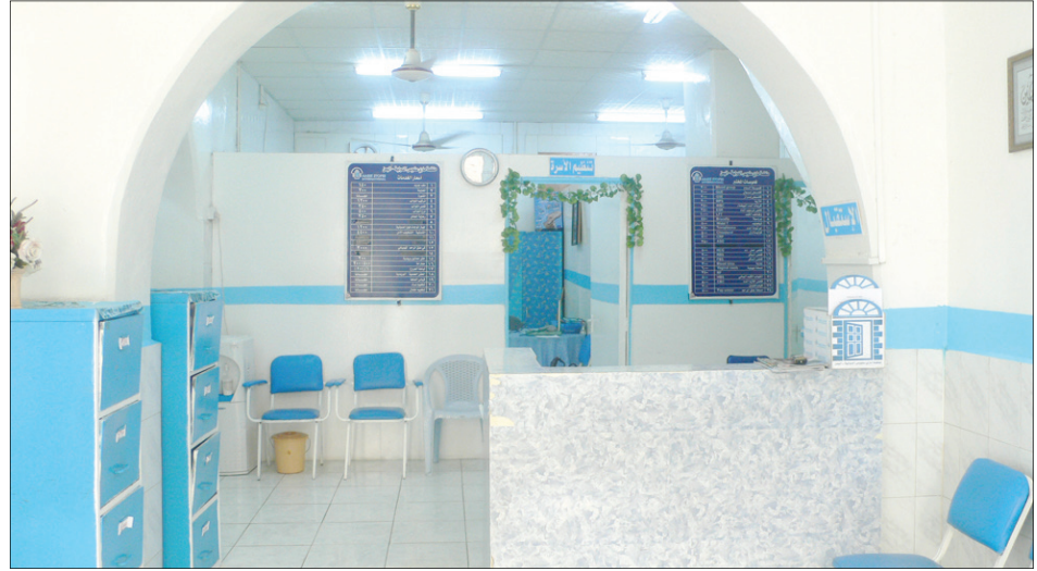
مدخل المركز الذي يبدو وكأنه منزل وليس مشفى

1- العزل. 2- الرضاعة الطبيعية. 3- فترة الأمان (المعتمدة على الوعي بفترة الخصوبة). ثانياً : الوسائل الموضوعية : وتشمل 1- العازل (الواقوي الذكري). 2- المواد الموضوعية (الكيميائية). ثالثاً : الوسائل الهرمونية : وتنقسم إلى 1- أحادية الهرمون. 2- هرمونات مركبة. 3- حقن منع الحمل (تحتوي على مادة البروجسترون وتعطي تحت إشراف طبي كل 3 أشهر). 4- الغرسات (وهي كبسولات تحت الجلد) من البلاستيك الرخو أحادية الهرمون وتمنع الحمل لمدة 3 سنوات وتصل كفاءتها إلى 99%.