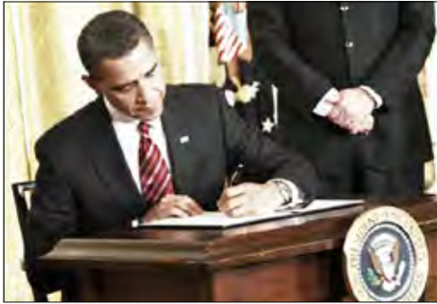
الرئيس الأميركي سيرد قريبا على المقررات العربية بشأن استئناف التفاوض

ونقل راديو "سوا" الأميركي أمس السبت عن كراولي قوله "إن الجزء الأكبر من الرسالة يتناول على الكيفية التي يمكن أن تبدأ بها المفاوضات المباشرة بين الفلسطينيين وإسرائيل، وعلى مدى التفاهات أو التقدم الذي يمكن أن يحصل بشأن القضايا التي ستطرح للنقاش". وأعرب المتحدث الأميركي عن تفاؤله بتحقيق تقدم في المفاوضات بين الطرفين، وقال "أمصينا الأشهر القليلة الماضية نحاول وضع أسس متينة تسهم في تقدم المحادثات، وتوقعاتنا هي موافقة رئيس الوزراء الإسرائيلي بنيامين نتانياهو والرئيس الفلسطيني محمود عباس على المضي قدما إلى المحادثات المباشرة، نريد لذلك الأمر أن يحدث بأسرع وقت ممكن وسنركز عليه في