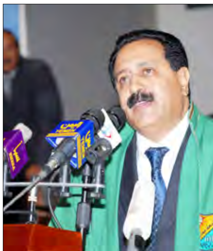
رئيس جامعة صنعاء يلقي كلمة في الحفل