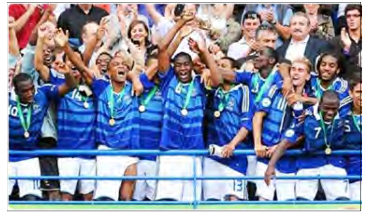
منتخب شباب فرنسا

أكثر من مناسبة خلال مباريات الفريق السابقة. ولم يختلف الحال كثيراً هذه المرة فقبل خمس دقائق من صافرة النهاية أبعده الحارس الإسباني كرة خطيرة من غايل كاكوتا، تابعها لكاكيت بكرة رأسية إلى داخل مرمى الضيوف محرراً هدف التنويع.