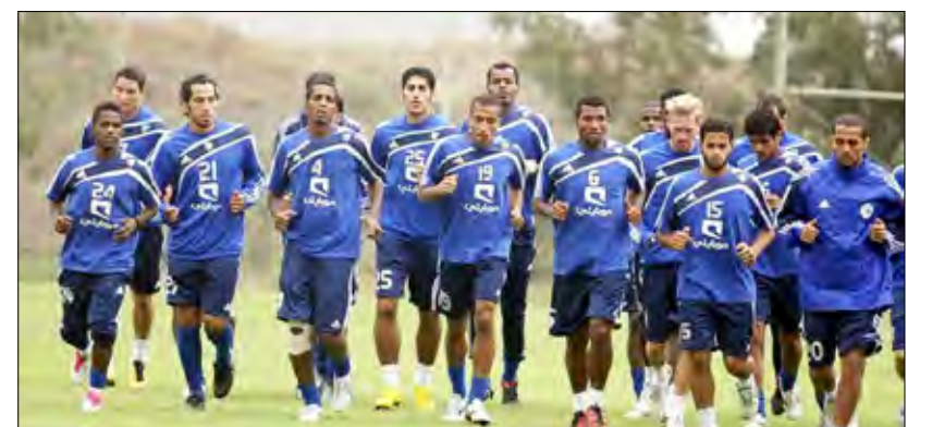
من المعسكر الأوروبي لفريق الهلال

والاتفاق والفتح والقادسية، معسكراتها في ألمانيا لقلّة الكلفة التي لا تتجاوز 250 ألف دولار إضافة إلى أن ألمانيا توجد بها عدة درجات للأندية تتدرج من الأولى إلى الرابعة كما أن معظم فرقها بدأت في الاستعداد للموسم المقبل ما يعني وجود فرص لإقامة العديد من المباريات الودية في الوقت الذي ترفض فيه فرق أسبانيا وإنجلترا والسويد الاحتكاك في هذا التوقيت مع فرق لن تضيف لها جديداً لضعف مستواها. ولم تستطع أندية التعاون والفيصلي والحزم إقامة معسكراتها في أوروبا لضعف ميزانياتها ولجات لإقامة معسكراتها بمصر.