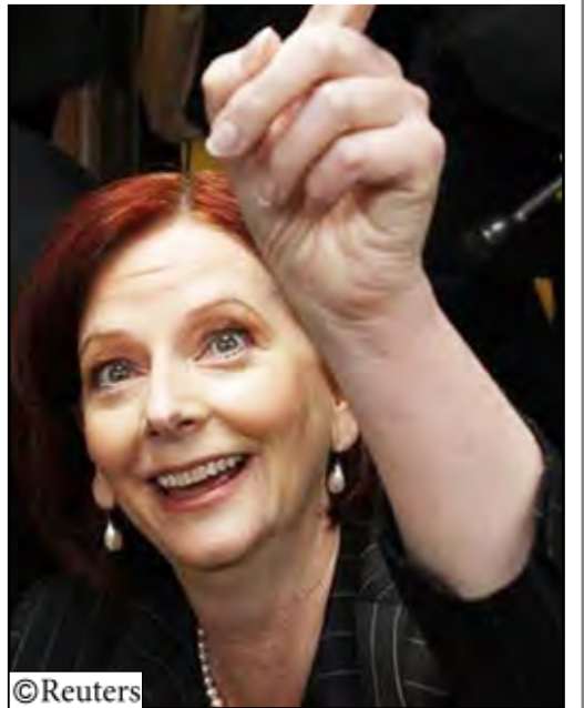
رئيسة وزراء أستراليا جوليا جيلارد في تجمع انتخابي في ميلبورن.

14 أكتوبر / رويترز: أظهر استطلاع جديد للرأي يوم أمس السبت أن رئيسة وزراء أستراليا جوليا جيلارد مقبلة على هزيمة في الانتخابات العامة التي ستجري في 21 أغسطس إذ أن الصراع الداخلي في حكومتها وتسريبات حكومية تهدد بالتأثير على حملتها. لكن جيلارد التي مارّلت معظم استطلاعات الرأي الأخرى وأغلب الخبراء السياسيين يتوقعون فوزها تتعهد بمواصلة الكفاح للحفاظ على المنصب.