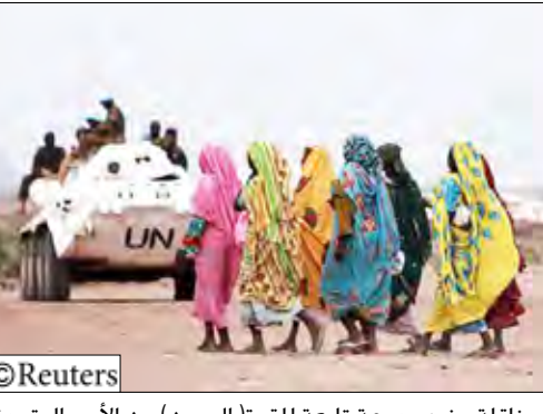
ناقلة جنود مدرعة تابعة للقوة (الهجين) بين الأمم المتحدة والاتحاد الإفريقي تمر بجوار نازحات في جنوب دارفور.