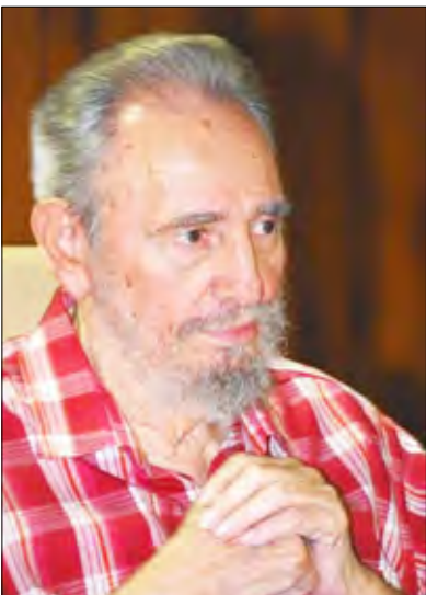
الزعيم الكوبي فيدل كاسترو خلال اجتماع مع شبان في هافانا

بالسجن فترات بين 15 عاما والسجن مدى الحياة. وقال الادعاء الأمريكي إن الرجال كانوا ضمن حلقة تجسس كوبية تجسست على المنفيين الكوبيين في فلوريدا وسعت للتسلل إلى المنشآت العسكرية الأمريكية.