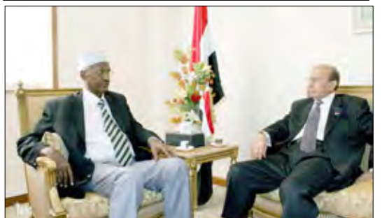
وزير الخارجية خلال استقباله نظيره الصومالي