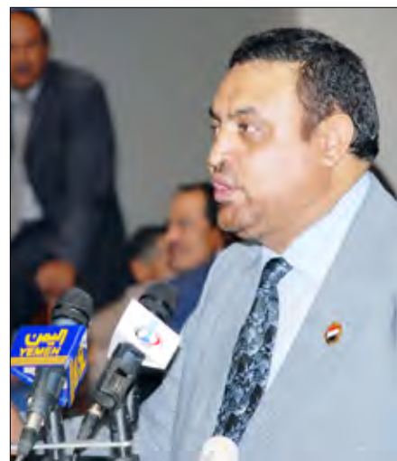
وزير الشباب يلقي كلمة في الحفل