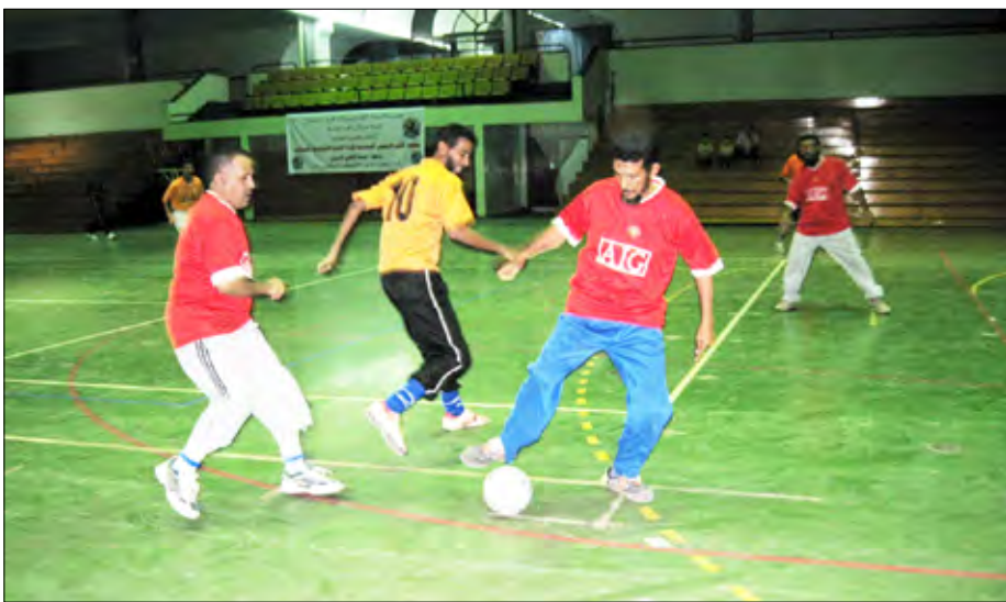
من منافسات النسخة الماضية