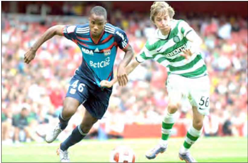
من مباراة ليون وسلتيك