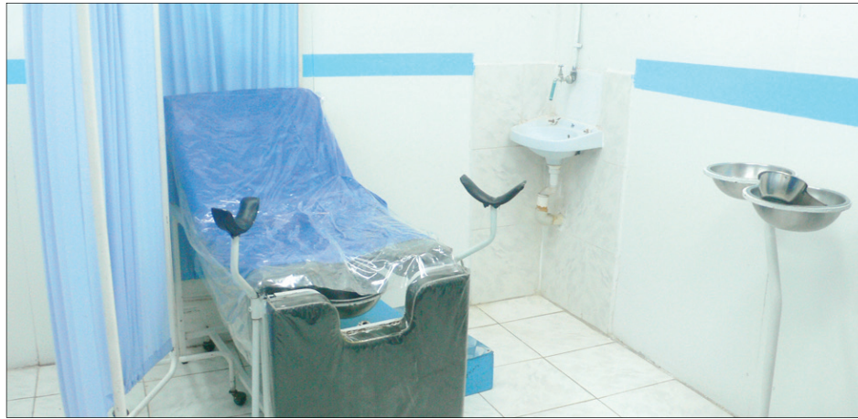
ادوات الشفط اليدوي

هناك عدة وسائل معتمدة لتنظيم الأسرة منها : الوسيلة الأولى وهي x الوسائل الطبيعية أو التقليدية : وهي