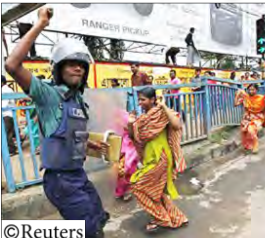
شرطي خلال مصادمات مع متظاهرين في دكا

طريقا سريعا في فاثولا التي تقع على بعد 16 كيلومترا شرقي دكا يوم أمس السبت. وأغلقت معظم مصانع الملابس في دكا بعد الاضطرابات التي بدأت يوم أمس الأول الجمعة. وتنتج المصانع الموجودة في دكا ملابس لحساب شركات