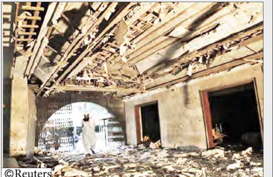
رجل يمشي بين أنقاض مزار داتا داربار في لاهور عقب الهجوم في 2 يوليو تموز 2010

للغاية عدم نشر المزيد. "اعتقد ان من المهم عدم الحاق مزيد من الضرر بامنا القومي". وأضاف كرولي ان الحكومة الأمريكية حاولت الاتصال بويكيليكس ولكنها لم تنجح في إقامة خط اتصال معها. وأعرب كل من كرولي وروبرت جينز المتحدث باسم البيت الابيض عن قلقه من احتمال ان يكشف نشر الوثائق اساليب الولايات المتحدة في جمع معلومات المخابرات وأن يعرض للخطر اشخاصا قاموا بمساعدة الولايات المتحدة.