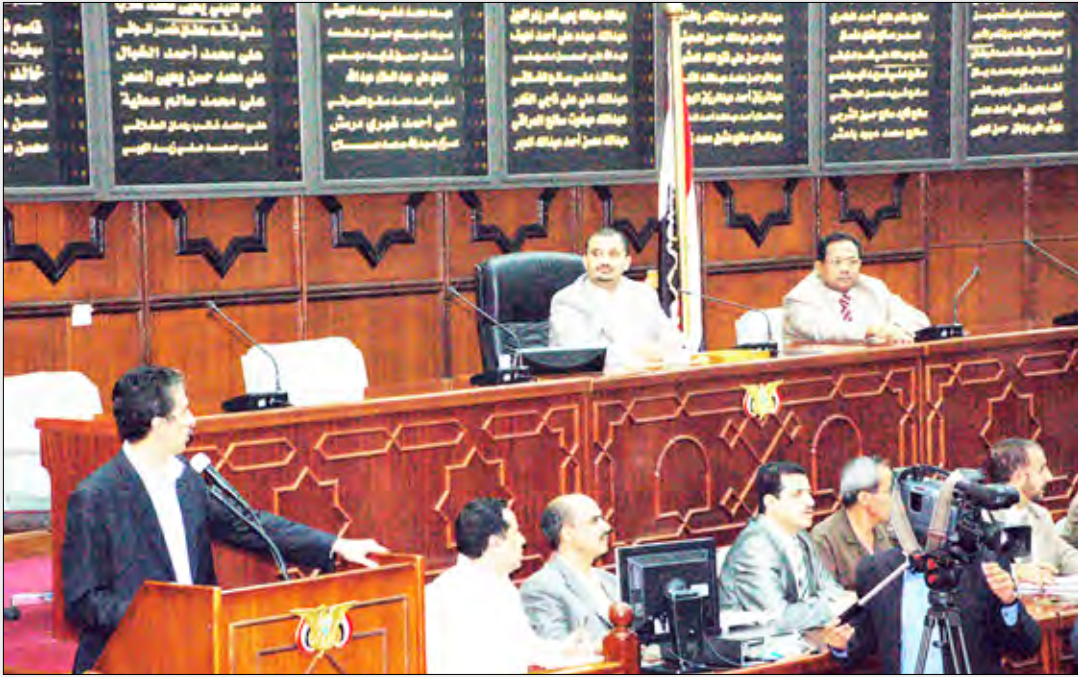
من جلسة مجلس النواب أمس

وتناولت تلك المواد حظر إدخال البضائع الأجنبية التي لا تتوفر فيها الشروط المنصوص عليها في اتفاقيات وقوانين حماية المنشأ وكذلك البضائع المستوردة التي تشكل تعدياً على أي حق من حقوق الملكية الفكرية الخاضعة للحماية بمقتضى الاتفاقيات الدولية والقوانين والتشريعات النافذة بما فيها الأوضاع المتعلقة بالرسوم.