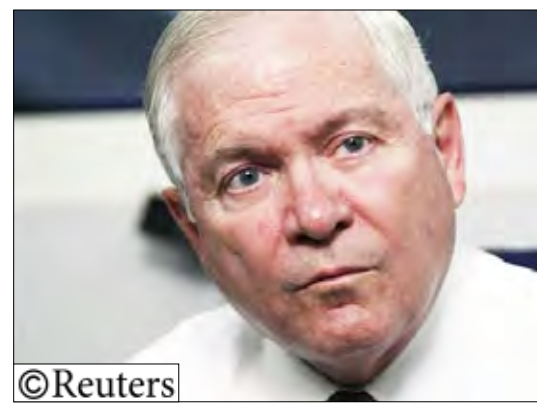
وزير الدفاع الأمريكي روبرت جينس

وقال جينز "لديكم المتحدثون باسم طالبان في المنطقة يقولون اليوم انهم يهتفون في تلك الوثائق لاكتشاف الأشخاص الذين يتعاونون مع الأمريكيين والقوات الدولية. انهم يراجعونها بحثا عن الاسماء. وقالوا انهم يعرفون كيف يعاقبون هؤلاء الأشخاص.