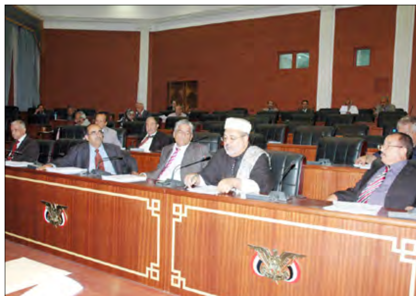
من جلسات مجلس الشورى

توصيات لجنة الإصلاح الإداري في تقريرها حول التأمينات :