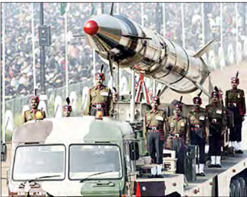
استعراض للقوات الهندية وأسلحتها النووية

بمبارات الدولارات داخل سوق الطاقة النووية الهندي، بما في ذلك تصميم موقعين لمفاعلين نوويين للتكنولوجيا الأمريكية. وأكد أن زيادة التجارة النووية المدنية مع الهند ستخلق آلاف الوظائف الجديدة للاقتصاد الأمريكي، بينما تساعد الهند على تلبية حاجاتها المتزايدة للطاقة بطريقة بيئية مسؤولة من خلال تقليص انبعاثات الكربون.