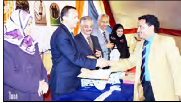
الفقيه يكرم الفائزين في المسابقة الكبرى

فضية للمركز الثاني و200 ألف ريال وميدالية برونزية للمركز الثالث. كما شهد حفل الاختتام عملية السحب للجوائز العينية وإعلان أسماء الفائزين في مسابقات التخفيضات في المراكز التجارية والجمعيات الحرفية التي رافقت المهرجان والتي فاز فيها 20 شخصا بجوائز عينية كما شهد حفل الاختتام تكريم الجمعيات المشاركة في المهرجان وعدد من الفرق المشاركة تقديرا لجهودهم المبذولة في إنجاح المهرجان. وفي تصريح لوسائل الإعلام أوضح الأخ نبيل الفقيه وزير السياحة أن المهرجان حقق نجاحا ملموسا في كافة الفعاليات الثقافية والفنية والأنشطة والبرامج المختلفة التي قدمتها الفرق المحلية والأجنبية على مدى شهر كما تضمنت مختلف أنواع الفنون الشعبية والتراثية والترويحية والمعارض التوعوية وغيرها من البرامج .. مشيرا إلى إن الوزارة تسعى إلى تقديم المزيد من الفعاليات في المهرجانات القادمة وبما ينقل حضارة وثقافة الشعب اليمني إلى شعوب العالم إلى جانب ما يقدمه مجلس الترويج السياحي في المعارض العالمية وفي استضافة عدد من الصحفيين من مختلف بلدان العالم .. لافتا إلى أن اليمن تستضيف خلال شهر أكتوبر القادم ملتقى الاستثمار السياحي العربي.