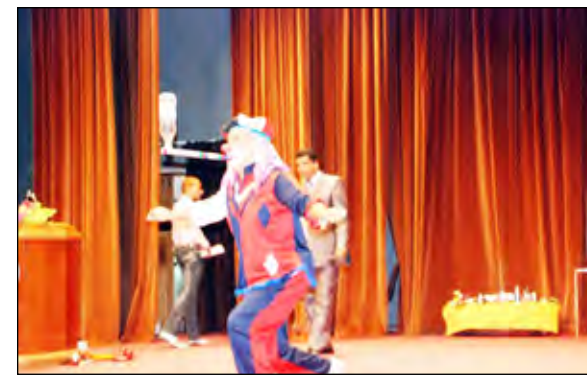
من فعاليات اختتام مهرجان (البلدة) السياحي

أن المهرجان كان هذا العام تم إقامته وسط تحديات كبيرة وكان الرهان على نجاحه يتطلب صمودا وتحصية وإصرارا، مؤكداً أن الهدف الأساسي للمهرجان يكمن في تنشيط الحركة التجارية والسياحية بالمحافظة من خلال جذب المغتربين والسياح والزوار واستغلال فرصة احتضان كمبرسح الطفل والمرأة ومدينة الألعاب والمسرحيات والكوميديا والالعاب السبر والأكروبات من الفرق الدولية المشاركة .