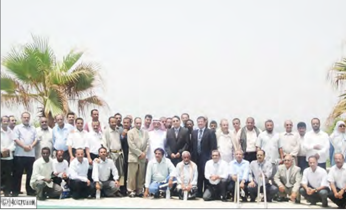
صورة جماعية للمشاركين في الورشة مع قيادات المطابع