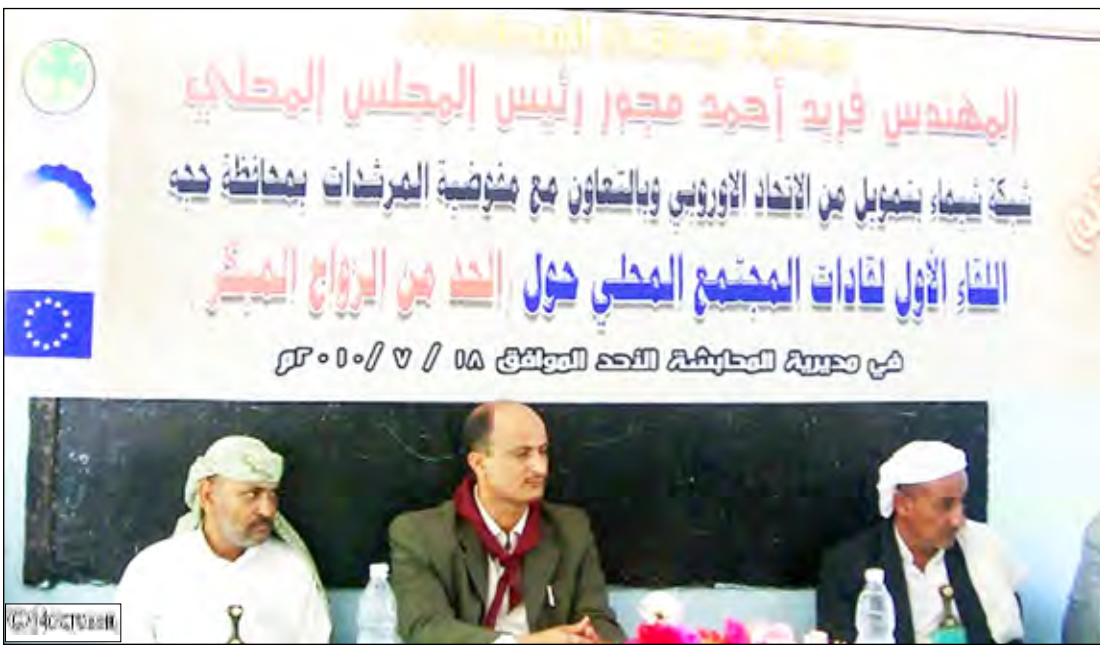
من اللقاء الأول لقيادات المجتمع بمديرية المحابشة في حجة حول الحد من الزواج المبكر

شهدت عدد من مديريات محافظة حجة منذ بداية العام الجاري عدداً من حالات الزواج المبكر تناولتها عدد من وسائل الإعلام ظهر معها مدى بشاعة الإقدام على ارتكاب مثل هذه الجرائم في حق الطفولة والأبناء سواء من أولياء الأمور أو الأزواج ، إذ أن العقل والمنطق يؤكدان عدم قدرة الطفلة على القيام بأعباء ربة البيت وهي نفسها لاتزال بحاجة إلى من يرعاها أضف إلى ذلك أنها -أي الطفلة- لم تصل إلى مرحلة استيعاب ماذا تعني المعاشرة الزوجية .. وكل ذلك وغيره من الأضرار المترتبة على الزواج المبكر على الأم والطفل والأسرة حاضرا ومستقبلا كان محط اهتمام عدد من منظمات المجتمع المدني بمحافظة حجة خاصة وأن هذا العام شهد أربع حالات زواج (مبكر) تم رصدها من قبل منظمات ووسائل إعلامية ، ما ترتب عنه تنفيذ عدد من الفعاليات التوعوية بمخاطر هذا الزواج واللقاءات الموسعة لقيادات مجتمعية في عدد من المديريات ... (14 أكتوبر) التقت بعدد من قيادات المجتمع المشاركين في اللقاء الأول لقيادات المجتمع المحلي حول الحد من الزواج المبكر بمديرية المحابشة ، الذي نظمته مفوضية المرشدات بالمحافظة بالتنسيق مع شبكة (شيماء ) الأسبوع الماضي واستطلعت آراءهم حول زواج الصغيرات وخرجت بهذه الحصيلة :