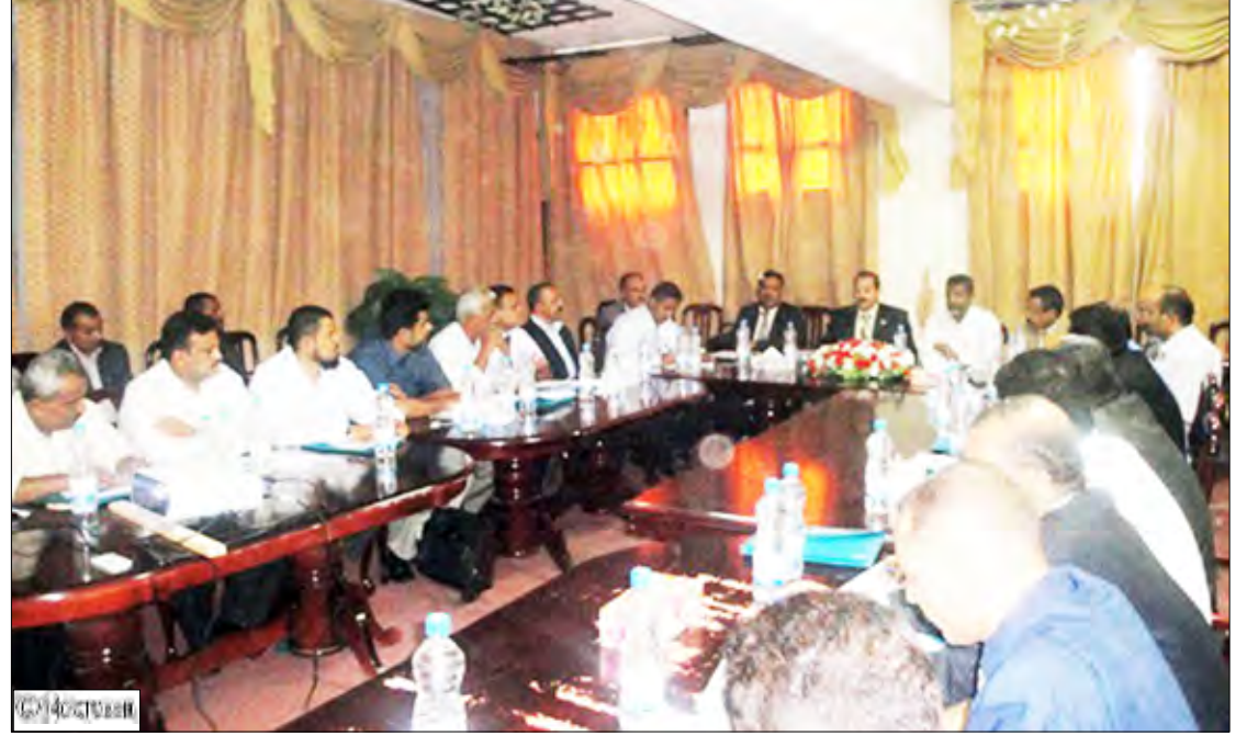
ورشة العمل الداخلية لمطابع الكتاب المدرسي

مثلة بفخامة الأخ الرئيس / علي عبدالله صالح تصحيح أوضاع المؤسسة وتقديم كل أشكال الدعم للحفاظ عليها وتطويرها لتصبح مؤسسة اقتصادية ناجحة وتعمل على أساس تنافسي في المستقبل لتواجه كافة التحديات التي ستواجهها في المستقبل. وأضاف أنه وبعد عامين من التغيير والتنفيذ الفعلي للمشروع التطويري ارتأت الإدارة الفنية للمؤسسة تنظيم أول ورشة عمل في تاريخ المؤسسة بمشاركة قيادات العمل الفني والإنتاجي وقد هدفت الورشة إلى تعريف المشاركين بأوضاع المؤسسة في العام 2008م عن طريق استعراض تقرير شركة فيجن ، وتعريفهم أيضاً بالبرنامج التطويري للمؤسسة ( 2009 / 2011 ) وما تم تنفيذه حتى الآن بالإضافة إلى استعراض ما تم إنجازه من البرنامج التدريبي والخطوات المستقبلية لتفعيله بما في ذلك التأكيد على أهمية إعادة هيكلة المؤسسة وإدخال معايير الجودة في العملية الإنتاجية وتبادل الخبرات بين القيادات الفنية والإنتاجية بين الفروع والإدارة العامة.