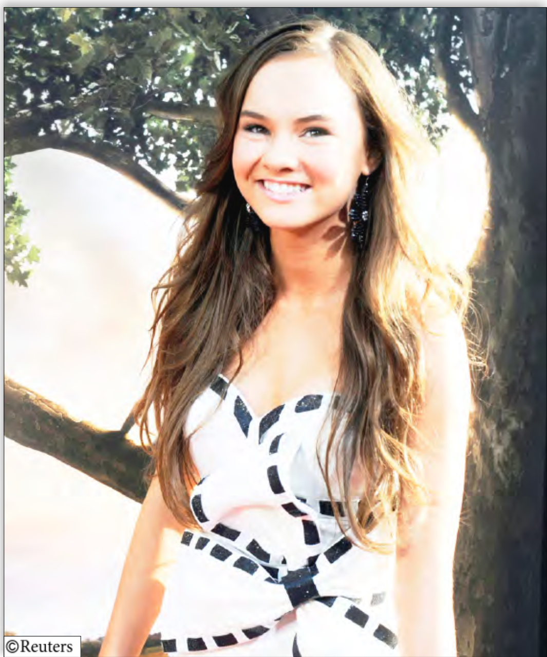
الممثلة الأمريكية كارول مادلين لدى حضورها أمس العرض الأول لفيلم ( فيلبد ) في فيلم لوس انجلوس بالولايات المتحدة .

أعلن / سبأ : تم أمس عبر أرصفة الميناء عدن تصدير الفين و 327 طناً من المنتجات اليمنية إلى عدد من البلدان العربية والاجنبية شملت نخالة القمح والاسماك والبسكويت والعمود والحلويات والسمن والجلود وثمرة دم الأخوين والألبان السائلة . وأفادت احصائية النشاط الملاحي اليومي لميناء عدن حصلت بأن شحنة نخالة القمح البالغة نحو الف طن صدرت الى مدينة الإسكندرية المصرية و200 طن من الأسماك صدرت إلى كل من تونس ولبنان ومصر والصين وهونغ كونغ في حين صدرت شحنة البسكويت والحلويات والسمن البالغة 100 طن الى جيبوتي فيما شحنة الجلود البالغة 7