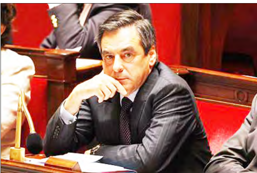
رئيس الوزراء الفرنسي فرانسوا فيون