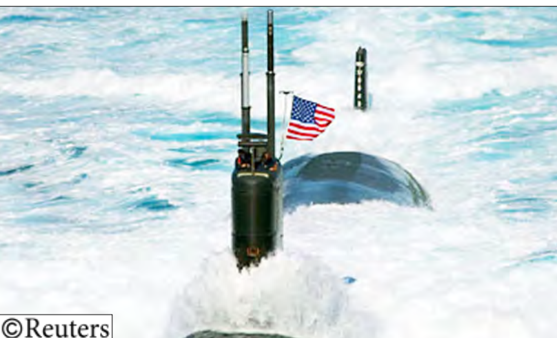
الغواصة الأميركية تاسكن أثناء مشاركتها في المناورات

يذكر أن مجلس الأمن الدولي أصدر بياناً رئاسياً أدان فيه تورط كوريا الشمالية بإغراق شيوهان، لكنه لم يفرض أي عقوبات جديدة على تلك الدولة الشيوعية.