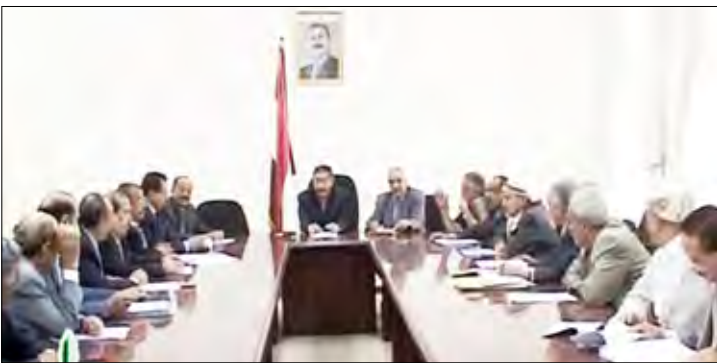
رئيس مجلس الشورى يترأس اجتماع اللجنة الرئيسية

وتضمن التقرير الخاص بالتأمينات الاجتماعية والمعاشات خمسة أقسام، تطرقت إلى تطور نظام التأمينات والمعاشات في اليمن والقوانين