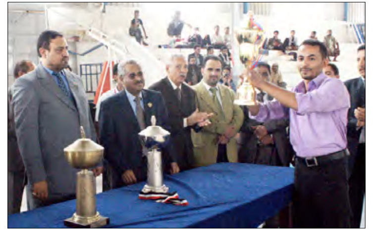
من اختتام بطولة الكونغ فو