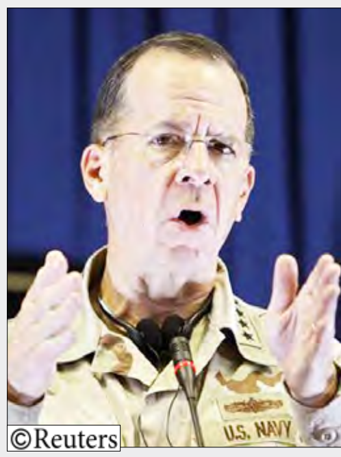
الأميرال مايك مولن رئيس هيئة الأركان الأمريكية المشتركة في مؤتمر صحفي في كابول يوم 25 يوليو تموز 2010

الماضي مما أعقبه عملية واسعة النطاق لإنقاذ، وبث خاطفو بيرجدال شرائط فيديو نبذ فيها الجندي الأمريكي الحرب ووصف الجيش الأمريكي الأمر بأنه دعابة غير شرعية.