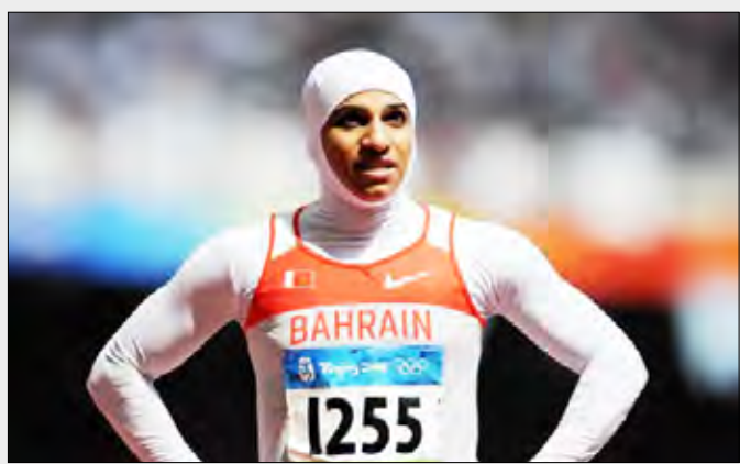
البحرينية رقية الغسرة

كما لم يتم الكشف عن نوع المادة المنشطة التي استخدمتها. وسيكون بإمكان الاتحاد البحريني لألعاب القوى استئناف القرار، ويحق للعداءة حضور جلسات استماع لتفسير وجود المادة المحظورة، خصوصاً أن الغسرة تمتلك سجلاً خالياً من تعاطي المنشطات في مشوارها الرياضي وقد عرفت بالتزامها وحرصها على التحلي بالأخلاق الرياضية وقواعد التنافس الشريف، فيما تشير بعض المصادر إلى احتمال وقوعها في هذا الخطأ بشكل غير متعمد عن طريق استخدام هذه المواد لدواعٍ علاجية وليس كمواد منشطة.