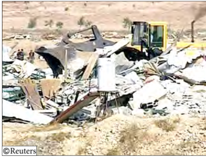
الجرافات الإسرائيلية أزالت القرية من الوجود نهائيا

رام الله (الضفة الغربية) 14 أكتوبر / رويترز: