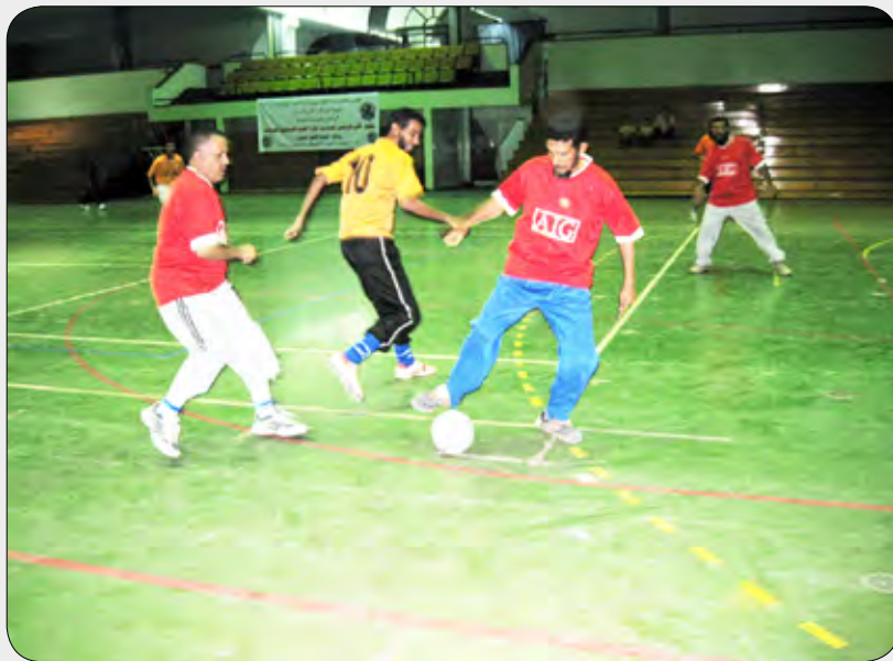
من منافسات النسخة الماضية