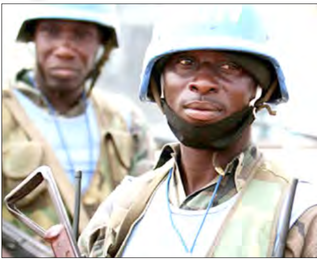
جنديان من قوات يونانيد في الفاشر عاصمة ولاية شمال دارفور