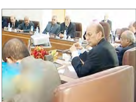
وزير الخارجية في ختام الدورة

وأضاف: «المشاركون تعرفوا خلال الدورة عن كُتب على أوضاع المغربيين اليمنيين في الخارج والفرص السياحية في اليمن ودور السفارات في الترويج لها وكذلك التعاون على فرص الاستثمار ودور السفارات في الترويج وجلب الاستثمارات فضلاً عن القضايا ذات الصلة بسياسة الإنبعاث الخارجي وأوضاع الطلاب اليمنيين والملحقيات الثقافية في دول الإبتعاث. كما تلقى المشاركون معارف شاملة في شأن العلاقة بين الإعلام والسياسة الخارجية اليمنية واليات التواصل بين السفارات اليمنية في الخارج ووسائل الإعلام المحلية.