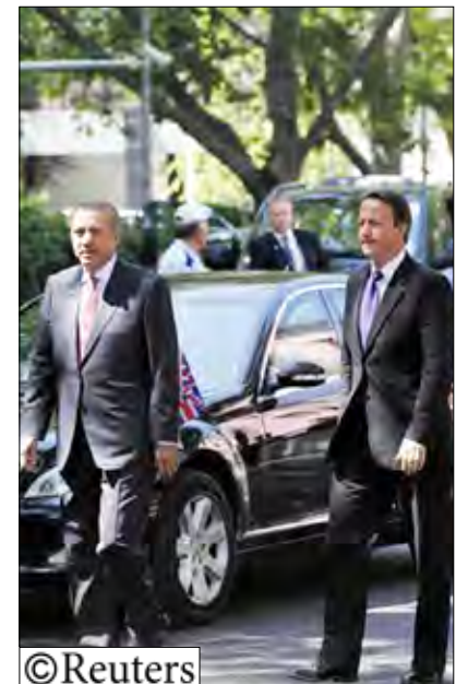
رئيس الوزراء البريطاني ديفيد كاميرون (إلى اليسار) ونظيره التركي رجب طيب أردوغان في أنقرة

«رأى واضح. من الخطأ أن نقول إن تركيا بوسعها حراسة المعسكر لكن لا يسمح لها بالجلوس في الخيمة».