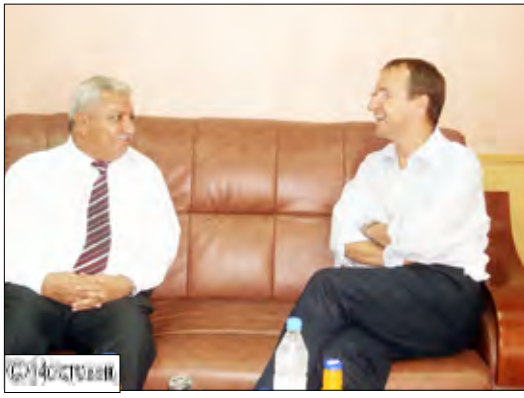
الشعبي يلتقي ممثل اليونيسيف