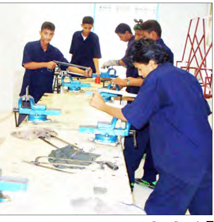
جانب من التدريب المهني

نفذ قطاع تعليم وتدريب الفتاة بوزارة التعليم الفني والتدريب المهني خلال النصف الأول من العام الجاري العديد من البرامج والأنشطة الهادفة إلى توسيع فرص مشاركة الفتيات في برامج التعليم الفني والمهني وتقديم تعليم عالي الجودة للفتيات قائم على المشاركة المجتمعية من خلال مساعدهن في الإبداع والإنتاج ومواجهة تحديات لمياء بحسب الإقليمي أن وأوضح وكيله القطاع لمياء بحسب الإقليمي أن القطاع قطع شوطاً إيجابياً في تنفيذ المهام المناطة به خلال النصف الأول من العام الجاري بهدف دعم ونشر التعليم الفني والمهني للفتيات وتوعية المجتمع بأهمية التحاق الفتاة بالتعليم الفني الذي يعد المركز الأساسي للتنمية الاقتصادية ومكافحة الفقر والحد من البطالة. وأشارت إلى أن القطاع يسعى من خلال الأنشطة والبرامج التي ينفذها إلى تقديم رسالة للمجتمع مفادها حرص الحكومة على تحقيق فرص متكافئة لجميع الفتيات للحصول على تعليم وتدريب متميزين وتفعيل المشاركة المجتمعية لدعم جودة التعليم وترسيخ ثقافة المشاركة في التنمية لكافة الفئات في المجتمع، وتشجيعهن على الانخراط في سوق العمل لرفع مستوى دخل الأسرة.