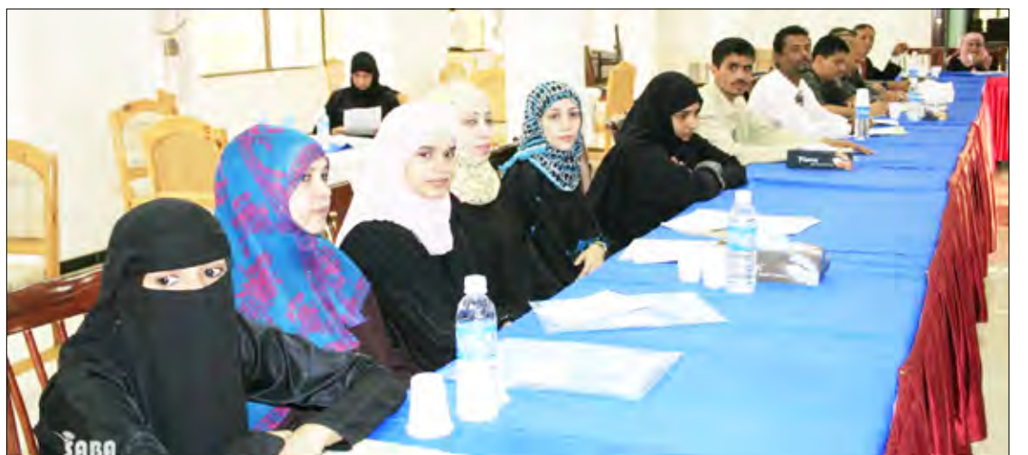
جانب من الحضور في ورشة العمل