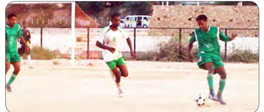
كرة قدم محلية

تلعب كل مجموعة بعضها مع بعض من مرحلة واحدة ويتأهل الأول في كل مجموعة إلى الدور نصف النهائي الذي سيكمل ضلعه الرابع أفضل فريق يحصل على المركز الثاني في المجموعات الثلاث.