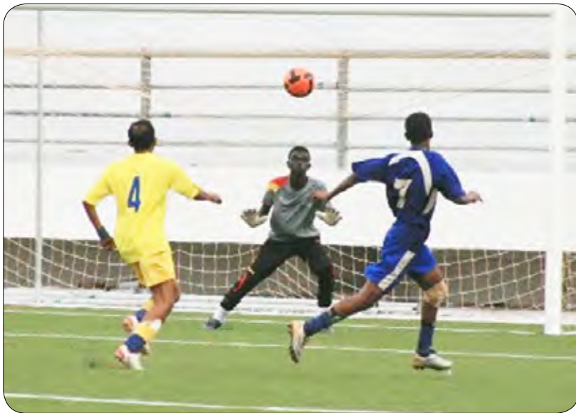
لقطة من تجمع عدن