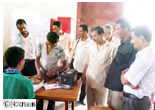
مخاطف لحج خلال زيارة المخيمات الصيفية

متنسباته (320) شابة من القرى المجاورة يتعلمن الخياطة والتطريز والأشغال اليدوية والكوافير والتريز وخصص تقوية في اللغتين الإنجليزية والعربية. كما زار الأخ المحافظ المركز الصيفي النوعي بمعهد (بومدين) بمديرية تبن الذي يتعلم فيه (200) شاب وشابة بعض المهن