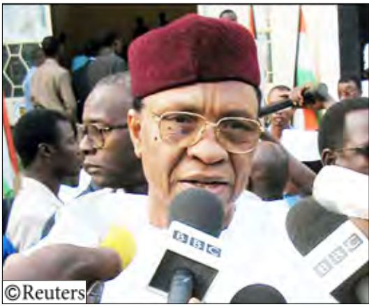
تاجنا أطلحت به مجموعة من ضباط الجيش في فبراير/شباط الماضي