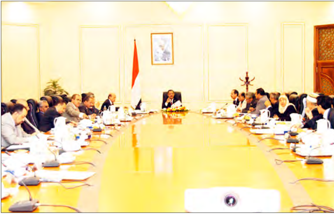
د. مجور يترأس اجتماع مجلس الوزراء أمس

ناقش مجلس الوزراء في اجتماعه الأسبوعي أمس برئاسة رئيس المجلس الدكتور علي محمد مجور مشروع لائحة عمل المنظمات غير الحكومية العربية والأجنبية العاملة في الجمهورية اليمنية المقدم من نائب رئيس الوزراء للشؤون الاقتصادية وزير التخطيط والتعاون الدولي عبد الكريم الأرحبي. ويشتمل المشروع الذي يقع في (59) مادة موزعة في (8) فصول على المعايير والشروط اللازمة لتنظيم شؤون المنظمات غير الحكومية الدولية العاملة في اليمن وكيفية التعامل معها مع تحديد الجهة التي تمنح الترخيص والإجراءات المطلوبة لمنحها والجهات التي يناط بها عملية المتابعة والمراقبة والتقييم والإشراف وذلك بهدف تنظيم العلاقة مع هذه المنظمات وغيرها من الجهات التي تدخل معها في ارتباطات عمل وحتى تستطيع هذه المنظمات نفسها التحرك في إطار قانون تنظيم هذه العملية برمتها.