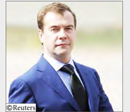
الرئيس الروسي ديمتري ميدفيدف