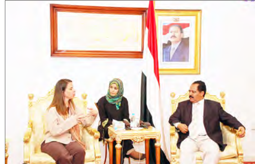
الراعي لدى لقائه مديرة المعهد الوطني الديمقراطي

التقى رئيس مجلس النواب يحيى علي الراعي أمس المدير المقيم للمعهد الوطني الديمقراطي الأمريكي للشؤون الدولية هينز ثيران. واستعرض اللقاء عدداً من الموضوعات المتعلقة بتعزيز أوجه علاقات التعاون الثنائية بين مجلس النواب والمعهد الوطني الديمقراطي للشؤون الدولية. وفي هذا الصدد أشاد رئيس مجلس النواب بمستوى العلاقات المتنامية بين الجانبين لتشمل مجالات الشراكة في تنمية العملية الديمقراطية وترسيخ مبادئها المتنوعة بما في ذلك تطوير العملية البرلمانية وما تحقّقه من نجاحات في المجالين التشريعي والرقابي.