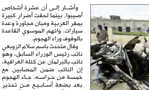
تفجيرات متكررة استهدفت زوار كربلاء مؤخرًا