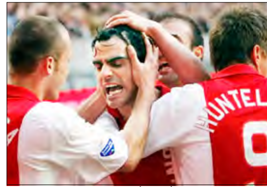
من إحدى مباريات أياكس أمستردام