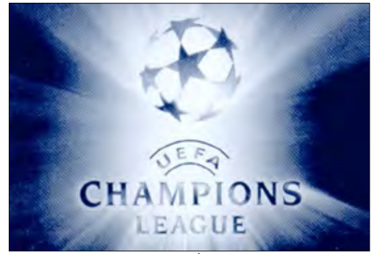
الشعار الرسمي لدوري أبطال أوروبا

على خدماته. وقال بول "لقد استغرق الأمر وقتاً طويلاً ، وهو ما لم يكن جيداً لهذا النادي". وتشهد مواجهات يوم غد الأربعاء أيضاً لقاء سبورتنج براجا ، الذي احتل وصافة الدوري البرتغالي الموسم الماضي خلف بنفيكا ، مع جلاسجو سيلتك الاسكتلندي. ويلتقي فناربخشة التركي مع مضيفه يونج بويز بيرن السويسري فيما يلتقي بارتيزان بلجراد مع هيلسينكي . ويلتقي بطل الدوري النرويجي روزنبيرج مع ايك ستوكهولم السويدي ويلتقي بيلانمو زغرب مع شريف تيراسبول ويتوجه كوبنهاجن لملاقاة باتي بوريسوف البيلاروسي ويلتقي ديبريسين المجري