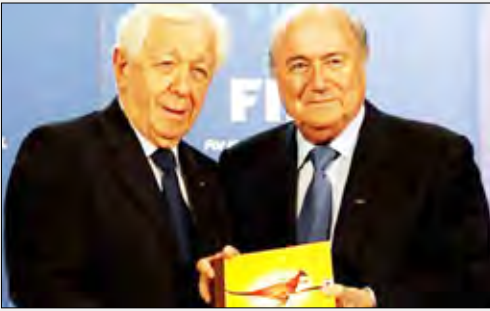
رئيس الفيفا مع رئيس الاتحاد الأسترالي لكرة القدم