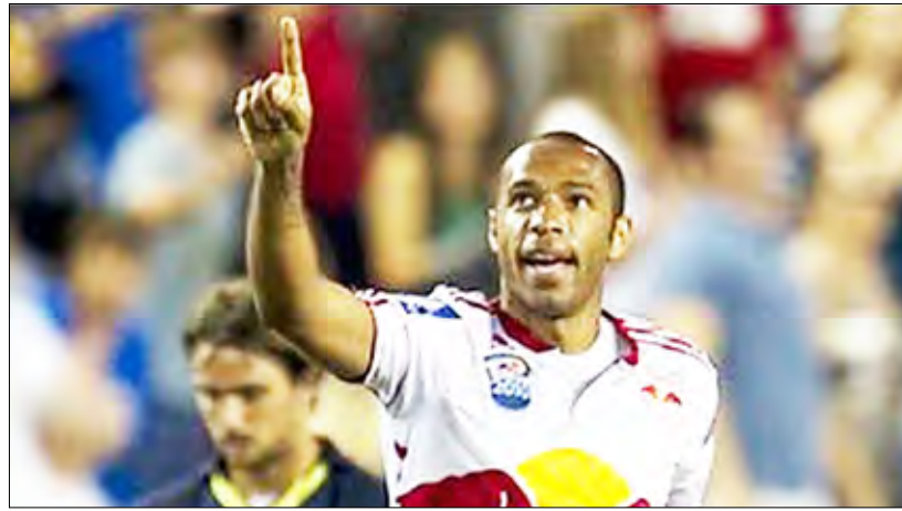
هنري بقميص فريقه الجديد