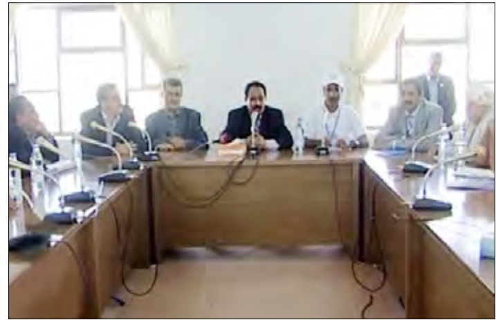
الراعي أثناء لقائه المشاركين في المخيم الوطني الصيفي الأول أمس

التقى رئيس مجلس النواب يحيى علي الراعي المشاركين في المخيم الوطني الصيفي الأول لشباب الجمهورية اليمنية في القاعة الصغرى لمبنى مجلس النواب. وأنشاء اللقاء تحدث رئيس مجلس النواب مع المشاركين في المخيم الصيفي الذي تنظمه الهيئة الوطنية للتوعية تحت شعار اليمن في قلوبنا. وقال: انتم أيها الشباب بجموعكم تشكلون لوحة وطنية أنيقة ناعمة الجمال تجسد مناخ اليمن المتنوع وروح وتطلعات شباب اليمن الواعد بمستقبل مشرق لليمن السعيد والحافل بكل الخير والسعادة والنماء والتقدم والازدهار لانكم جيل جديد نما وترعرع