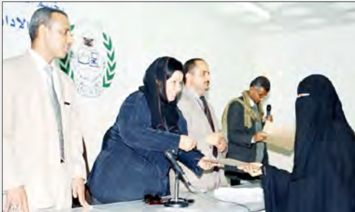
أثناء توزيع الشهادات للمشاركين في الدورة