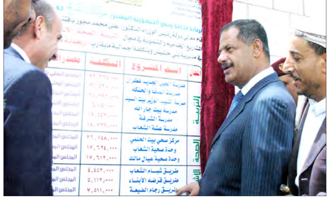
رئيس الوزراء يفتتح مشاريع خدمية