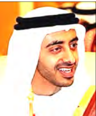
الشيخ عبدالله بن زايد

مؤسسات الحكومة الأفغانية. جاء ذلك خلال الكلمة التي القاها وزير خارجية دولة الإمارات أمام المؤتمر الدولي للمانحين من أجل أفغانستان والذي اختتم أعماله في العاصمة الأفغانية.