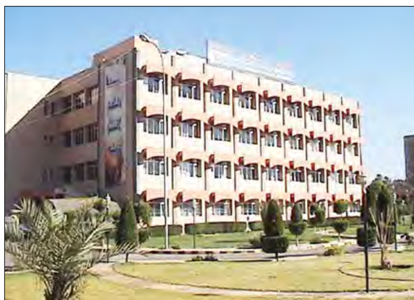
مبنى المؤسسة العامة للاتصالات السلكية واللاسلكية .

وأفاد أن الدعم الذي توليه قيادة الوزارة والمؤسسة لهذه الخدمة المهمة يأتي من كونها باتت ضرورية ومرتبطة بحياة واحتياجات شريحة واسعة من المجتمع، الذي أصبحت السمة الرئيسية فيه تبادل المعلومات وامتلاكها وكسر الحواجز المكانية والزمانية من خلال تقنيات وتكنولوجيا المعلومات والشبكية والاقتصادية وغيرها مشيراً إلى أنه منذ اللحظة الأولى التي دخلت فيها (يمن نت) كمزود لخدمات الإنترنت كان التركيز على كسر احتكار خدمات الإنترنت التي كانت تقدم من قبل تيليم (واي نت) وكذا تقديم خدمة بتكلفة أقل ونسعى جاهدين إلى