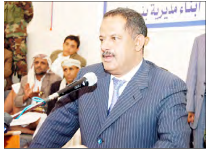
رئيس الوزراء يلقي كلمة في حفل تسليم الدفعة الأولى من التعويضات