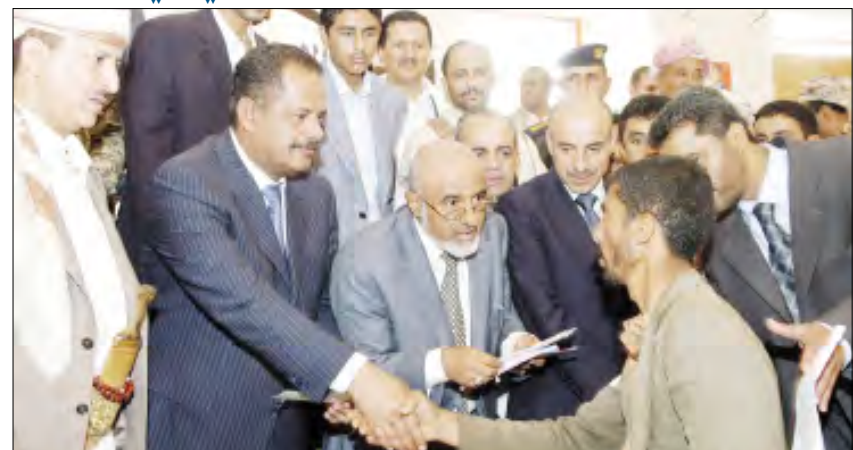
د. مجور لدى تسليم تعويضات الدفعة الأولى للمتضررين في بني حشيش أمس

على عبدالله صالح وتوليته قيادة البلاد في عام 1978. وقال: لقد حصل عهد فخامة الرئيس عناوين العزة والكرامة والتنمية والمنجزات العظيمة التي تنصدها إعادة تحقيق الوحدة اليمنية وإشاعة مناخ الحرية والديمقراطية.