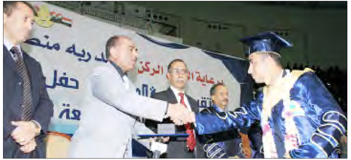
وزير الإعلام أثناء تكريم الخريجين