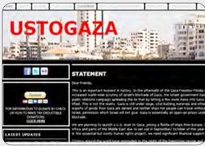
موقع التبرع من الأمريكيين إلى غزة

من نوعه في تحدي سياسة الولايات المتحدة الخارجية والتأكيد على التزام الجميع باحترام حقوق الإنسان والقانون الدولي"، وفقاً لما ورد عنهم في موقع (USTOGAZA) الذي أسسوه معزراً بـصور وفيديوات ودعوات متنوعة لدعم الرحلة.