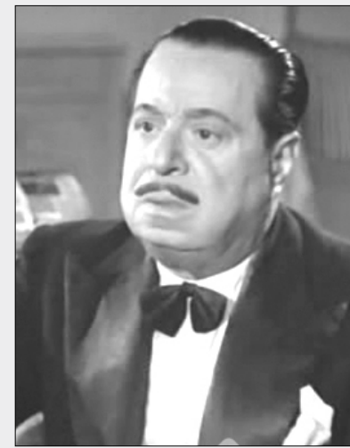
الفنان الراحل حسين رياض

وعندما بدأت السينما اتجه إليها حسين رياض وأصبح أحد فرسانها، وأول أفلامه (ليلي بنت الصحراء) عام 1937 مع الفنانة بهيجة حافظ وكان أجره وقتها 50 جنيهًا، وظل يعمل في السينما حتى بلغ عدد أفلامه نحو 320 فيلمًا ، تنوعت أدواره فيها بين