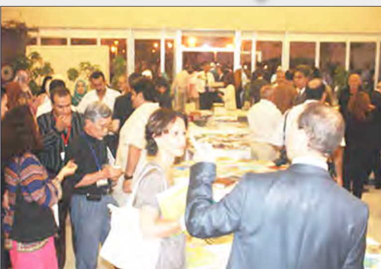
معرض الكتب في منتدى أصيلة الثقافي

الصعيد الدولي، ويعود جزء من الفضل في هذا إلى الدعم المتواصل الذي تقدمه هيئة أبوظبي للثقافة والتراث لصناعة الكتاب. ويبقى الإقبال على الكتاب الإماراتي شاهداً على جودة المطبوعات التي يصدرها الناشر الإماراتيون.