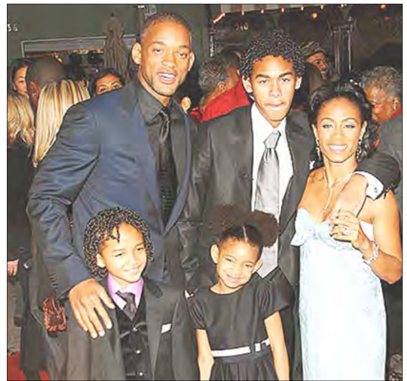
عائلة الممثل ويل سميث

كشف الممثل الأمريكي الشهير ويل سميث أنه لا يستطيع أن يمنع نفسه من البكاء عندما يرى ابنه جادين (12 عاماً) على شاشة السينما. ونقل الموقع الإلكتروني (شوبيز سباي) المعني بأخبار المشاهير عن سميث (41 عاماً) القول إنه يسعد جداً عندما يرى ابنه يعمل بجد. وذكر سميث أنه يرى أن ابنه يستمتع كثيراً بالعمل في مجال السينما. وقد بدأ أيضاً مستمتعاً خلال تصوير فيلم (كارات كيد) الذي يلعب فيه دور البطولة. وقال النجم الأسمر الذي أنتج هذا الفيلم بالاشتراك مع زوجته جادا بينكت سميث: "لا أستطيع إخفاء مشاعري فأنا أشعر بسعادة جملة كل مرة عندما أرى ابني على شاشة السينما.