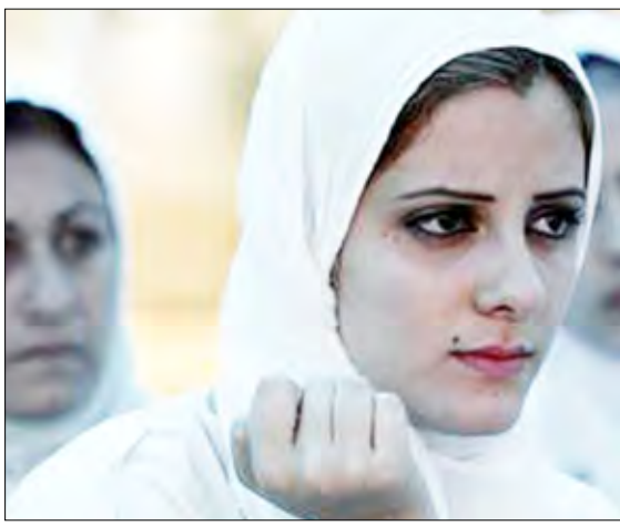
يغسلون بلباسهم الأبيض 3 مرات في مياه دجلة

وما زالت أصول هذه الديانة غامضة. ويقول وجهواهم إنها نشأت في بلاد الرافدين لكن المجموعة انتقلت إلى القدس بسرع قبل أن تعود إلى بلد منشأها. ولا يمارس الصابئة أي نشاطات تشييرية. ولهذه الطائفة وجود في العراق وأستراليا وإيران والسويد وهولندا وألمانيا.