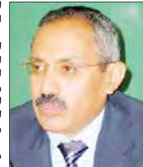
د. غازي الأغبري

السياسية تبنت أجنحة وطنية طموحة للإصلاحات في مختلف المجالات. وأكد أنه فضلاً عن ذلك تبنت اليمن الإجراءات الهادفة تحسين البيئة الاستثمارية وتوسيع المشاركة السياسية وتنمية الديمقراطية وحقوق الإنسان. مبيناً جهود الحكومة اليمنية في ما يتعلق بالإجراءات المتخذة لمكافحة الإرهاب وتمويله ومكافحة غسيل الأموال. وأكد الوزير الأجنبي، أن ما تحقق من إصلاحات في المجالات المختلفة ما كان له أن يتحقق لولا وجود إرادة سياسية داعمة ممثلة بدعم ومتابعة فخامة الأخ الرئيس علي عبدالله صالح رئيس الجمهورية. وقد جرى في الاجتماع مناقشة تقرير وتوصيات مجموعة أصدقاء اليمن وملاحظات وردود الحكومة اليمنية على تلك التوصيات والإجراءات المقترحة لتنفيذها.