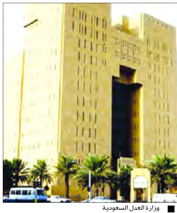
وزارة العدل السعودية