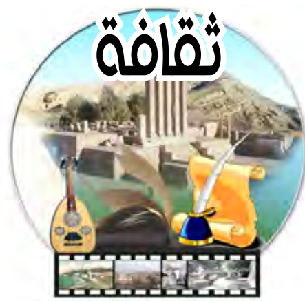
إشراف / فاطمة رشاد

القاهرة 14 أكتوبر، أعدت مجلة "قصيدة النثر"، التي يحررها إلكترونيا الشاعر المصري هشام الصباحي، في إصدارها الجديد (يوليو/2010) ملفاً موسعاً عن الشاعر شريف الشافعي، ونشرت في العدد ذاته مجموعة من القصائد والدراسات النقدية لكل من: أمجد ناصر، كولاة نوري، محمد خير، د.أحمد الخميسي، سليم الحاج قاسم، عماد فؤاد، مدحت منير، أشرف العناني، وآخرين. جاء ملف المجلة بعنوان "الألي يتنفس شعراً"، وتضمن تجميعاً لعدة دراسات ومقالات بأقلام مصرية وعربية عن متتالية شريف الشافعي الشعرية "الأعمال الكاملة لإنسان ألي" التي