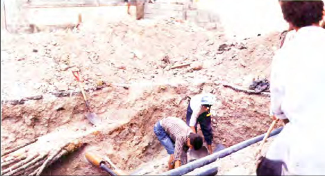
مسار كابلات في محافظة تعز