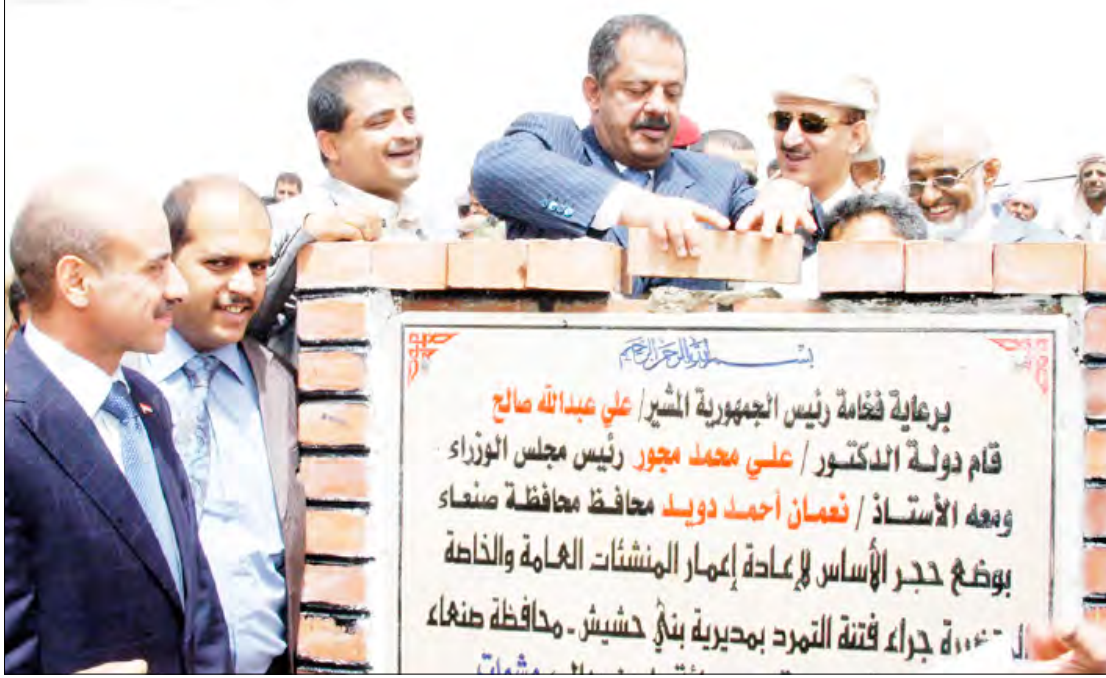
.. يوضع الحجر الأساس لمشروع إعادة إعمار المنشآت