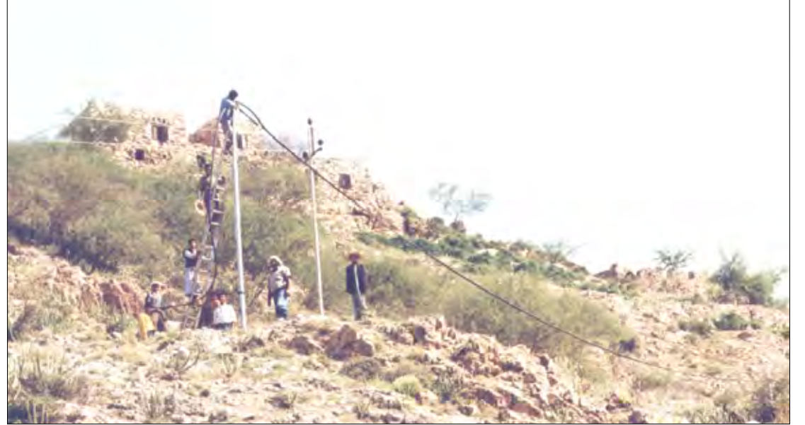
عمود كابيل هوائي في محافظة إب