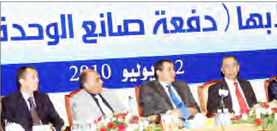
أبورأس واللوزي أثناء حضورهما حفل تخرج جامعة المستقبل أمس

وتحدث أبورأس عن المنجزات التي تحققت للتعليم العالي في عهد الوحدة المباركة والتمثلة في إنشاء العديد من الجامعات والمعاهد والكلية الحكومية والأهلية، وتشجيع الدولة للاستثمار في مجال التعليم العالي من قبل القطاع الخاص باعتباره شريكاً في تنمية المجتمع اليمني.