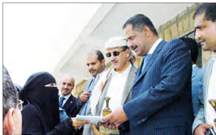
رئيس الوزراء يسلم الدفعة الأولى من التعويضات للمتضررين

دشن رئيس مجلس الوزراء الدكتور علي محمد مجور أثناء زيارته أمس لمديرية بني حشيش بمحافظة صنعاء ومعه محافظ المحافظة نعمان دويد عملية تسليم الدفعة الأولى من التعويضات لمجموعة من المتضررين جراء أعمال التخريب التي قامت بها عناصر التخريب والتمرد في المديرية عام 2008 .