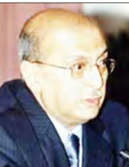
د. ابوبكر القرني

أفادت مصادر مطلعة في صنعاء أن الرئيس علي عبدالله صالح قد وافق على صفقة لشراء أسلحة من روسيا خلال زيارته لموسكو في 17 يوليو 2010م. وقال وزير الخارجية الدكتور أبو بكر القرني في تصريح لوكالة الأنباء اليمنية (سبأ): إن عملية الإفراج عن الصيادين اليمنيين المحتجزين جاءت بعد أن بذلت السفارة اليمنية بالقاهرة قصارى الجهود لدى وزارة الخارجية المصرية والجهات المعنية الأخرى في مصر.