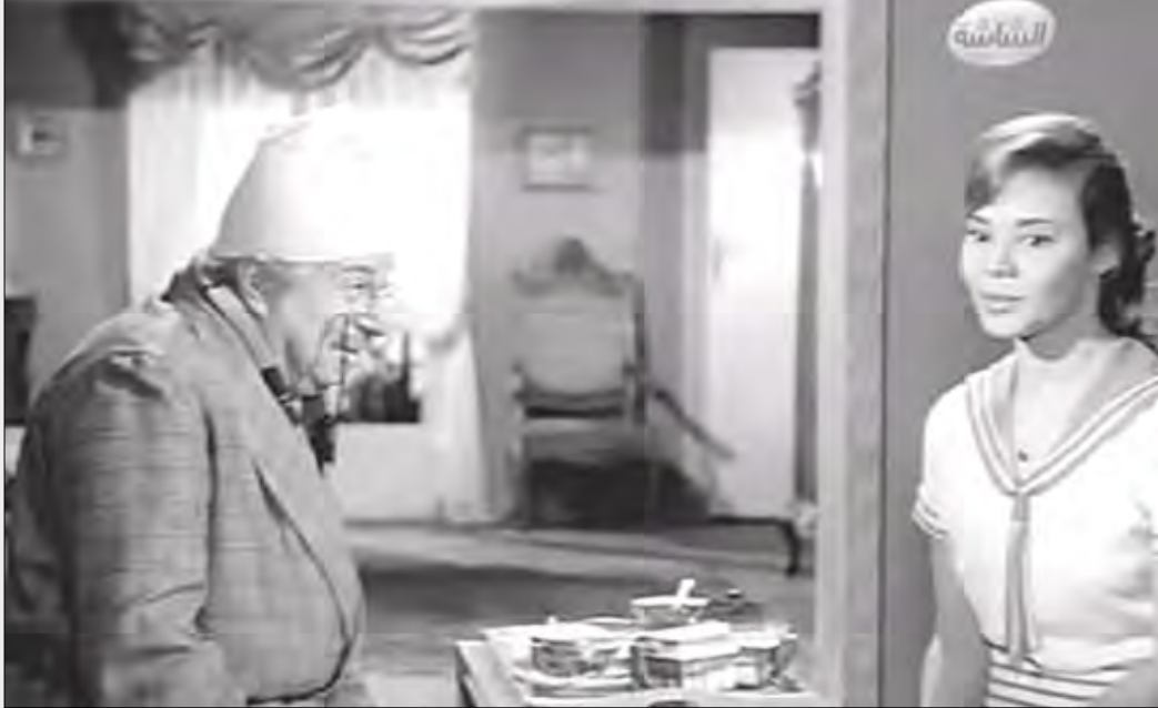
من أحد أفلامه

مرت 45 عاماً على رحيل الفنان الكبير حسين رياض أحد رموز السينما المصرية على مدى تاريخها، بدأ هوايته في التمثيل أثناء دراسته الثانوية فانضم إلى فريق الهواة بالمدرسة وكان مدربه إسماعيل وهبي شقيق الفنان يوسف وهبي، فعمل في أول مسرحية في حياته وهي (خلي بالك من إمي) وكانت بطلاً المسرحية روز اليوسف، وحتى لا تعرفه أسرته غير اسمه من حسين محمود شفيق إلى حسين رياض وظل يعمل لعدة فرق مسرحية فعمل مع فرقة الريحاني، ومنيرة المهدي، وعلي الكسار، وعكاشة، ويوسف وهبي، وفاطمة رشدي، واتحاد الممثلين عام 1934.