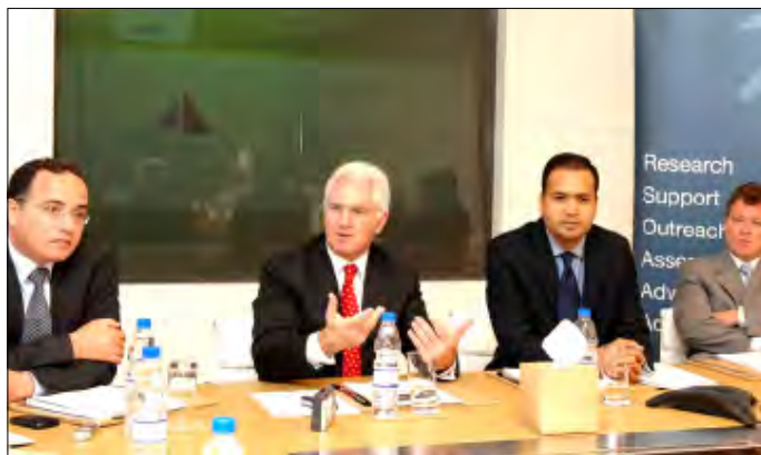
استمرار نمو الاستثمارات في منطقة الشرق الأوسط