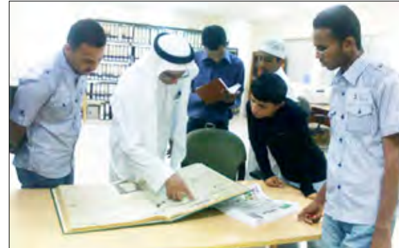
طلاب الإعلام يطلعون على مكتبة وأرشيف صحيفة عكاظ

مجلات التعاون مع المؤسسات الشقيقة واتاحة الفرص التدريبية للطلاب، وكذا في إطار اهتمامات الشيخ المهندس عبدالله احمدمشاقان رئيس مجلس الأمناء بجامعة عدن بضرورة التطبيق الصيفي للطلاب في شتى المجالات. ويواصل الطلاب تدريبهم بمجموعة من المؤسسات الإعلامية بمدينة جدة تشمل شركة لاند مارك المتخصصة في مجال العلاقات العامة ومركز إنتاج قناة (art) وأستوديوهات قناة فور شباب إضافة إلى قسم الإعلام بكلية الآداب بجامعة الملك عبدالعزيز.