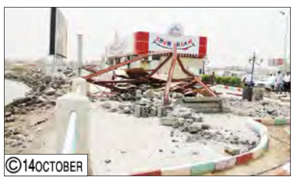
من آثار تهديم المشروع الاستثماري

وعلمت (14 أكتوبر) أن الدكتور عبدالجليل الشعبي رئيس المنطقة الحرة وبدن وكيل المحافظة لقطاع الاستثمار أحمد الضلاحي والعميد ركن عبدالله قيران مدير امن المحافظة قد نزولوا إلى الموقع الذي دكته جرافات بلدية خورمكس ، كما تم تشكيل لجنة للتحقيق في الموضوع في حين لم تفلح محاولات الصحيفة بالاتصال بأي من المسؤولين للحصول على إفادات أكثر .