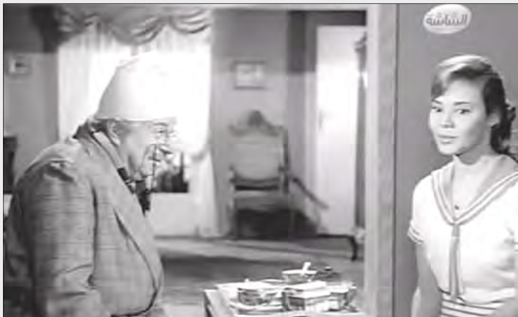
من احد افلامه

مرت 45 عاماً على رحيل الفنان الكبير حسين رياض أحد رموز السينما المصرية على مدى تاريخها، بدأ هوايته في التمثيل أثناء دراسته الثانوية فانضم إلى فريق الهواة بالمدرسة وكان مدربه إسماعيل وهبي شقيق الفنان يوسف وهبي، فعمل في أول مسرحية في حياته وهي (خلي بالك من إمي) وكانت بطلا المسرحية روز اليوسف، وحتى لا تعرفه أسرته غير اسمه من حسين محمود شفيق إلى حسين رياض وظل يعمل لعدة فرق مسرحية فعمل مع فرقة الريحاني، ومنيرة المهدي، وعلي الكسار، وعكاشة، ويوسف وهبي، وفاطمة رشدي، واتحاد الممثلين عام 1934.