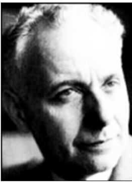
الفرنسي لويس أراغون