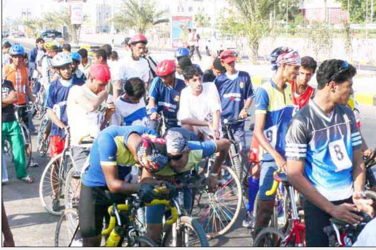
تعز / حمي محفوظ :

أكد الأخ محمد عيادروس رئيس الاتحاد اليمني العام للدراجات الهوائية ان الاتحاد سوف ينظم بطولة الجمهورية للنخبة من سن 18 وما فوق بمشاركة 86 متسابقاً يمثلون مختلف محافظات الجمهورية خلال الفترة من الرابع حتى السابع من شهر أغسطس المقبل في محافظة تعز. تشدين البطولة ستكون على ثلاث مراحل، تتمثل في الآتي : - المرحلة الأولى لمسافة 25 كيلومتراً فردي ضد الساعة - المرحلة الثانية لمسافة 80 كيلومتراً فردي عام - المرحلة الثالثة لمسافة 60 كيلومتراً فردي عام