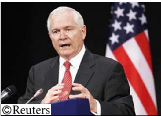
وزير الدفاع الأمريكي روبرت جيتس

بين الأهمية التي يوليها الرئيس الأمريكي باراك أوباما للعلاقات مع كوريا الجنوبية.