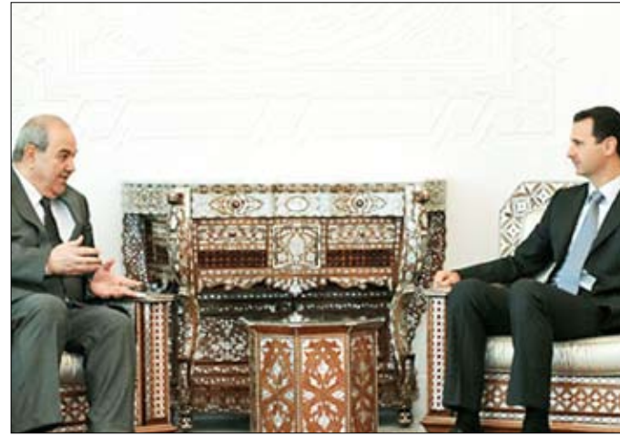
الأسد (يمين) جدد علاوي دعمه لأي اتفاق بين العراقيين يدعم وحدة وعروبة العراق

وأثناء حديثه في مؤتمر صحافي بدمشق يوم أمس الأول الأحد، قال الصدر لدى سؤاله عن سعيه لرئاسة الوزراء، «أنا لا أدمع أشخاصا، وإنما أدمع البات وبرنامجا محمدا يصل بواسطته إلى رئاسة الوزراء شخص معين تنطبق عليه الشروط».