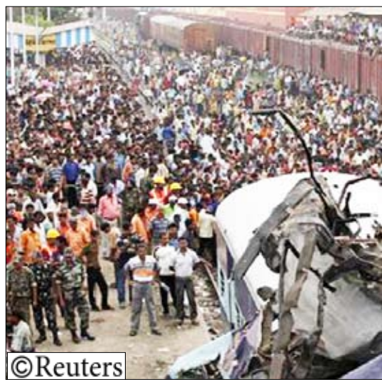
جنود ومواطنون يتجمعون في موقع تصادم قطارين في الهند أمس الاثنين

اللافتات. وقال مسؤول بالمنطقة ان الحادث وقع عندما اصطدم قطار اوتار بانجار اكسبريس بقطار فاناتشال اكسبريس المتوقف في محطة سانثيا في ولاية البنغال الغربية.