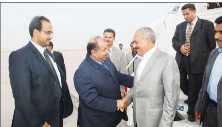
لدى وصول رئيس الجمهورية مدينة المكلا أمس