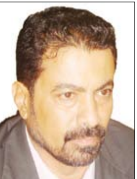
د. عدنان عمر الجفري

عدن / نبيل غالب: أكد الأخ عدنان عمر الجفري محافظ محافظة عدن رئيس المجلس المحلي أن يوم 17 يوليو عام 1978م اكتسب أهمية بالغة في التاريخ اليمني المعاصر انطلاقاً من كونه قد مثل البداية الحقيقية لمسيرة الدولة اليمنية الديمقراطية المعاصرة.