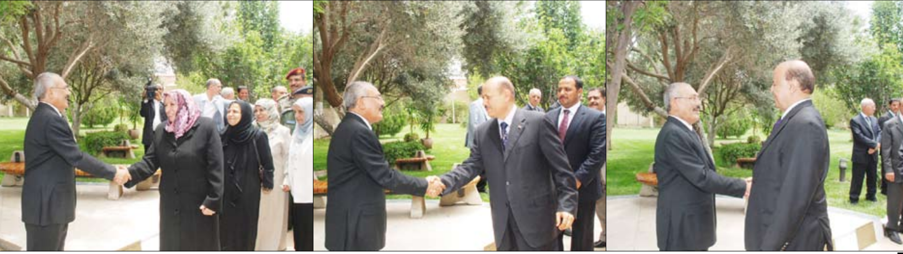
رئيس الجمهورية لدى استقباله المهنيين بذكرى السابع عشر من يوليو