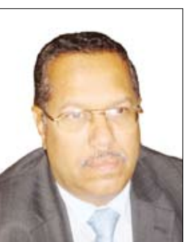
د. احمد عبيد بن دغر

منعاه / متابعات: أكد الدكتور احمد عبيد بن دغر الأمين العام المساعد للمؤتمر الشعبي العام أن يوم انتخاب الرئيس علي عبدالله صالح رئيساً للجمهورية في السابع عشر من يوليو 1978م يمثل مرحلة مهمة في تاريخ اليمن المعاصر لأن منصب الرئاسة في ذلك الوقت كان