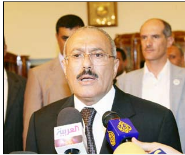
رئيس الجمهورية يلقي كلمة توجيهية

والمعارضة هي الوجه الآخر للنظام السياسي، وبلد تعددي، بلد ديمقراطي، وكل ما حدث - للأسف - فيه تشويه للديمقراطية في اليمن وتضخيم إعلامي، لأن ما يحصل من مباحثات ومساجلات تندرج في الإطار الديمقراطي، والمفروض ألا يضيق صدر أحد من العملية الديمقراطية.