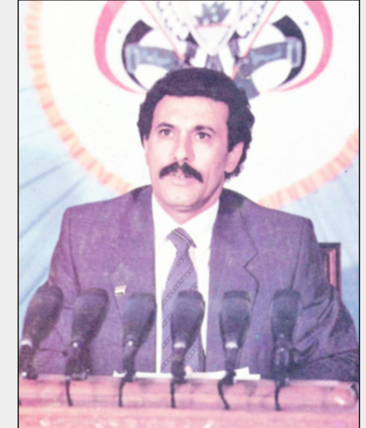
علي عبدالله صالح ينتخب من قبل مجلس الشعب التأسيسي رئيساً للجمهورية

مجلس الشورى على إعطائه رتبة (فريق) عرفانا ووفاء لما بذله من جهود عظيمة لتوحيد الوطن وقيام الجمهورية اليمنية . - في 22 مايو 1990م قام برفع علم الجمهورية اليمنية بمدينة عدن وإعلان إعادة تحقيق الوحدة اليمنية وإنهاء التشظي إلى الأبد، وفي نفس اليوم اختير رئيسا لمجلس الرئاسة للجمهورية اليمنية . - انتخب رئيسا لمجلس الرئاسة مجددا، بتاريخ 16 أكتوبر 1993م، بعد أول انتخابات نيابية . - تصدى لكل محاولات تمزيق الوطن ومؤامرة الانفصال، وقاد معارك الدفاع عن الوحدة وحماية الديمقراطية والشرعية الدستورية أثناء إعلان الانفصال وفترة الحرب التي أشعلها الانفصاليون في صيف 1994م حتى تحقق النصر العظيم للوحدة اليمنية وإرادة الشعب اليمني في يوم السابع من يوليو 1994م . - انتخب رئيسا للجمهورية من قبل مجلس النواب، وذلك بتاريخ 1 أكتوبر 1994م، بعد إجراء التعديلات الدستورية التي أقرها المجلس بتاريخ 28 سبتمبر 1994م . - في 24 ديسمبر 1997م أقر مجلس النواب منحه رتبة مشير تقديرا لدوره الوطني والتاريخي في بناء اليمن الجديد . - في 23 سبتمبر عام 1999م تم انتخابه رئيسا للجمهورية في أول انتخابات رئاسية تجرى في اليمن عبر الاقتراع الحر والمباشر من قبل الشعب . - في 20 سبتمبر 2006م، تم انتخابه رئيسا للجمهورية في ثاني انتخابات رئاسية عبر الاقتراع الحر والمباشر وحصل على 4 ملايين و149 ألفا و673 وبنسبة 77.17٪ . - كرس كل جهوده من أجل تحقيق نهضة تنموية شاملة في اليمن، ومن أبرز المنجزات التنموية الإستراتيجية التي تحققت في ظل قيادته، إعادة بناء سد مأرب العظيم، استخراج النفط والغاز، تحقيق تنمية زراعية كبيرة، إقامة المنطقة الحرة بعدن . - مؤسس الدولة اليمنية الحديثة المرتكزة على الديمقراطية وتعددية