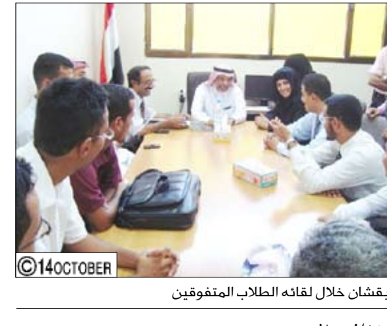
بفتشان خلال لفتاة الطلاب المتفوقين