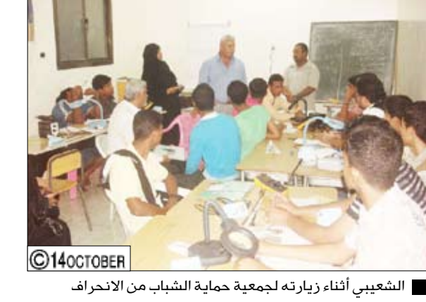
الشعبي أثناء زيارته لجمعية حماية الشباب من الانحراف

بالتعزيز / سيا: افتتح شاعر اليمن الكبير المستشار الثقافي لرئيس الجمهورية الدكتور عبدالعزيز المقالح يوم أمس الأربعاء بصنعا معرض الفنان الفوتوغرافي عبدالرحمن الغابري. وجال الدكتور المقالح بأجنحة المعرض متمليا جديد عدسة الفنان الغابري في اقتناص وتجسيد مفاتن اليمن ومعلمه عبر صور معطرة بأريج محبته وافتقانه بالجمال في كل مناطق اليمن. وفي الافتتاح الذي حضره سفير اليمن في جمهورية الصين الشعبية عبدالملك المعلمي قدم الفنان الغابري شرحا موجزا عن محتويات المعرض الذي ضم مجموعة من الصور الفوتوغرافية لمناظر طبيعية من مختلف مناطق الجمهورية.