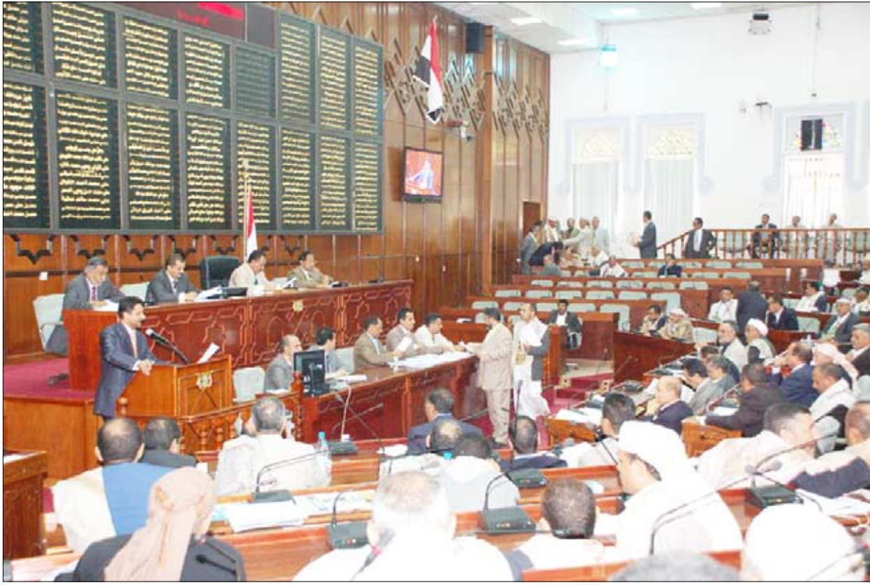
من جلسة مجلس النواب أمس

وقدمت أثناء ذلك العديد من الآراء والملاحظات والمقترحات لخصتها رئاسة المجلس وعرضتها على القاعة للموافقة.