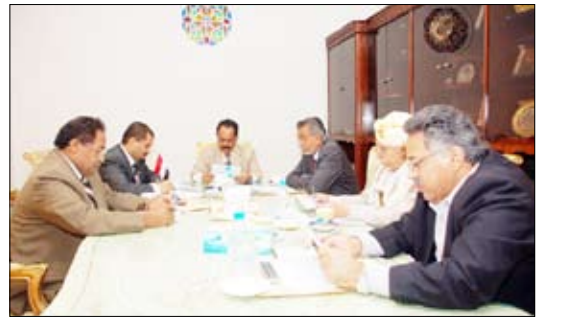
الراعي يترأس اجتماعاً برئاسة هيئة مجلس النواب

ناقشت هيئة رئاسة مجلس النواب في اجتماعها يوم أمس الأربعاء برئاسة رئيس المجلس رئيس الهيئة يحيى علي الراعي عددا من القضايا المتصلة بعمل المجلس التشريعية والرقابية المعروضة على دورته الحالية، واتخذت إجراءات المناسية. وفي الاجتماع تحدث رئيس مجلس النواب بكلمة أكد فيها أهمية مضاعفة الجهود لتعزيز الأداء البرلماني بشقيقه التشريعي والتشريعي. وأثنى على الإنجازات التي حققها المجلس خلال السنوات الماضية التي تدرج ضمن التحولات الديمقراطية والتشورية والمكاسب والإنجازات التي تحققت للوطن في ظل القيادة الحكيمة فخامة الأخ الرئيس علي عبدالله صالح رئيس الجمهورية، منذ توليه قيادة مسيرة التنمية في الوطن وهي المناسبة التي ستحل ذكرها الثانية والثلاثين خلال أيام .. وأدعا التهانى باسم أعضاء هيئة رئاسة مجلس النواب إلى فخامة الأخ الرئيس وإلى أبناء الشعب اليمني بهذه المناسبة وتمنياتهم لفخامته وبموفقو الصحة والسعادة والعمر المديد وتحقيق المزيد من الانتصارات السياسية والاقتصادية والاجتماعية والثقافية للوطن.