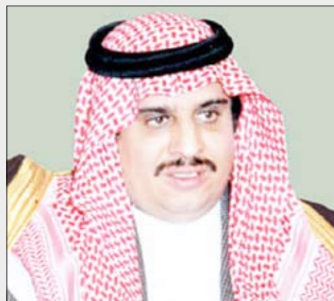
الأمير سلطان بن فهد

وأشار صاحب السمو الملكي الرئيس العام لرعاية الشباب إلى أن القرار يأتي في إطار ما توليه القيادة - رعاهم الله- من رعاية واهتمام للقائمين للشباب والرياضي في المملكة وحرصها على كل ما يحقق للشباب الرقي والتطور في جميع مكوناتها والوصول بالرياضة السعودية إلى أعلى درجات التفوق والإنجاز على ساحات المنافسة القارية والدولية .. من جانبه أوضح سمو الأمير نواف بن فيصل بن فهد بن