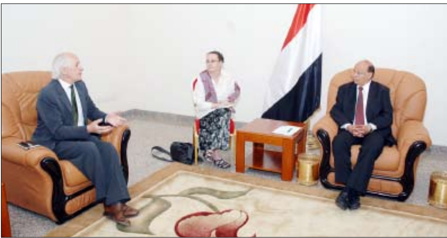
نائب الرئيس لدى لقائه مسؤول الشرق الأوسط بالمفوضية الأوروبية أمس

صنعاء / سيا: استقبل الأخ عبدربه منصور هادي نائب رئيس الجمهورية أمس مدير دائرة الشرق الأوسط وجنوب المتوسط في المفوضية الأوروبية توماس دويلا ديل الذي يزور اليمن حالياً. و جرى خلال اللقاء مناقشة عدد من القضايا والموضوعات المتصلة بالعلاقات المشتركة بين اليمن والاتحاد الأوروبي في مختلف المجالات. وأعرب الأخ نائب الرئيس عن سروره البالغ لهذا اللقاء الطيب مقدراً تقديراً عالياً اهتمامات الاتحاد الأوروبي بشؤون اليمن وقضاياها، مستعرضاً جملة من الأوضاع على مختلف مستوياتها.