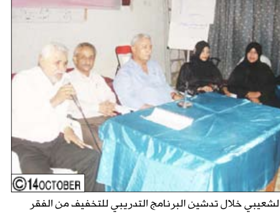
الشعبي خلال تشدين البرنامج التدريبي للتخفيف من الفقر