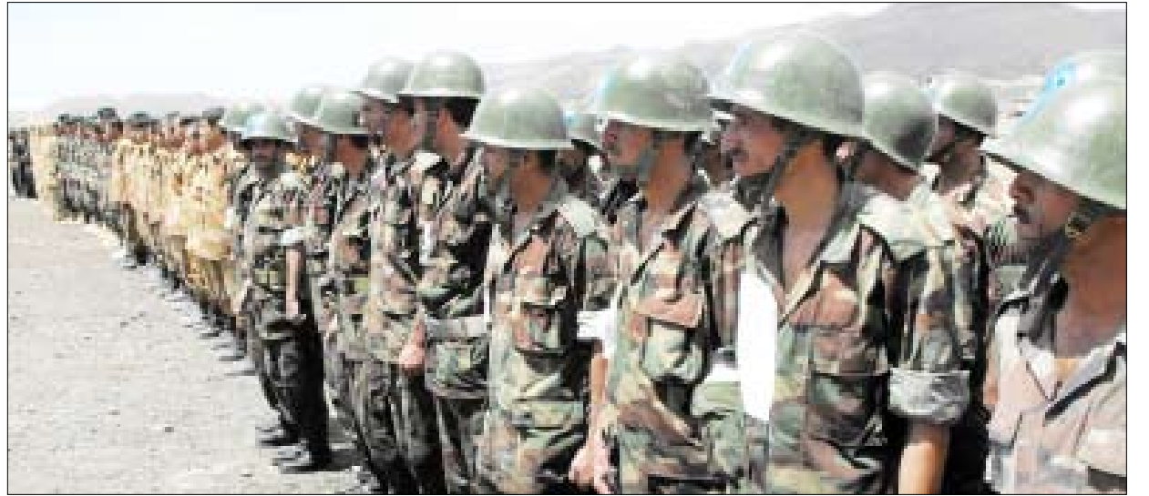
رئيس الجمهورية يلقى كلمة توجيهية على أفراد مركز تدريب الحرس الجمهوري أمس