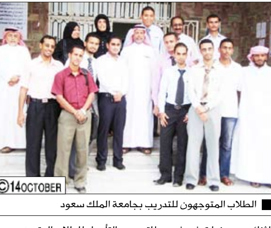
الطلاب المتوجهون للتدريب بجامعة الملك سعود

بالتعزيز / سيا: افتتح شاعر اليمن الكبير المستشار الثقافي لرئيس الجمهورية الدكتور عبدالعزيز المقالح يوم أمس الأربعاء بصنعا معرض الفنان الفوتوغرافي عبدالرحمن الغابري. وجال الدكتور المقالح بأجنحة المعرض متمليا جديد عدسة الفنان الغابري في اقتناص وتجسيد مفاتن اليمن ومعلمه عبر صور معطرة بأريج محبته وافتقانه بالجمال في كل مناطق اليمن. وفي الافتتاح الذي حضره سفير اليمن في جمهورية الصين الشعبية عبدالملك المعلمي قدم الفنان الغابري شرحا موجزا عن محتويات المعرض الذي ضم مجموعة من الصور الفوتوغرافية لمناظر طبيعية من مختلف مناطق الجمهورية.