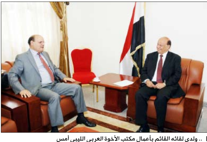
ولدى لقائه القائم بأعمال مكتب الأخوة العربي الليبي أمس

صنعاء / سيا: استقبل الأخ عبدربه منصور هادي نائب رئيس الجمهورية أمس القائم بأعمال مكتب الأخوة العربي الليبي بصنعاء السيد محمد طيلمون. و جرى خلال اللقاء مناقشة طبيعة العلاقات القائمة بين البلدين والشعبين الشقيقين من مختلف الجوانب خصوصاً في ظل تميز العلاقات الأيوبية بين الزعيمين القائدين الرئيس علي عبدالله صالح رئيس الجمهورية وأخيه العقيد معمر القذافي. وأكد نائب الرئيس أهمية تفعيل مهام اللجان المشتركة بين البلدين في سبيل تطوير وتعزيز تلك العلاقات للوصول بها إلى الأفق المنشودة. ودعا الشركات الليبية إلى الاستثمار في اليمن، مؤكداً أنها ستحظى