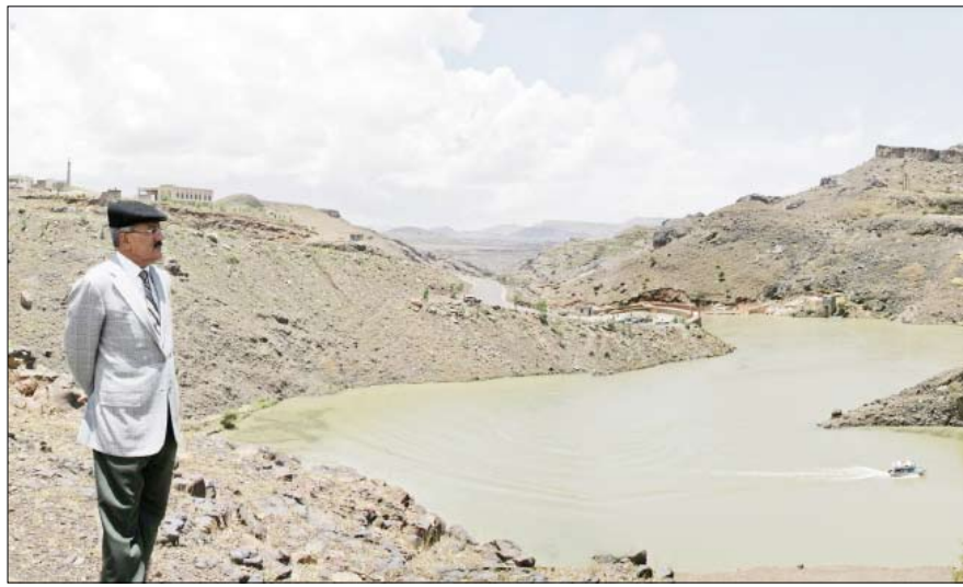
ولدى تفقده إحدى مديريات محافظة صنعاء أمس

صنعاء / سيا: قام فخامة الأخ الرئيس علي عبدالله صالح رئيس الجمهورية أمس بزيارات تفقدية لعدد من مديريات محافظة صنعاء أطلع فيها على حجم السيول التي تدفقت في عدد من مناطق تلك المديرية إثر هطول الأمطار الغزيرة التي من بها الله تعالى على بلادنا خلال الأيام القليلة الماضية. وتفقد فخامته خلال الزيارة مساقط المياه التي تدفقت منها السيول إلى سد شلال بني مطر الذي تبلغ سعته 187 ألف متر مكعب وارتفاعه 20 متراً وطول بحره المسد 800 متر، حيث ستسهم المياه المحتجزة في السد في تغذية المياه الجوفية للأبار الواقعة في المنطقة والقرى المجاورة لها على مدار العام فضلاً عن توفير المياه لري المحاصيل الزراعية بما يسهم في زيادة الإنتاج الزراعي من الحبوب والخضروات والفواكه