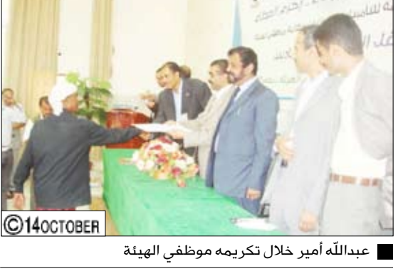
عبدالله أمير خلال تكريمه موظفي الهيئة

بالتعزيز / سيا: افتتح شاعر اليمن الكبير المستشار الثقافي لرئيس الجمهورية الدكتور عبدالعزيز المقالح يوم أمس الأربعاء بصنعا معرض الفنان الفوتوغرافي عبدالرحمن الغابري. وجال الدكتور المقالح بأجنحة المعرض متمليا جديد عدسة الفنان الغابري في اقتناص وتجسيد مفاتن اليمن ومعلمه عبر صور معطرة بأريج محبته وافتقانه بالجمال في كل مناطق اليمن. وفي الافتتاح الذي حضره سفير اليمن في جمهورية الصين الشعبية عبدالملك المعلمي قدم الفنان الغابري شرحا موجزا عن محتويات المعرض الذي ضم مجموعة من الصور الفوتوغرافية لمناظر طبيعية من مختلف مناطق الجمهورية.